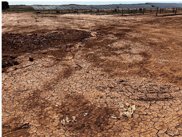
Figura 2 Restos de plásticos

El acopio logístico de materiales para la fase de construcción se ha realizado de manera correcta en las zonas destinadas para esta labor.