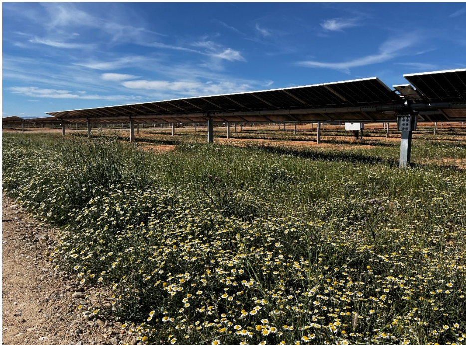
Figura 6 Crecimiento de la vegetación