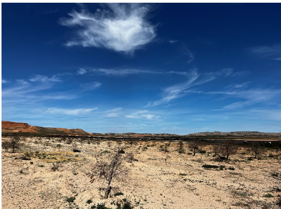
Figura 7 Masa de pinar trasplantada