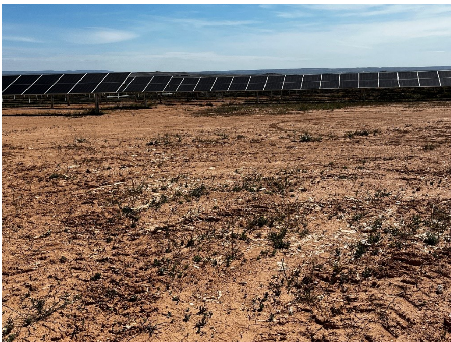
Figura 5 Restos de plásticos en el exterior de la planta