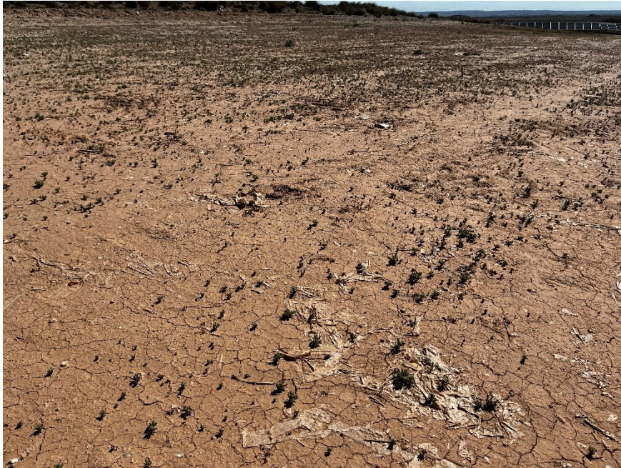
Figura 4 Restos de plásticos en el exterior de la planta

El presente anexo se compone de un número representativo de fotografías del total realizado durante el periodo evaluado, escogidas por su relevancia y/o carácter explicativo para la correcta comprensión del presente informe.