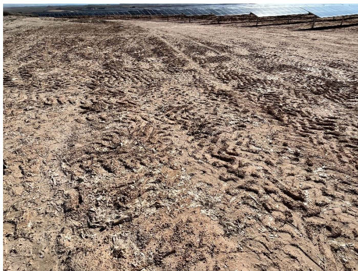
Figura 2 Restos de plásticos

El acopio logístico de materiales para la fase de construcción se ha realizado de manera correcta en las zonas destinadas para esta labor.