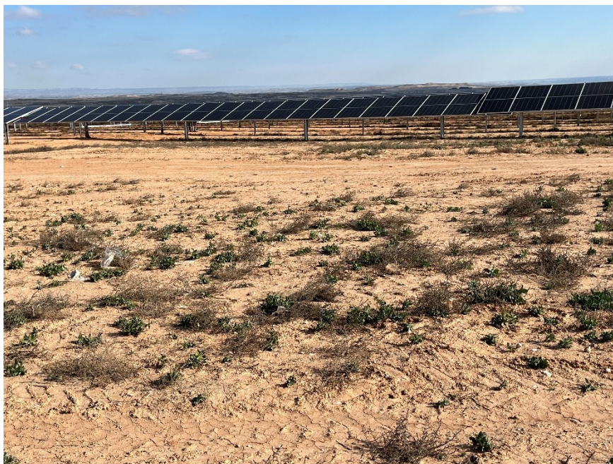
Figura 4 Restos de plásticos

El presente anexo se compone de un número representativo de fotografías del total realizado durante el periodo evaluado, escogidas por su relevancia y/o carácter explicativo para la correcta comprensión del presente informe.