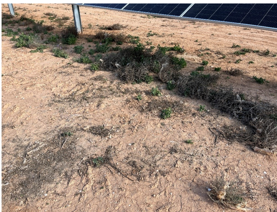
Figura 5 Restos de plásticos