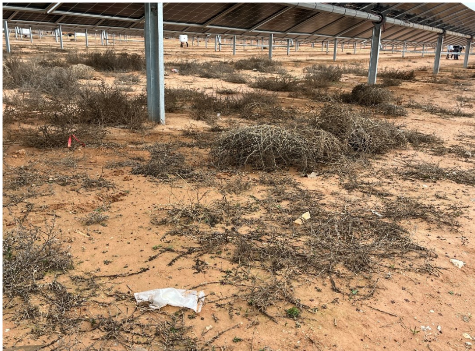
Figura 6 Restos de plásticos