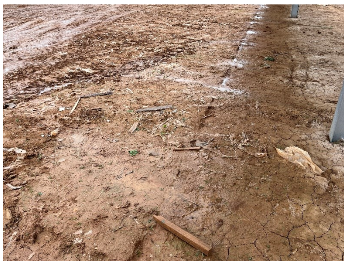
Figura 2 Restos de plásticos

El acopio logístico de materiales para la fase de construcción se ha realizado de manera correcta en las zonas destinadas para esta labor.