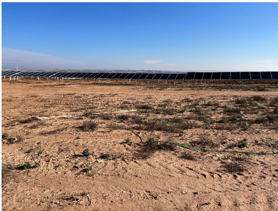
Figura 5 Restos de plásticos