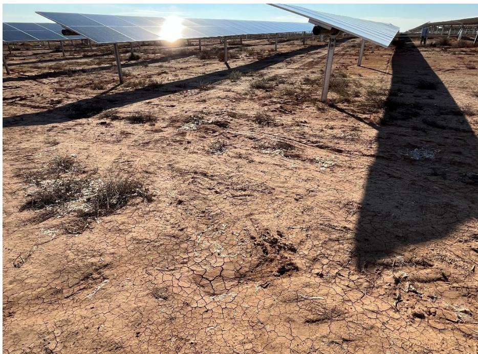
Figura 6 Restos de plásticos