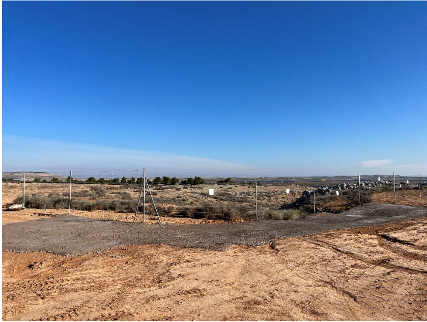
Figura 4 Cimentación de zonas potencialmente erosivas

El presente anexo se compone de un número representativo de fotografías del total realizado durante el periodo evaluado, escogidas por su relevancia y/o carácter explicativo para la correcta comprensión del presente informe.