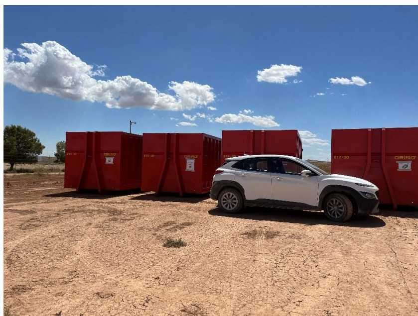
Figura 3 Punto limpio RNP dispuesto dentro de la planta

El punto limpio de residuos no peligrosos de la zona de acopio logístico y el dispuesto dentro de la planta consta de cinco contenedores, uno para restos plásticos (bolsa de basura, botellas, tubos corrugados...), cartón, flejes, madera y plástico blando. También hay una zona para los restos de ferralla.