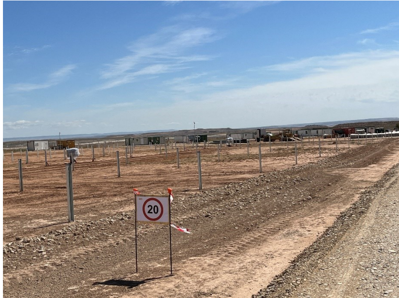
Figura 4 Señalización en obra

La obra dispone de cuba de agua y se realizan riegos con regularidad. Además, la obra cuenta con un límite de velocidad establecido de 20km/h para reducir de esta forma las emisiones de polvo.