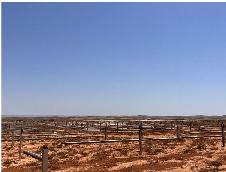
Figura 2 Montaje de los trackers

Durante este mes, se ha continuado con el montaje de los trackers (Figura 2).