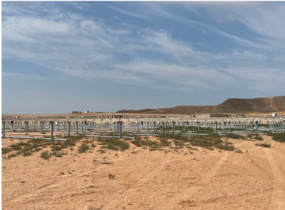
Figura 7 Montaje de los trackers