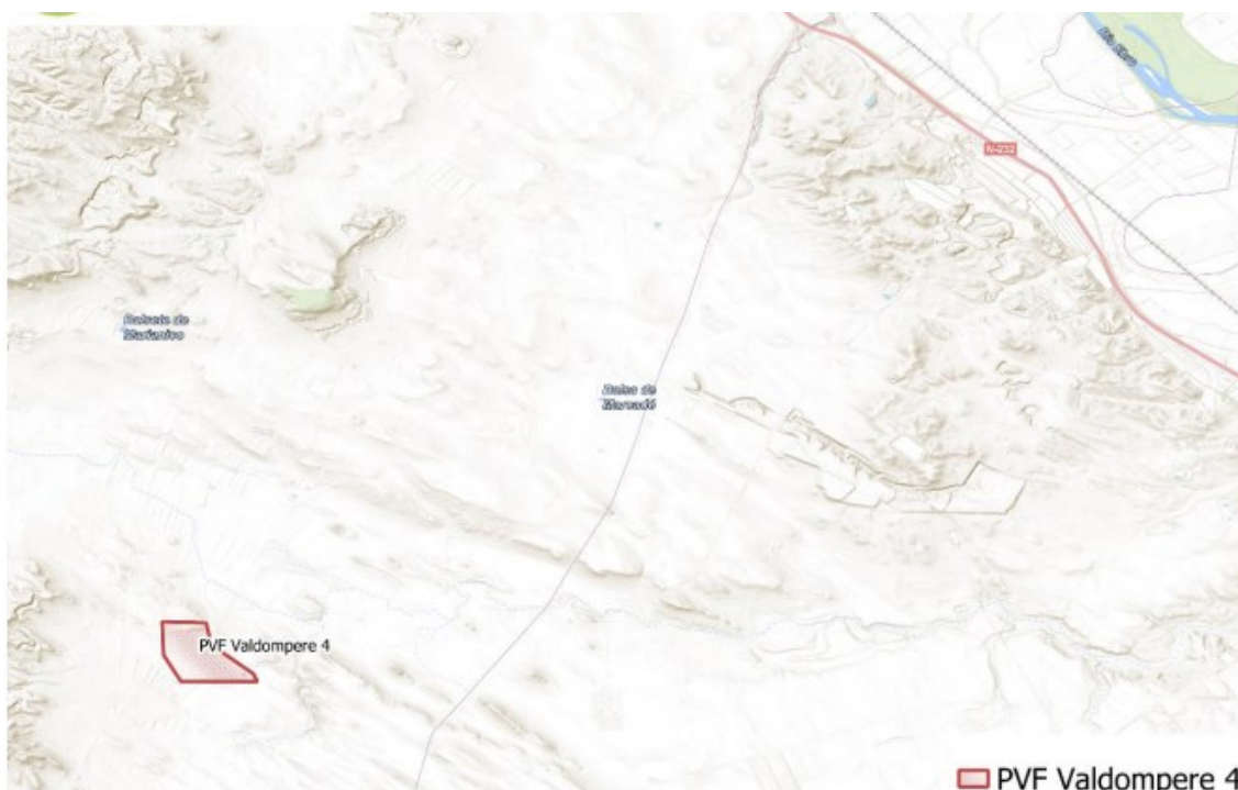
Figura 1 Localización del proyecto

El parque fotovoltaico (Figura 1) se encuentra en las cercanías de la N-232 y junto a la delimitación del término municipal de Quinto, el cual se encuentra a 7,5 km al Este del emplazamiento del proyecto, mientras que el núcleo de población más cercano al parque fotovoltaico es el propio municipio de Fuentes de Ebro, situado a aproximadamente 9 km al Norte del vallado perimetral del parque fotovoltaico objeto de proyecto.