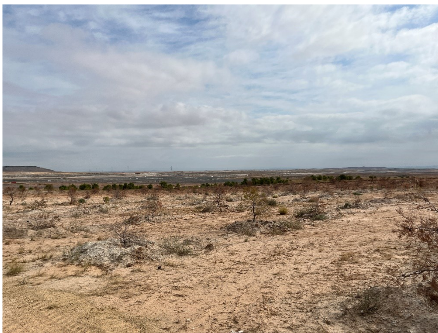
Figura 6 Masa de pinar trasplantada