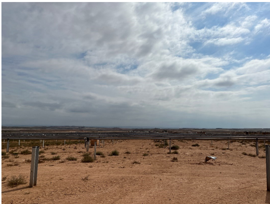
Figura 8 Montaje de los trackers