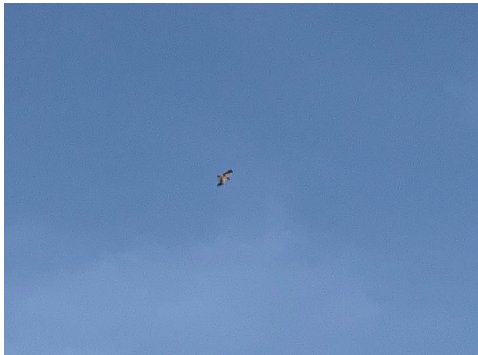
Figura 9 Aguilucho lagunero