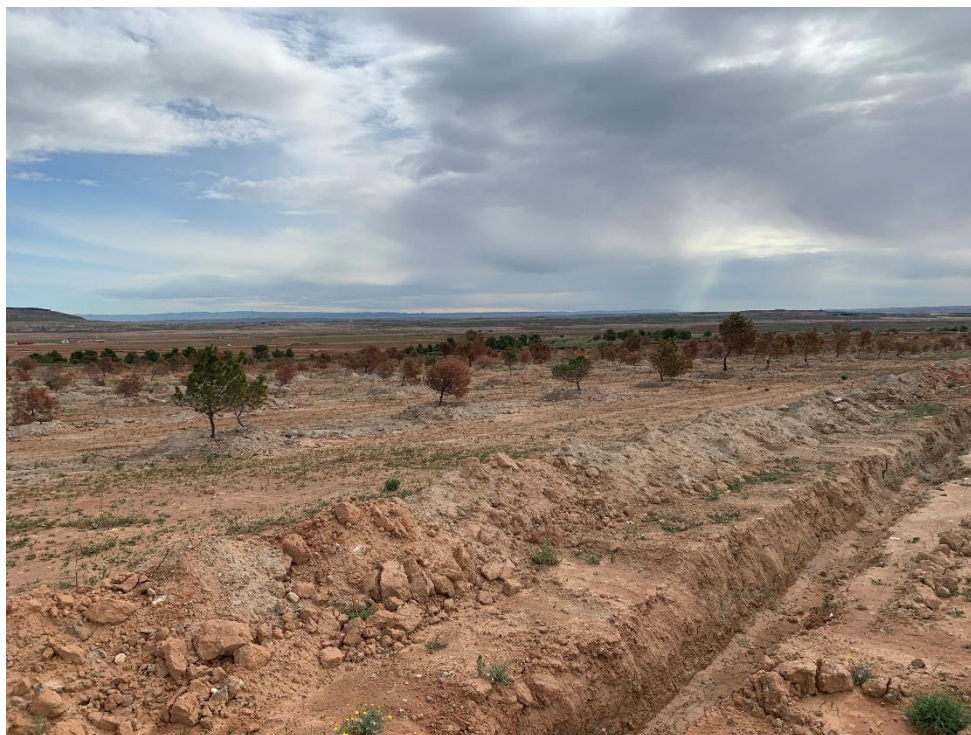
Figura 7 Masa de pinar trasplantada