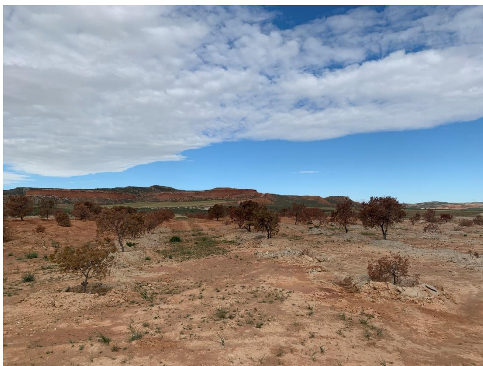
Figura 8 Masa de pinar trasplantada