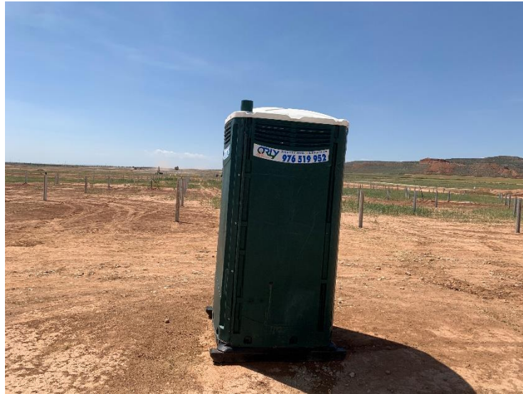
Figura 3 Baños químicos

La ejecución de los trabajos no afecta a cauces ni cursos de agua, tanto temporales como permanentes y la gestión de aguas residuales (baños químicos) se realiza correctamente.