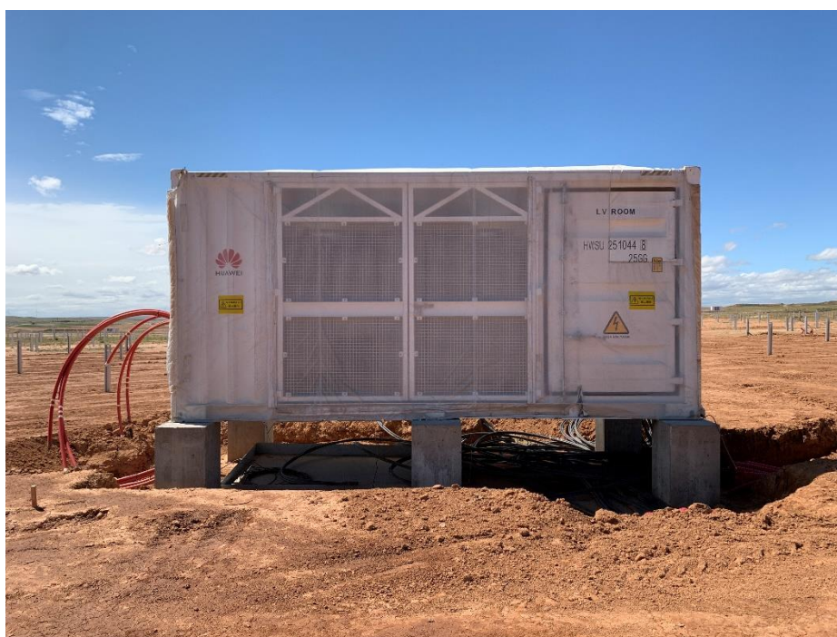
Figura 2 CT

Durante este mes, se ha continuado con la red inferior de tierras, tendiendo el cable de media y baja tensión.