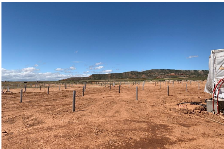
Figura 5 Hincado

El presente anexo se compone de un número representativo de fotografías del total realizado durante el periodo evaluado, escogidas por su relevancia y/o carácter explicativo para la correcta comprensión del presente informe.