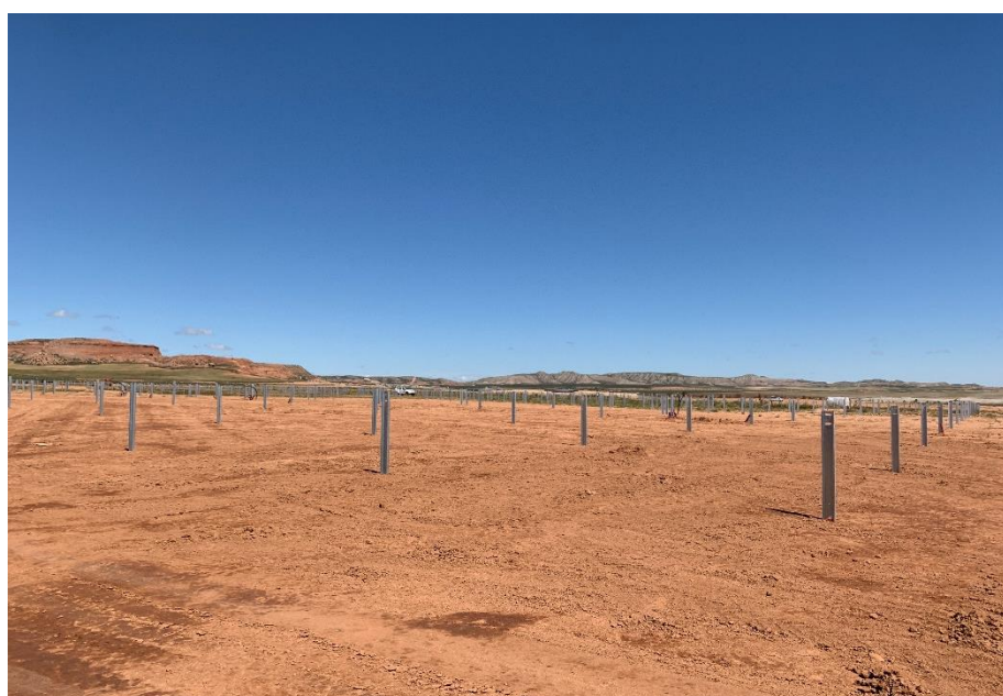
Figura 6 Hincado