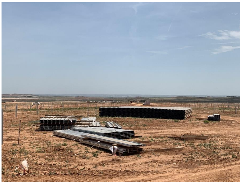
Figura 4 Zona de acopio

En la planta se mantiene un nivel de orden y limpieza óptimo. El acopio logístico de materiales para la fase de construcción se ha realizado de manera correcta en las zonas destinadas para esta labor.