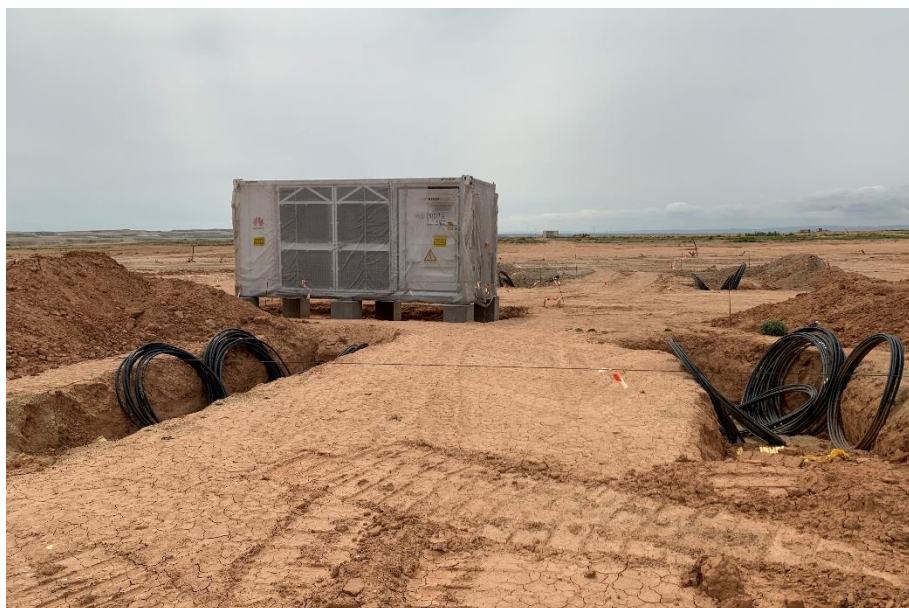
Figura 5 Centro de transformación

El presente anexo se compone de un número representativo de fotografías del total realizado durante el periodo evaluado, escogidas por su relevancia y/o carácter explicativo para la correcta comprensión del presente informe.