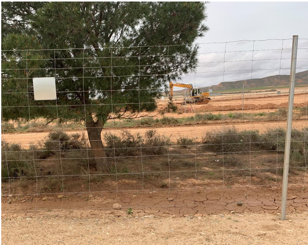
Figura 11 Vallado perimetral de la zona de casetas subsanada