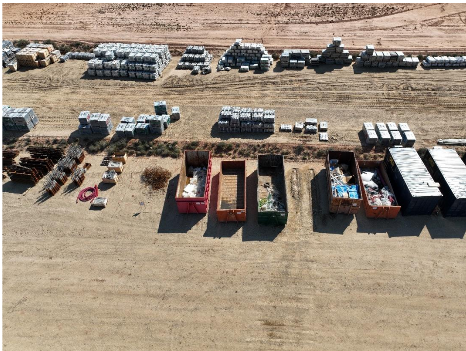
Figura 10 Punto limpio de residuos no peligrosos