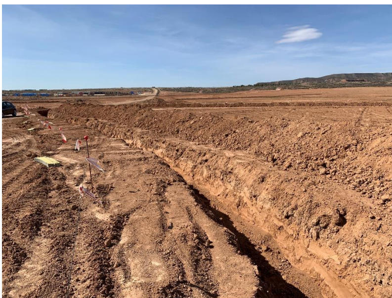
Figura 2 Zanjas para la RMT

Esta actividad se ha desarrollado principalmente con los movimientos de tierras y acondicionamiento del terreno, apertura de viales, zanjas de red de media tensión y desbroces.