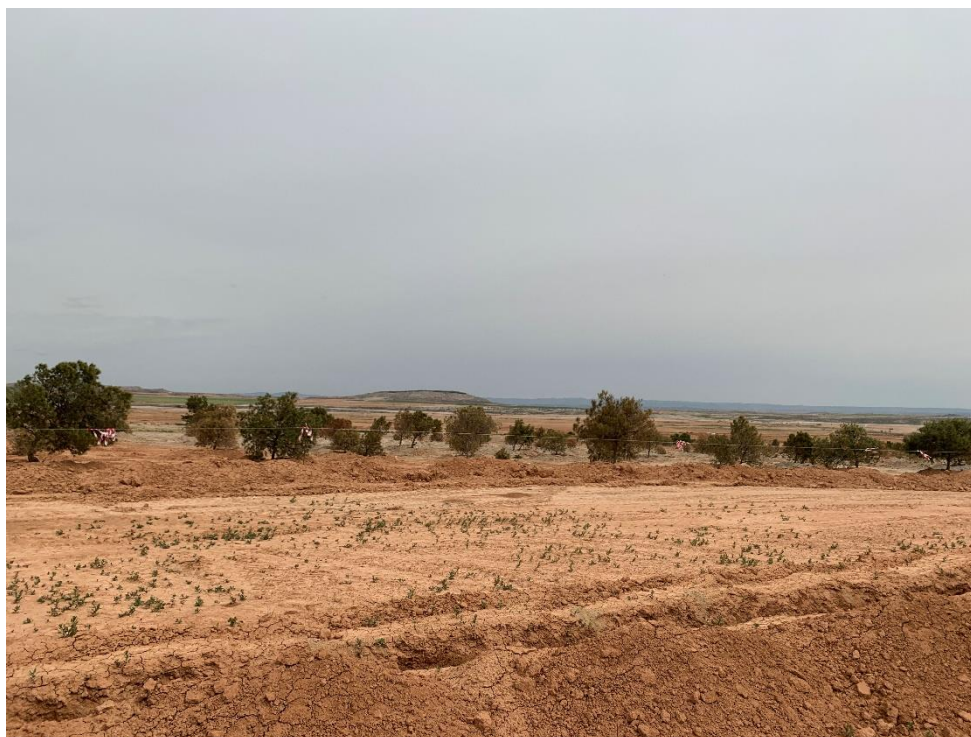
Figura 8 Masa de pinar trasplantada