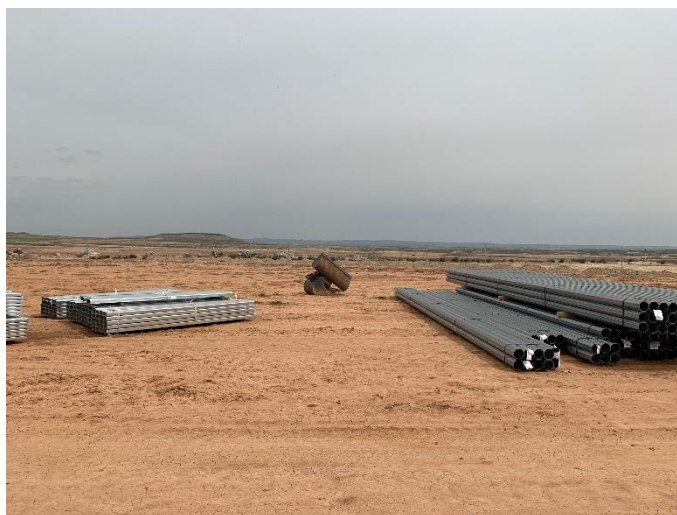
Figura 4 Zona de acopio

En la planta se mantiene un nivel de orden y limpieza óptimo. El acopio logístico de materiales para la fase de construcción se ha realizado de manera correcta en las zonas destinadas para esta labor.