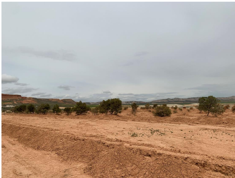
Figura 7 Masa de pinar trasplantada