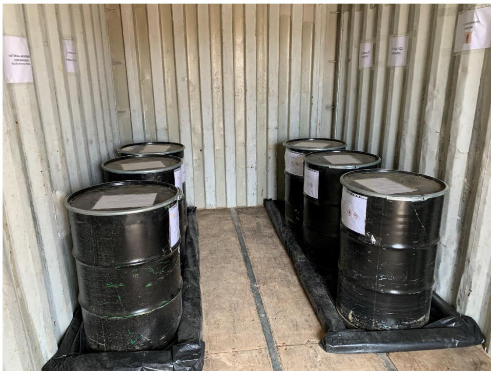
Figura 9 Punto limpio de residuos peligrosos