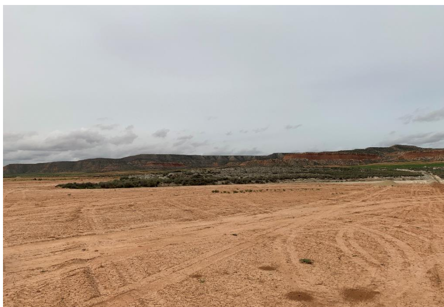
Figura 6 Zona de vegetación natural