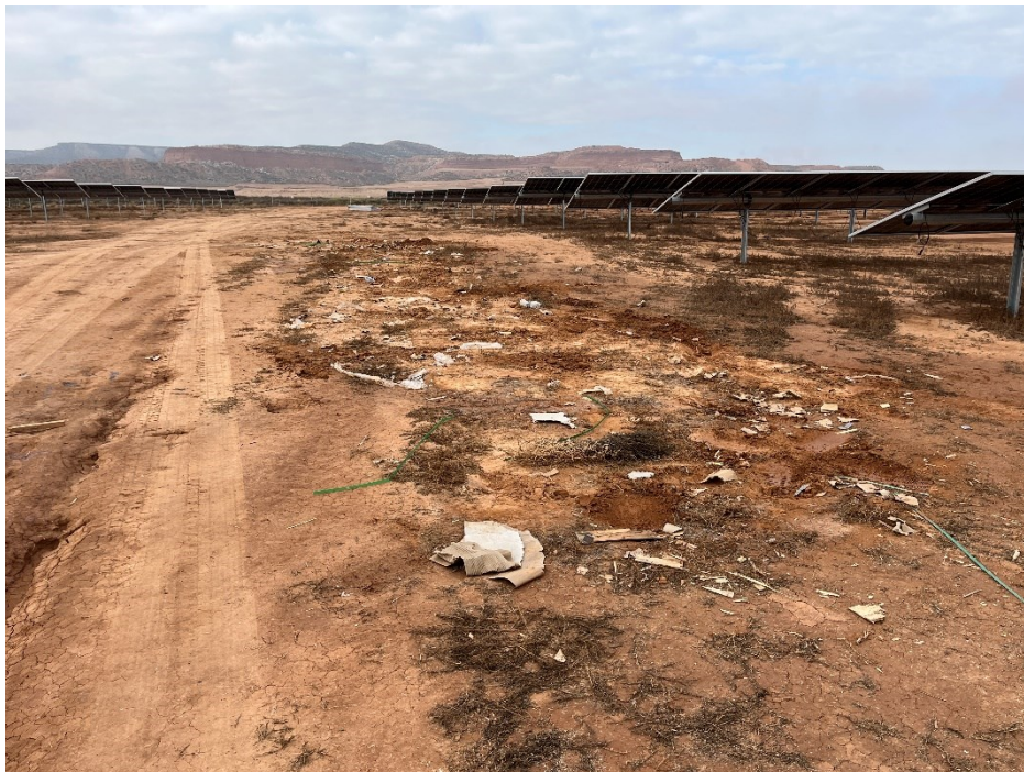
Figura 9 Restos de plásticos