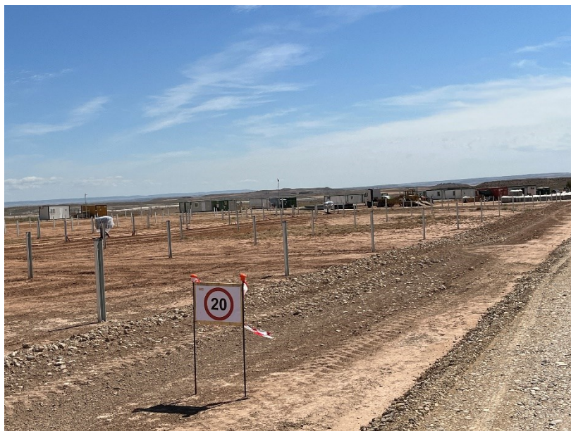
Figura 4 Señalización en obra