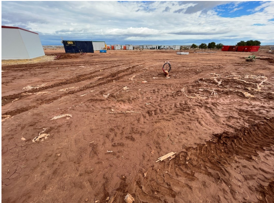
Figura 7 Restos de plásticos