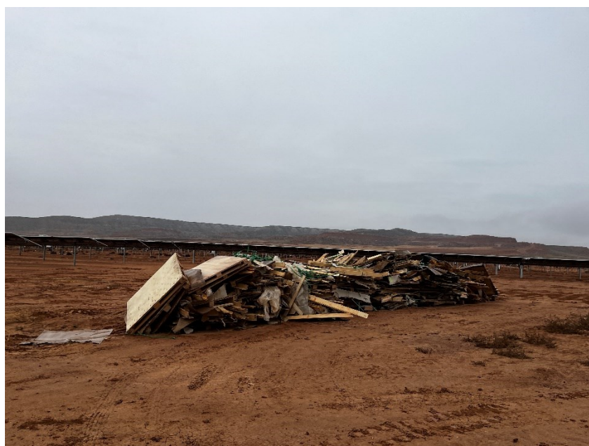
Figura 3 Acopio temporal de residuos no peligrosos

El punto limpio de residuos no peligrosos de la zona de acopio logístico y el dispuesto dentro de la planta consta de cinco contenedores, uno para restos plásticos (bolsa de basura, botellas, tubos corrugados...), cartón, flejes, madera y plástico blando. También hay una zona para los restos de ferralla.