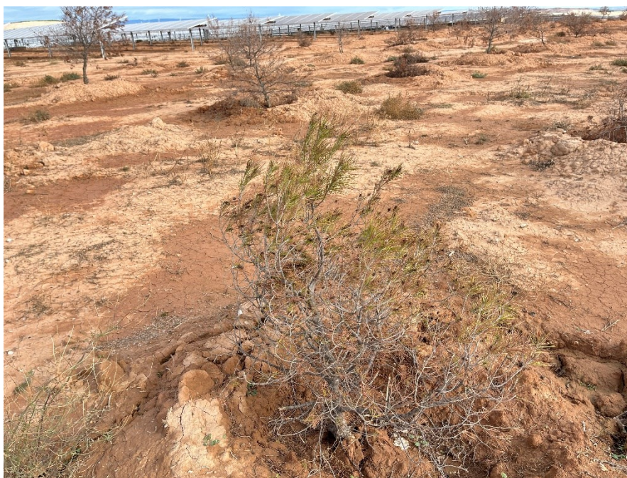
Figura 6 Masa de pinar trasplantada