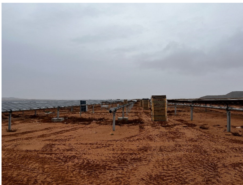
Figura 2 Montaje de los módulos

Durante este mes, se ha continuado con el montaje de los trackers y de los módulos fotovoltaicos (Figura 2).