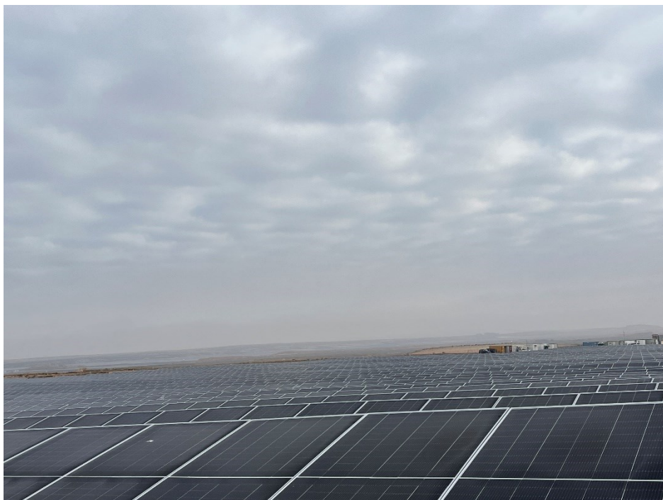
Figura 8 Montaje de los módulos