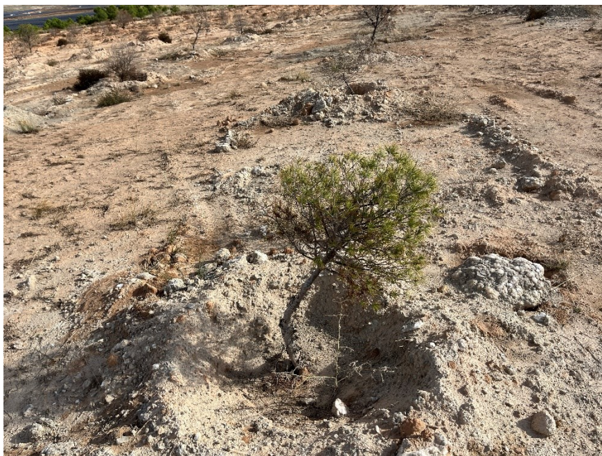
Figura 5 Masa de pinar trasplantada

El presente anexo se compone de un número representativo de fotografías del total realizado durante el periodo evaluado, escogidas por su relevancia y/o carácter explicativo para la correcta comprensión del presente informe.