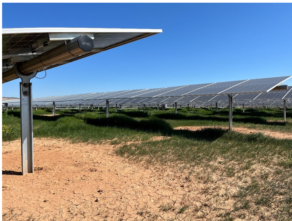
Figura 6 Crecimiento de la vegetación