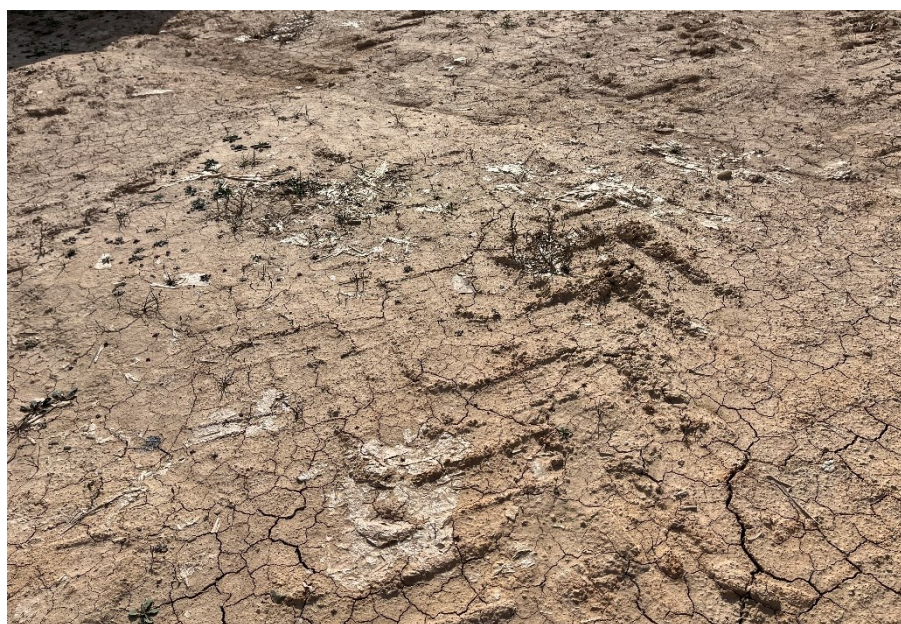
Figura 4 Restos de plásticos