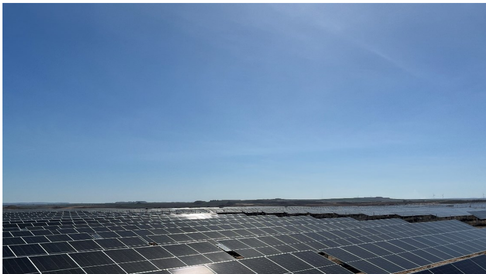
Figura 5 Valdompere 3