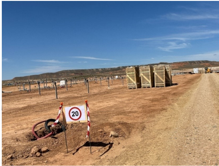
Figura 2 Señalización en obra