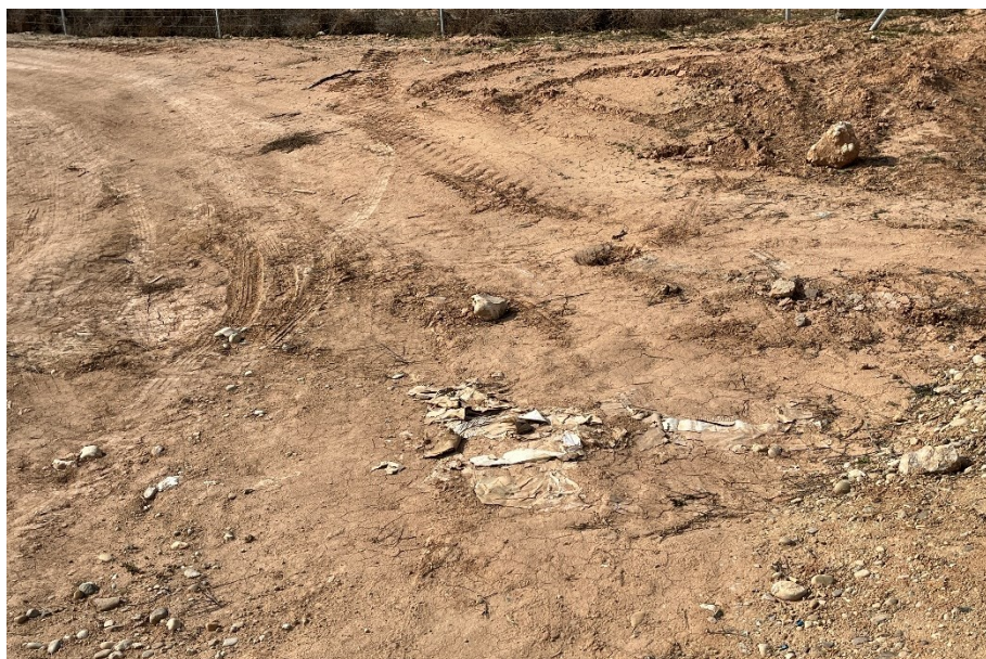
Figura 3 Restos de plásticos

El presente anexo se compone de un número representativo de fotografías del total realizado durante el periodo evaluado, escogidas por su relevancia y/o carácter explicativo para la correcta comprensión del presente informe.