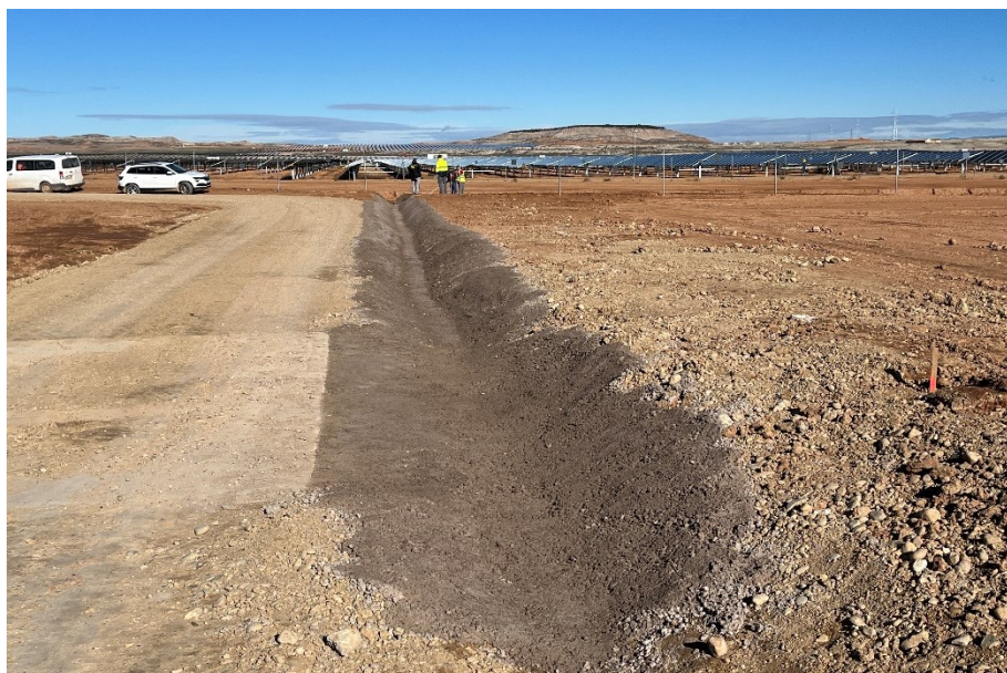
Figura 4 Cimentación de zona potencialmente erosiva

El presente anexo se compone de un número representativo de fotografías del total realizado durante el periodo evaluado, escogidas por su relevancia y/o carácter explicativo para la correcta comprensión del presente informe.