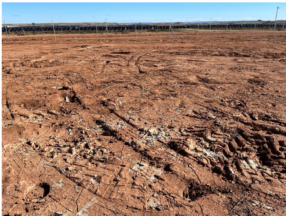
Figura 7 Restos de plásticos