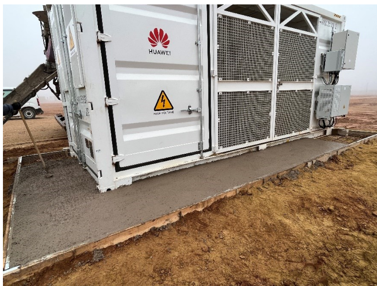
Figura 2 Cimentación de la base de los CT

Se han cimentado diferentes puntos del vial interno con mayor probabilidad erosiva y se ha preparado para cimentar la base de los CT.