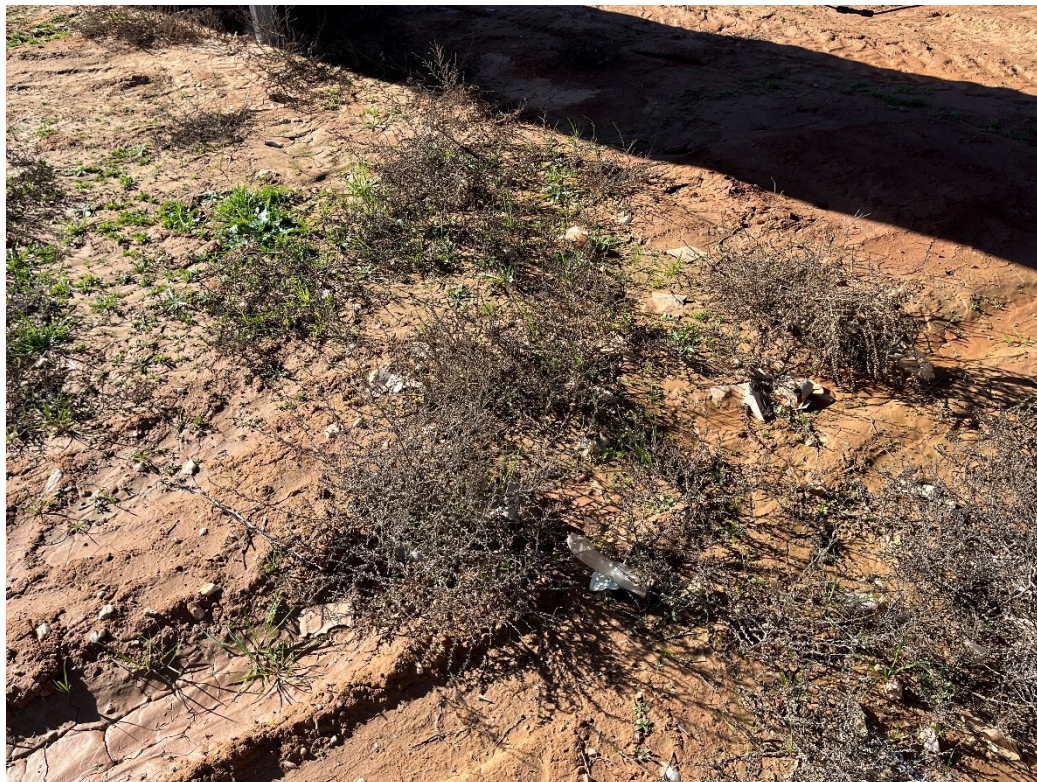
Figura 7 Restos de plásticos