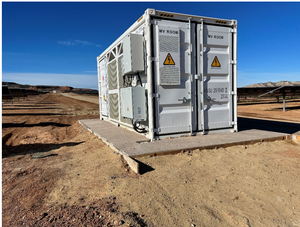
Figura 6 Cimentación de la base de CT