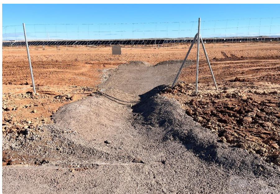
Figura 5 Cimentación de zona potencialmente erosiva