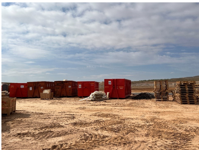
Figura 3 Punto limpio de RNP dispuesto dentro de la planta

El punto limpio de residuos no peligrosos de la zona de acopio logístico y el dispuesto dentro de la planta, consta de cinco contenedores, uno para restos plásticos (bolsa de basura, botellas, tubos corrugados...), cartón, flejes, madera y plástico blando. También hay una zona para los restos de ferralla.