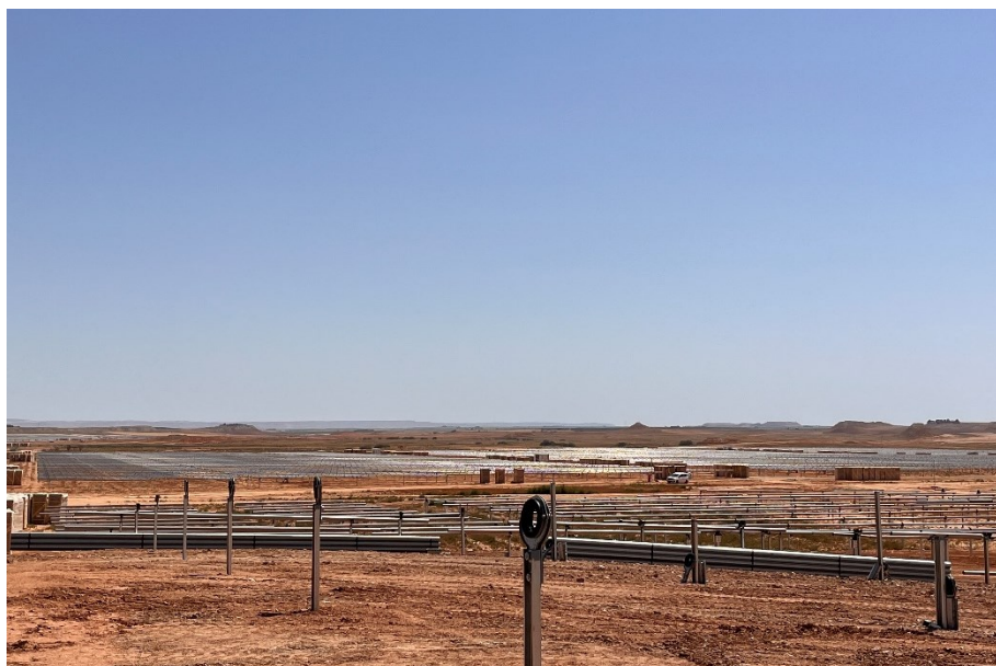
Figura 5 Montaje de los trackers

El presente anexo se compone de un número representativo de fotografías del total realizado durante el periodo evaluado, escogidas por su relevancia y/o carácter explicativo para la correcta comprensión del presente informe.