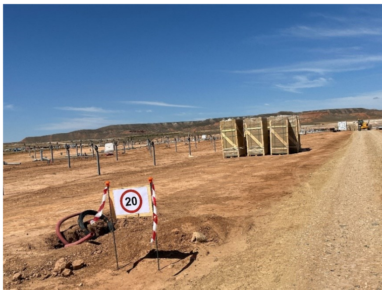
Figura 4 Señalización en obra

La obra dispone de cuba de agua y se realizan riesgos con regularidad. Además, la obra cuenta con un límite de velocidad establecido de 20km/h para reducir de esta forma las emisiones de polvo.