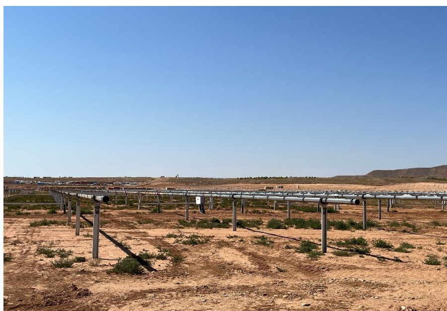
Figura 6 Montaje de los trackers