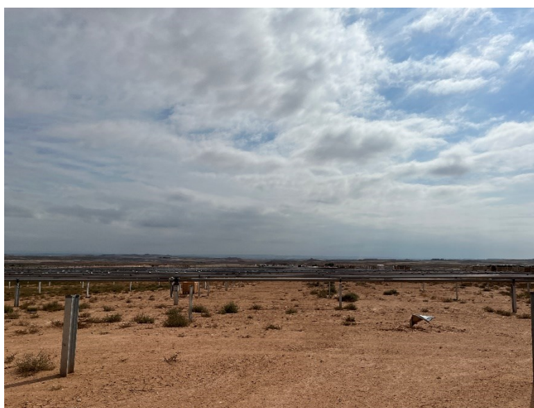
Figura 2 Montaje de los trackers

Durante este mes, continúan con las labores de hincado y con la colocación de los trackers.