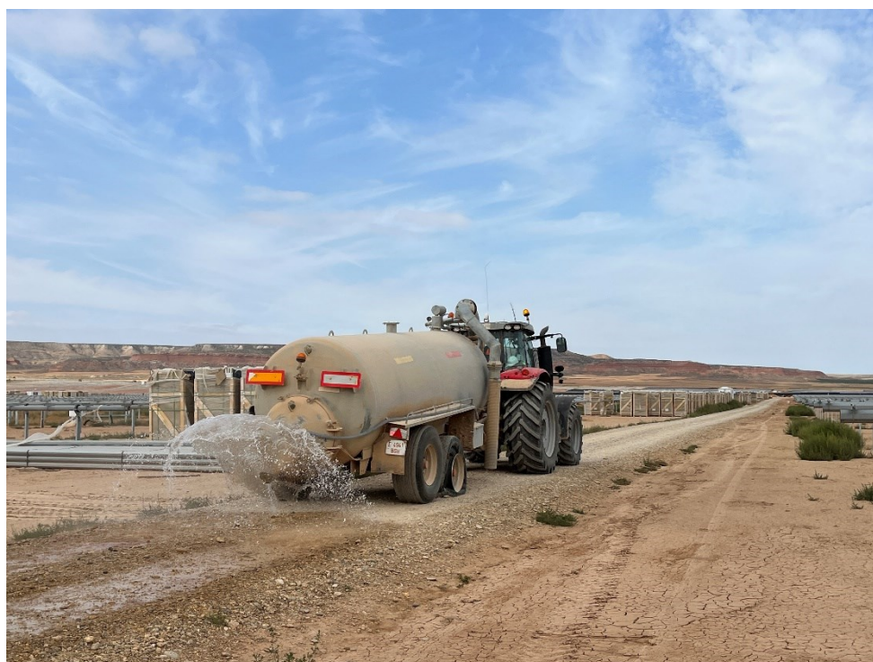
Figura 8 Cuba para la realización de riego de caminos