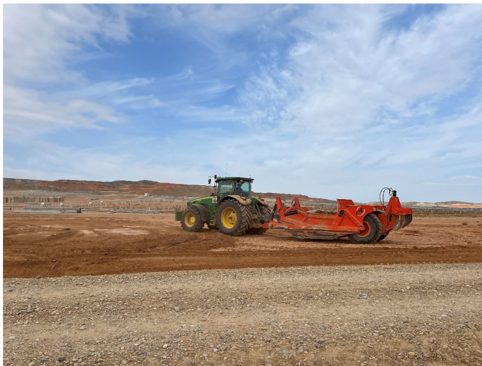
Figura 7 Desbroces del terreno