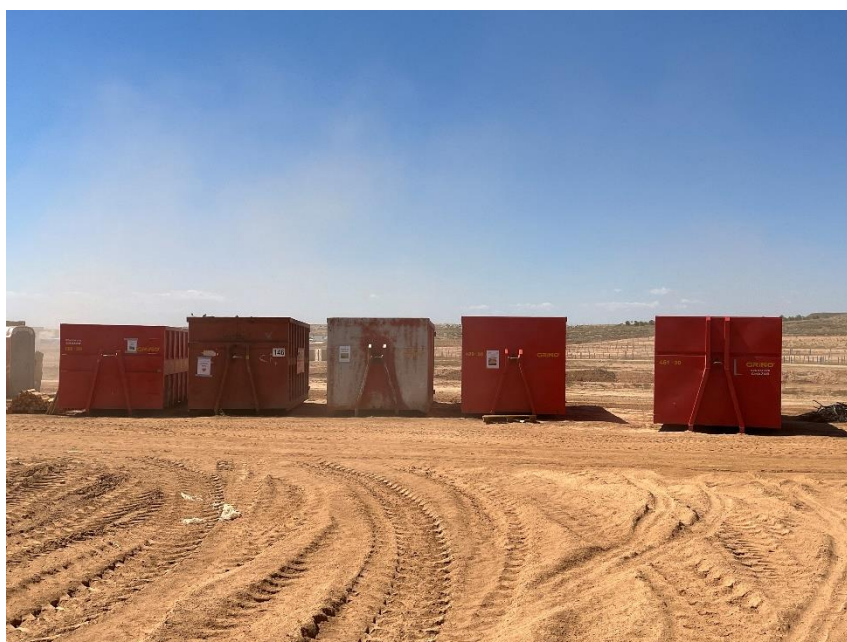
Figura 3 Punto limpio de RNP dispuesto dentro de la planta

El punto limpio de residuos no peligrosos de la zona de acopio logístico y el dispuesto dentro de la planta, consta de cinco contenedores, uno para restos plásticos (bolsa de basura, botellas, tubos corrugados...), cartón, flejes, madera y plástico blando. También hay una zona para los restos de ferralla.