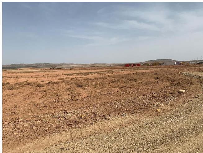
Figura 4 Esparcido de la tierra vegetal

Los acopios de tierra vegetal procedentes de los desbroces, fue segregada a principios de este mes.