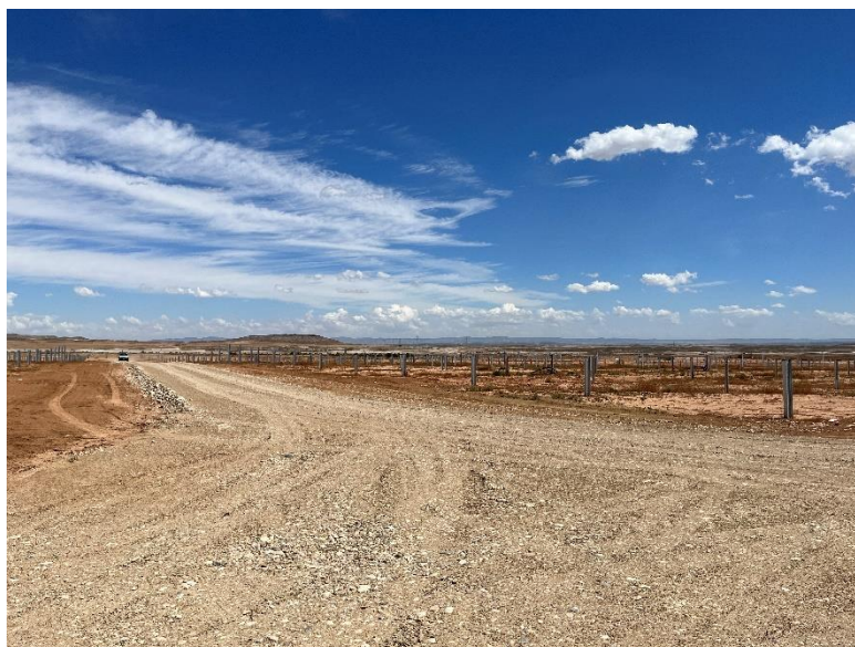
Figura 2 Viales de la planta

Durante este mes se han finalizado las labores de movimientos de tierras, apertura de zanjas de la red de media y baja tensión y de las cimentaciones de los CT's, y continúan con la apertura de viales.