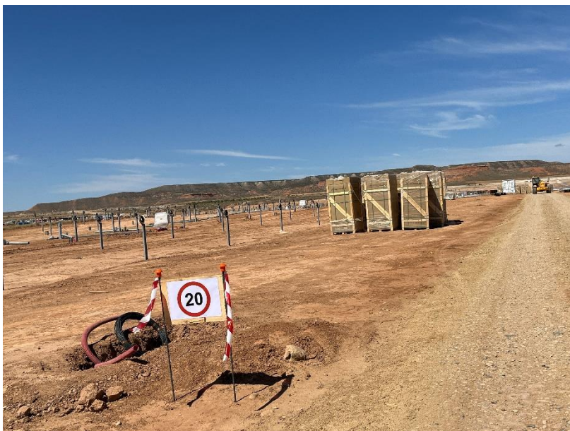
Figura 5 Señalización en obra