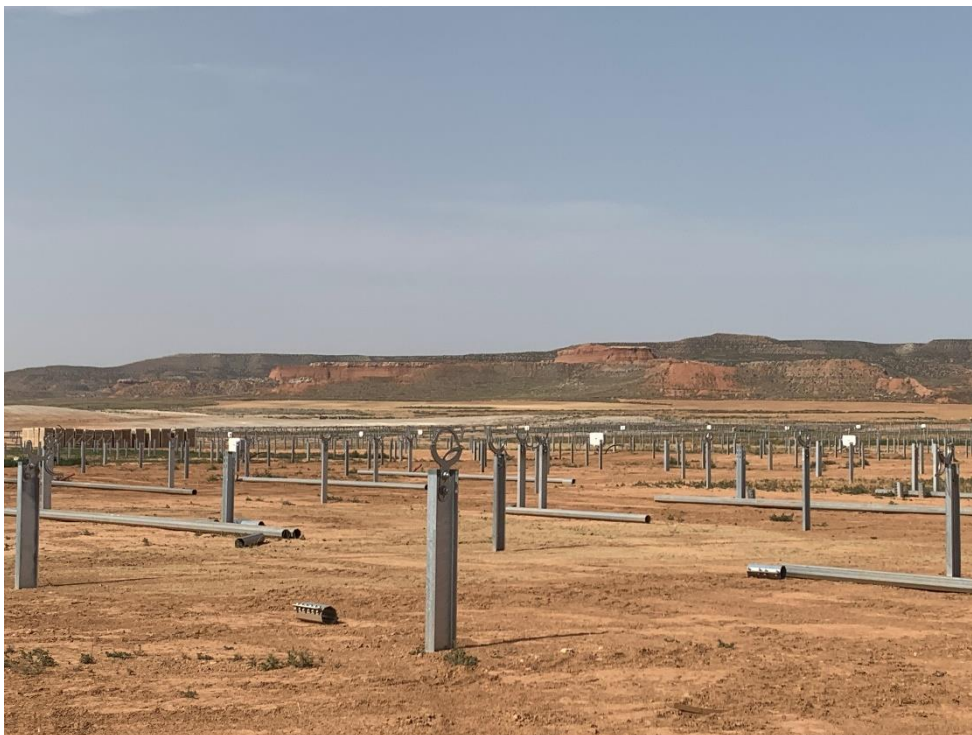
Figura 9 Hincado