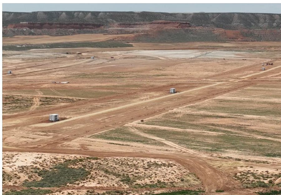
Figura 7 Vista aérea de la planta