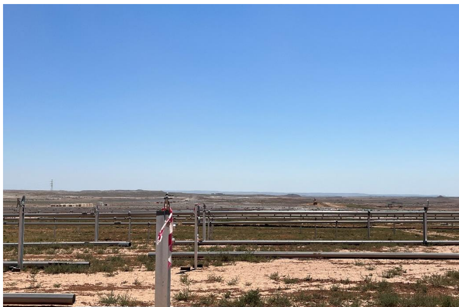
Figura 6 Montaje de la estructura

El presente anexo se compone de un número representativo de fotografías del total realizado durante el periodo evaluado, escogidas por su relevancia y/o carácter explicativo para la correcta comprensión del presente informe.