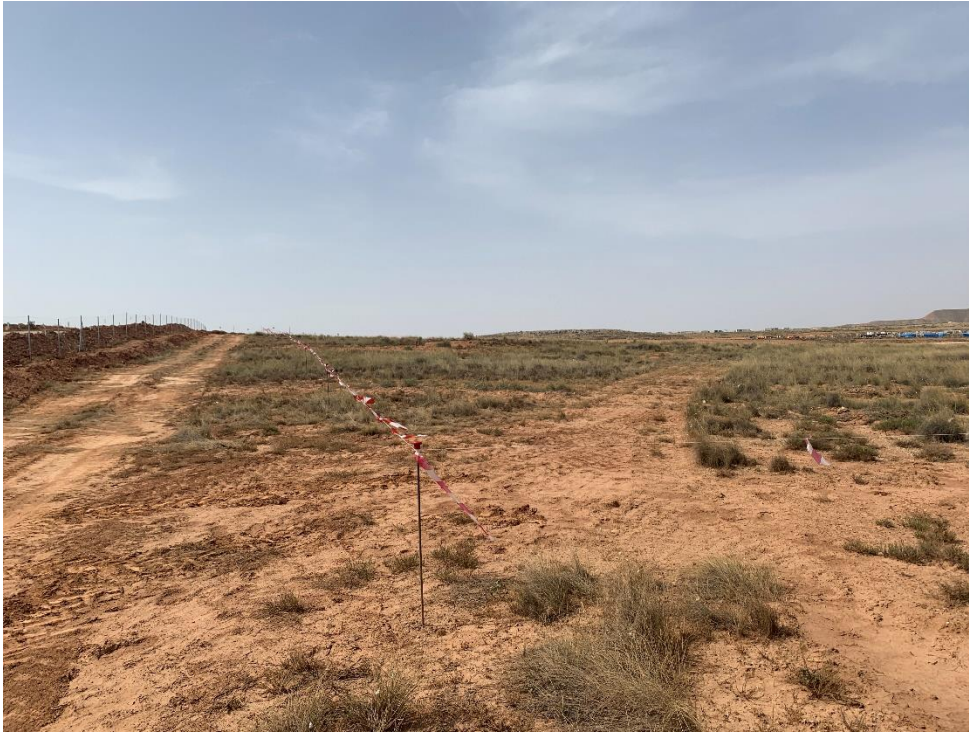
Figura 8 Balizado de zona de vegetación natural