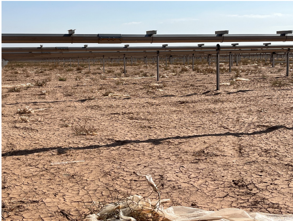
Figura 7 Restos de plásticos