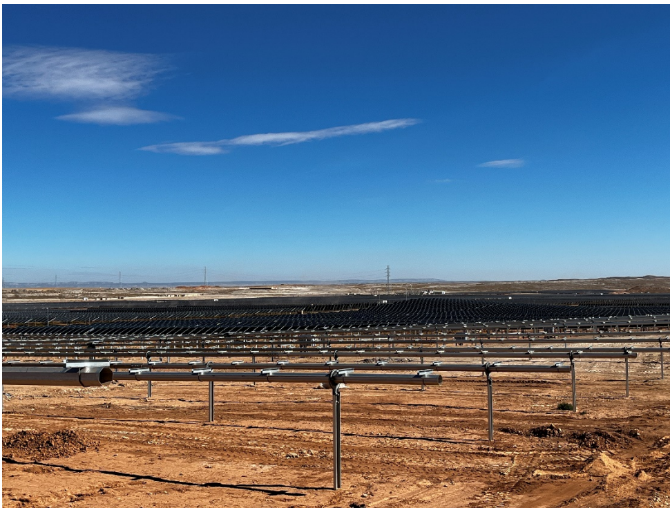
Figura 8 Montaje de los módulos