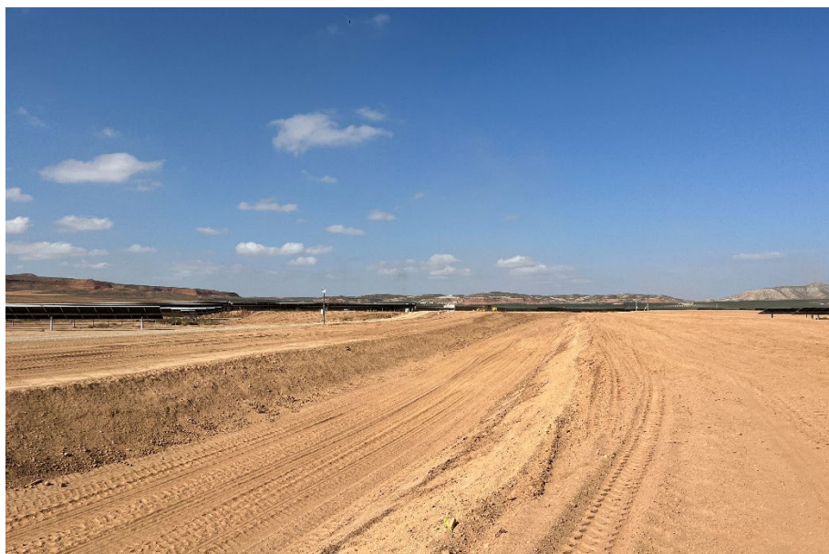
Figura 5 Red de drenaje

El presente anexo se compone de un número representativo de fotografías del total realizado durante el periodo evaluado, escogidas por su relevancia y/o carácter explicativo para la correcta comprensión del presente informe.