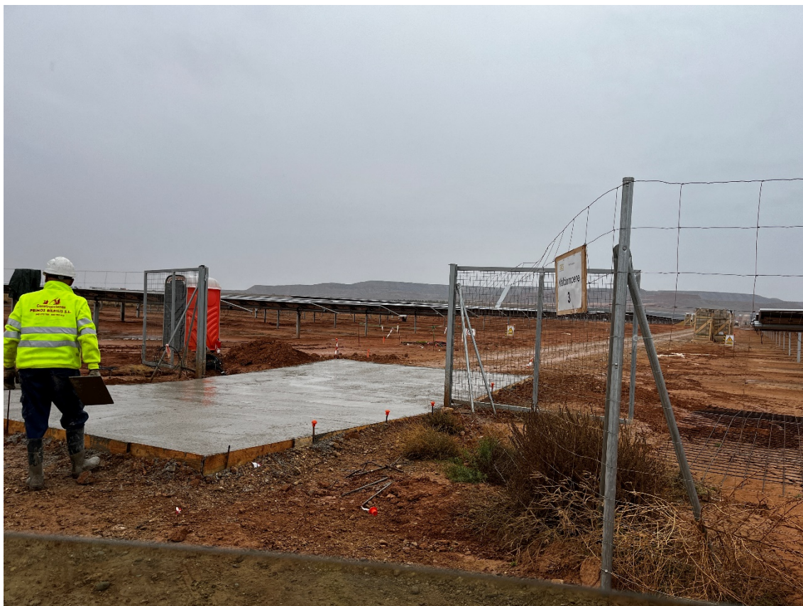
Figura 9 Cimentación del vial interno