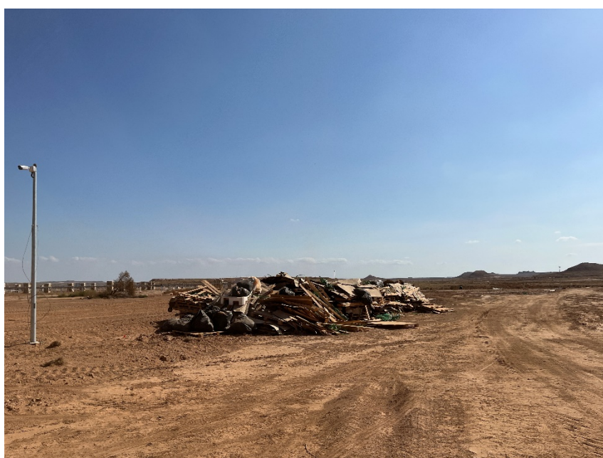
Figura 3 Acopio temporal de residuos

El punto limpio de residuos no peligrosos de la zona de acopio logístico y el dispuesto dentro de la planta, consta de cinco contenedores, uno para restos plásticos (bolsa de basura, botellas, tubos corrugados...), cartón, flejes, madera y plástico blando. También hay una zona para los restos de ferralla.