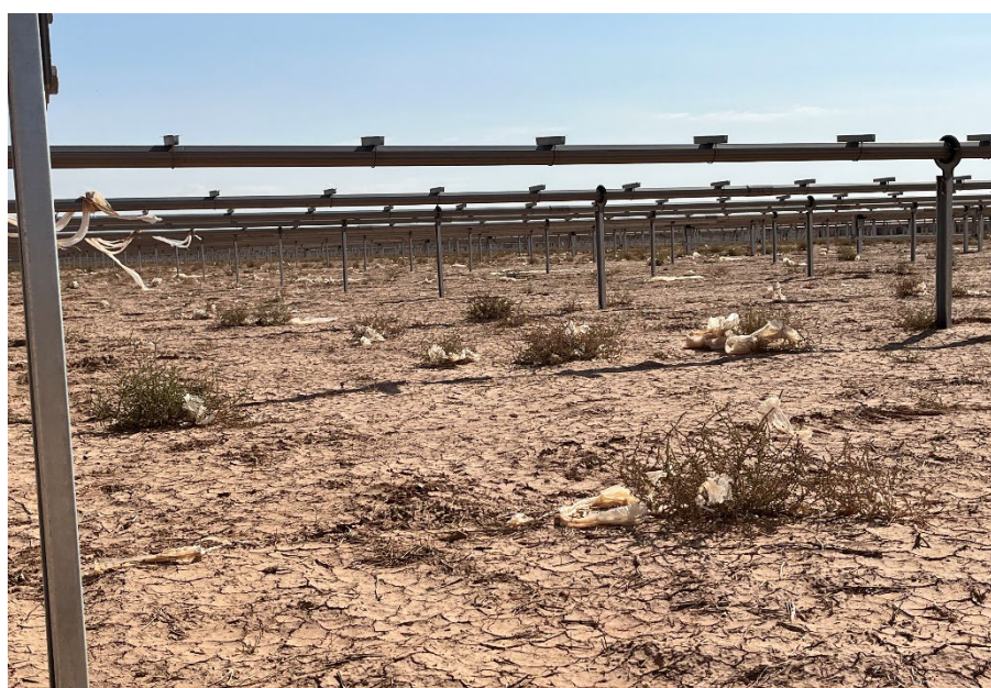
Figura 6 Restos de plásticos