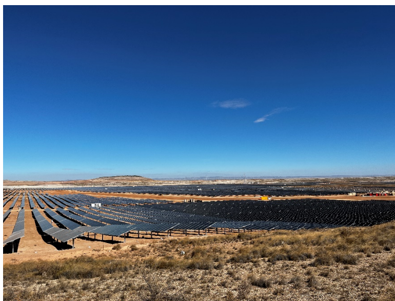
Figura 2 Montaje de los módulos fotovoltaicos

Se ha continuado con el montaje de los módulos fotovoltaicos.