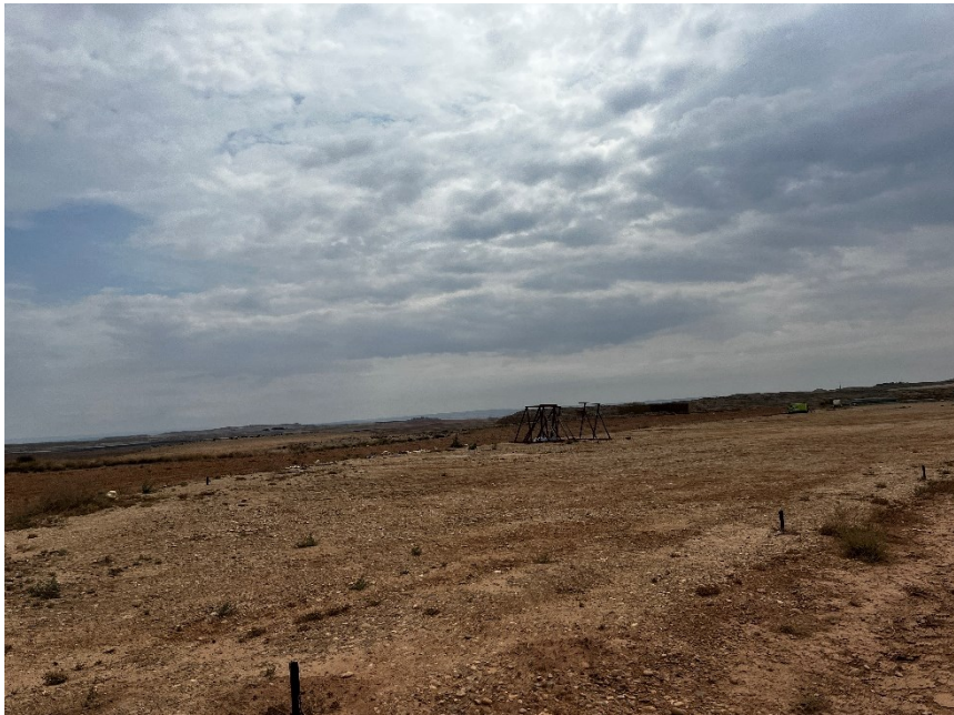
Figura 5 Desmantelamiento de la zona de casetas