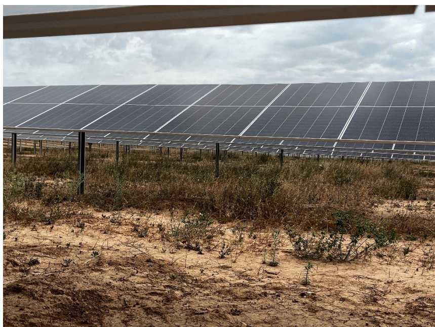
Figura 4 Estado de la vegetación bajo los módulos