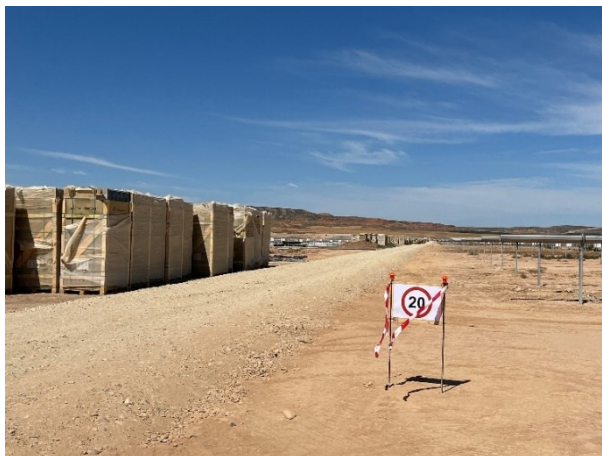
Figura 2 Señalización en obra

La obra dispone de cuba de agua y se realizan riesgos con regularidad. Además, la obra cuenta con un límite de velocidad establecido de 20km/h para reducir de esta forma las emisiones de polvo.