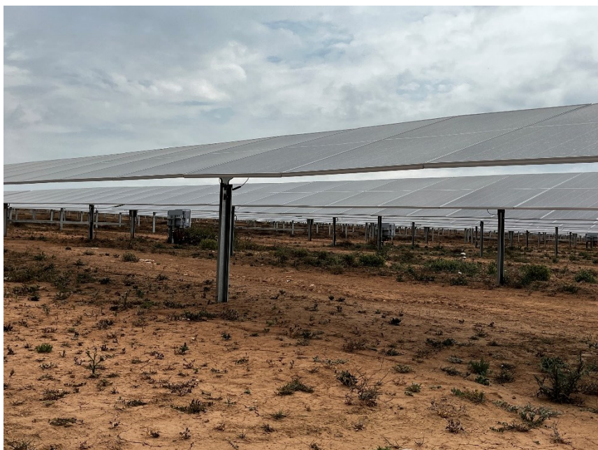
Figura 3 Crecimiento de la vegetación bajo los módulos

El presente anexo se compone de un número representativo de fotografías del total realizado durante el periodo evaluado, escogidas por su relevancia y/o carácter explicativo para la correcta comprensión del presente informe.