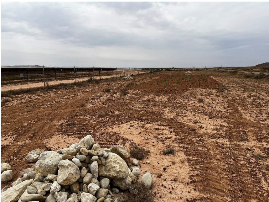
Figura 6 Majanos y bosquetes