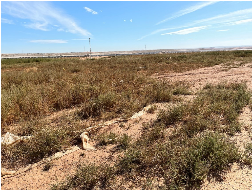
Figura 12 Restos de plásticos