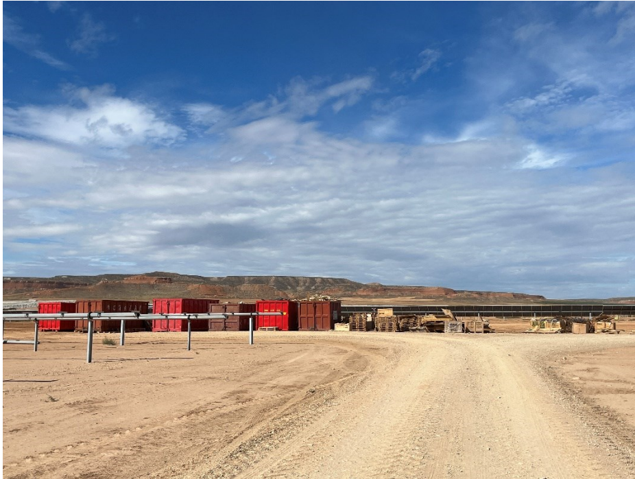
Figura 4 Punto limpio de RNP dispuesto dentro de la planta

Así como, el punto limpio de residuos peligrosos consta de seis bidones dispuestos dentro de un contenedor marítimo impermeabilizado. En cada uno se diferencian gases en recipientes a presión, plásticos contaminados, metales contaminados, material absorbente contaminado (bolsas de basura, trapos...), tierras contaminadas (tierras con sepiolita) y aceites de motor hidráulico.