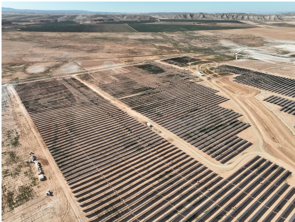
Figura 10 Montaje de los módulos fotovoltaicos