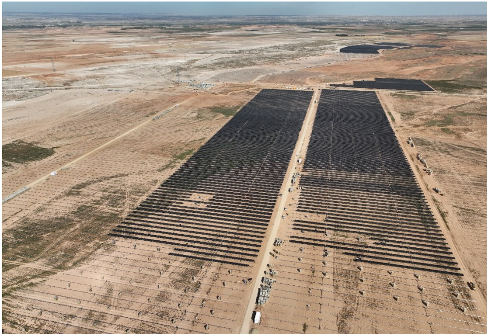
Figura 9 Montaje módulos fotovoltaicos