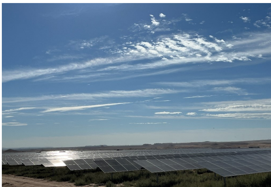
Figura 8 Crecimiento de la vegetación bajo los paneles.