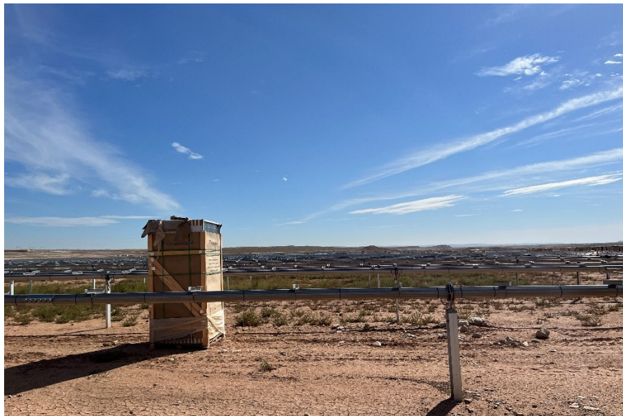
Figura 7 Montaje de los trackers

El presente anexo se compone de un número representativo de fotografías del total realizado durante el periodo evaluado, escogidas por su relevancia y/o carácter explicativo para la correcta comprensión del presente informe.