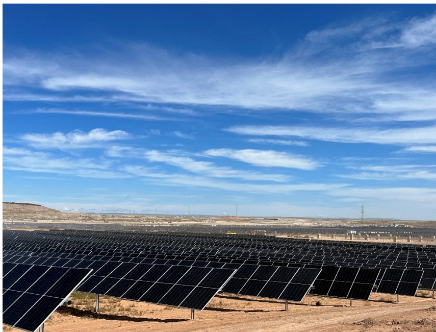
Figura 3 Montaje de los módulos fotovoltaicos

Durante este mes, continúan con la colocación de los trackers y de los módulos fotovoltaicos.