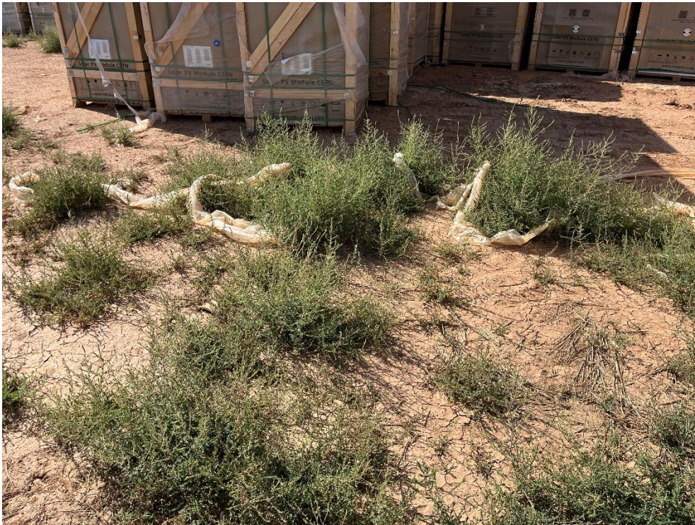
Figura 11 Restos de plásticos