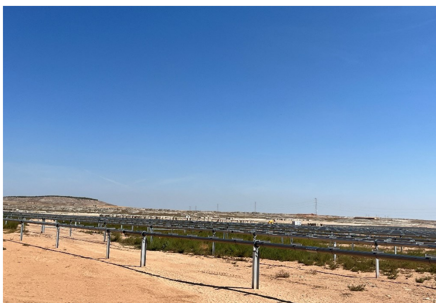
Figura 8 Montaje de los trackers