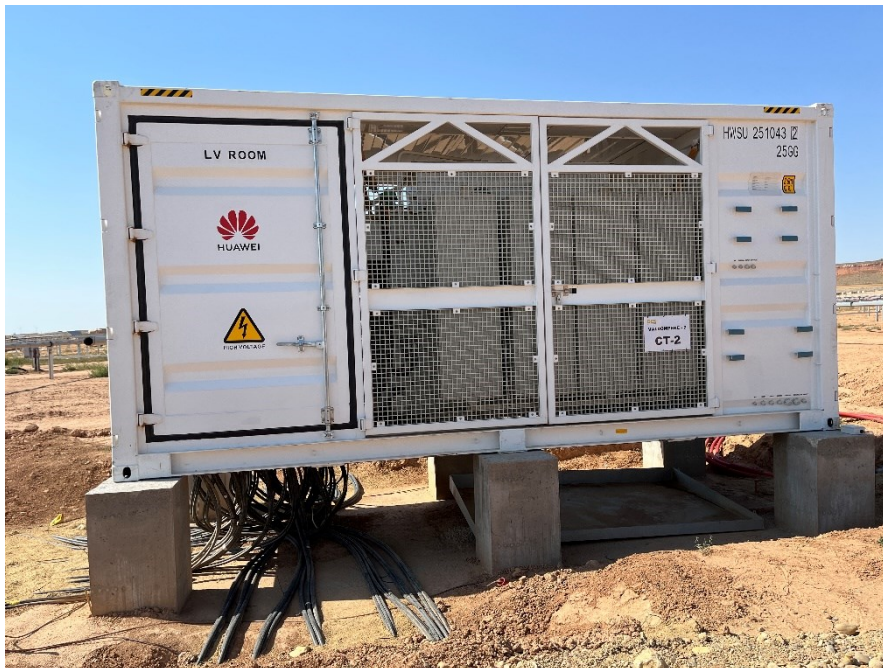
Figura 2 Cableado de los CT

Durante este mes, se ha continuado con el tendido de la red de media y baja tensión, con la conexión de los centros de transformación. Se ha finalizado con la conexión de los inversores.