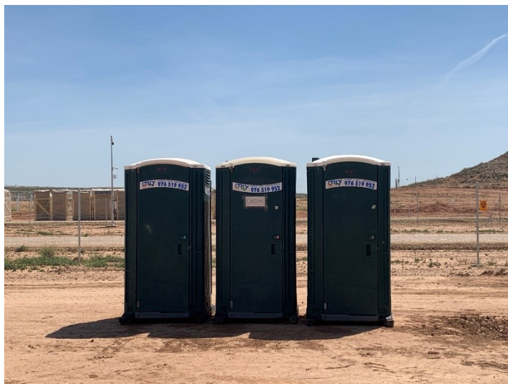
Figura 5 Baños químicos