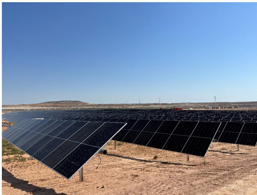
Figura 3 Montaje de los módulos fotovoltaicos

Durante este mes se ha finalizado el hincado, continúan con la colocación de los trackers y de los módulos fotovoltaicos.