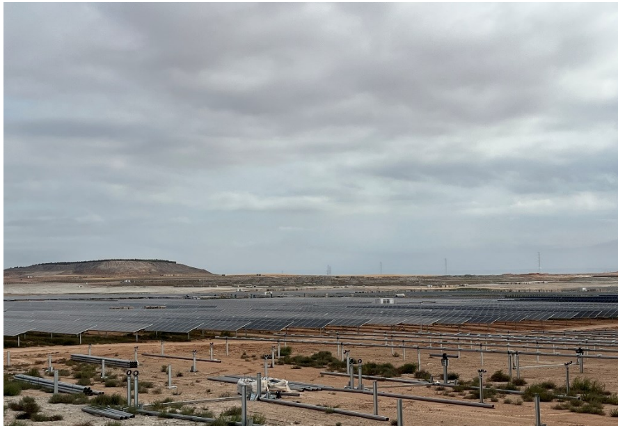
Figura 9 Montaje módulos fotovoltaicos