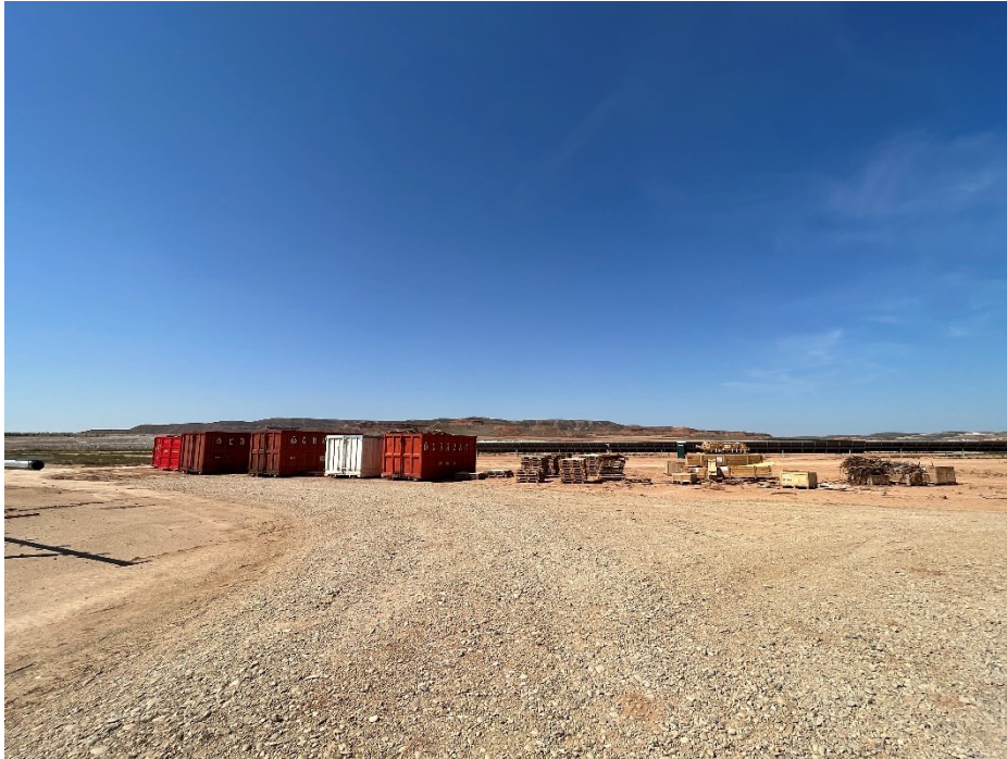
Figura 4 Punto limpio de RNP dispuesto dentro de la planta

Así como, el punto limpio de residuos peligrosos consta de seis bidones dispuestos dentro de un contenedor marítimo impermeabilizado. En cada uno se diferencian gases en recipientes a presión, plásticos contaminados, metales contaminados, material absorbente contaminado (bolsas de basura, trapos...), tierras contaminadas (tierras con sepiolita) y aceites de motor hidráulico.