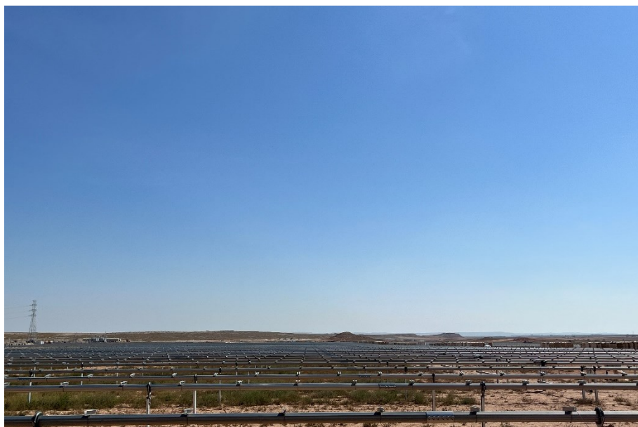
Figura 7 Montaje de los trackers

El presente anexo se compone de un número representativo de fotografías del total realizado durante el periodo evaluado, escogidas por su relevancia y/o carácter explicativo para la correcta comprensión del presente informe.