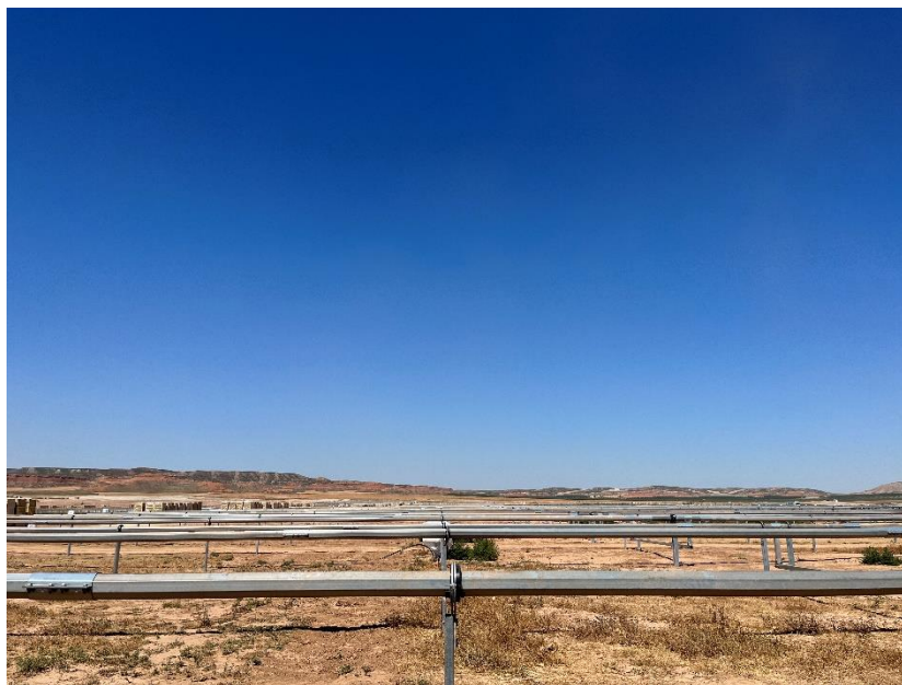
Figura 3 Montaje de los trackers

Durante este mes se ha finalizado el hincado, y se ha comenzado con el montaje de los trackers.