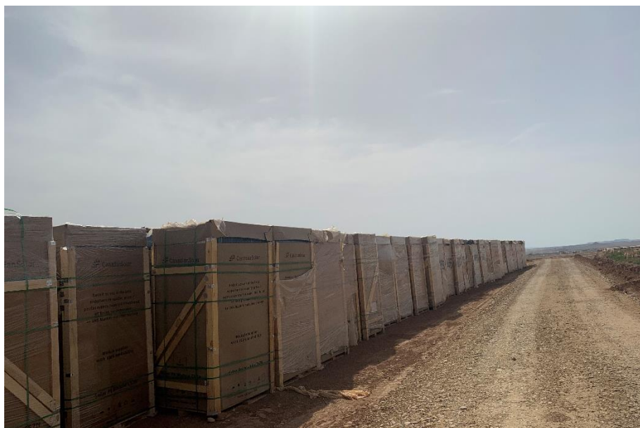
Figura 8 Acopio de módulos fotovoltaicos

El presente anexo se compone de un número representativo de fotografías del total realizado durante el periodo evaluado, escogidas por su relevancia y/o carácter explicativo para la correcta comprensión del presente informe.