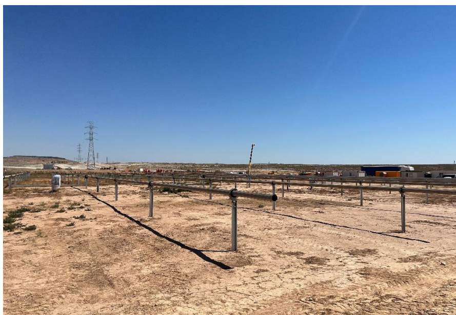
Figura 9 Montaje de la estructura