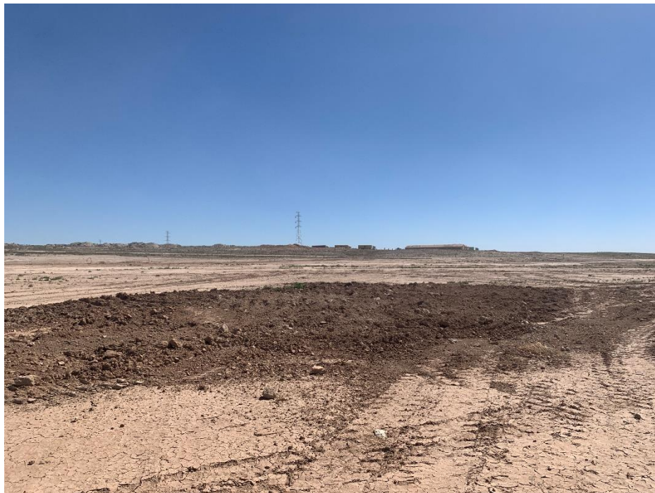
Figura 5 Esparcido de la tierra vegetal