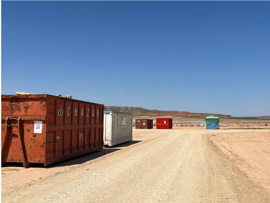
Figura 4 Punto limpio de RNP dispuesto dentro de la planta

Así como, el punto limpio de residuos peligrosos consta de seis bidones dispuestos dentro de un contenedor marítimo impermeabilizado. En cada uno se diferencian gases en recipientes a presión, plásticos contaminados, metales contaminados, material absorbente contaminado (bolsas de basura, trapos...), tierras contaminadas (tierras con sepiolita) y aceites de motor hidráulico.