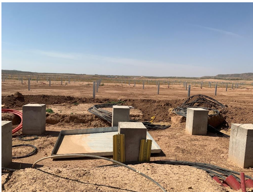
Figura 2 Cableado de los CT

Durante este mes, se ha continuado con el tendido de la red de media y baja tensión, y se ha comenzado a conectar los inversores y los centros de transformación.