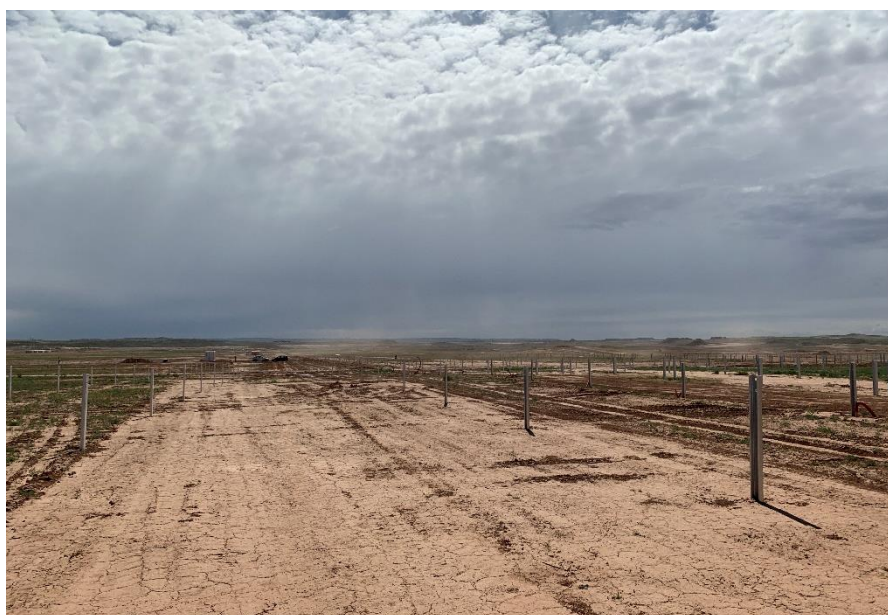
Figura 9 Hincado