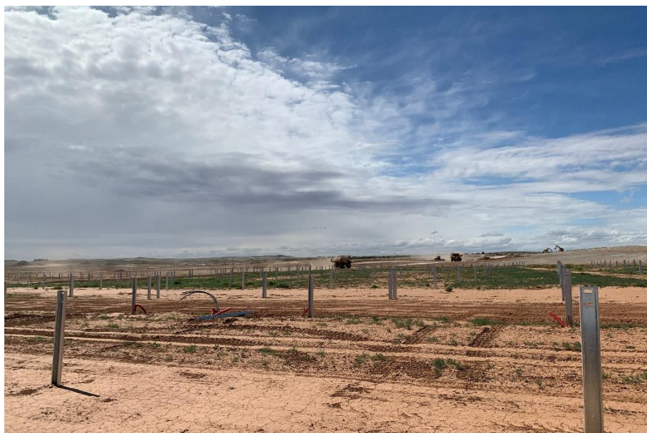
Figura 8 Hincado

El presente anexo se compone de un número representativo de fotografías del total realizado durante el periodo evaluado, escogidas por su relevancia y/o carácter explicativo para la correcta comprensión del presente informe.