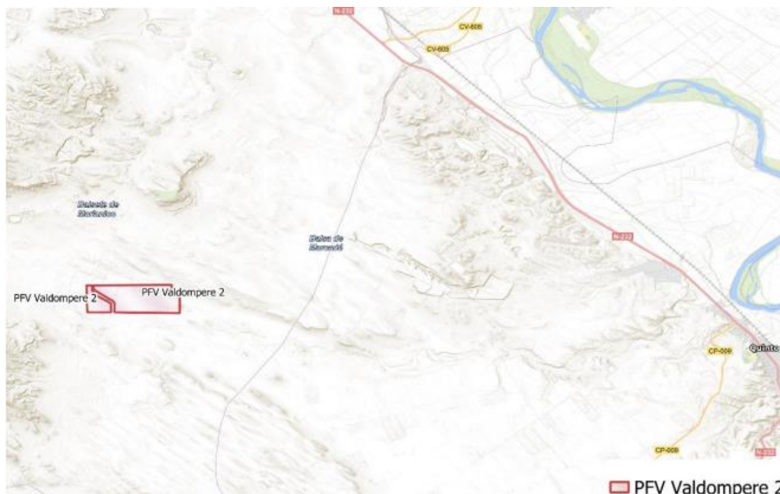
Figura 1 Localización del proyecto