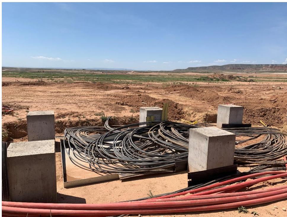
Figura 3 Cableado de la RMT

Durante este mes, se ha continuado con la red inferior de tierras, tendido de cable de media y baja tensión.