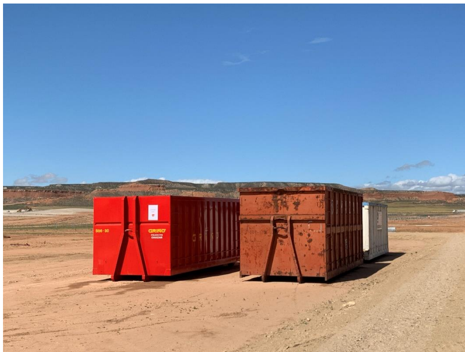
Figura 7 Punto limpio de RNP

En la planta se mantiene un nivel de orden y limpieza óptimo. El acopio logístico de materiales para la fase de construcción se ha realizado de manera correcta en las zonas destinadas para esta labor. También se ha dispuesto un punto limpio de RNP (Figura 6).