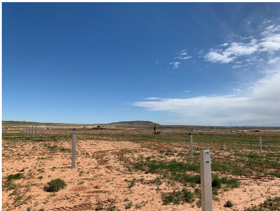
Figura 4 Labores de hincado