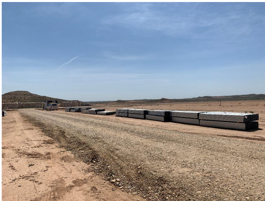
Figura 2 Vial de entrada

Durante este mes se ha finalizado con la apertura de zanjas de la red de media y baja tensión, y se ha continuado con la apertura de viales y la cimentación de los CT's