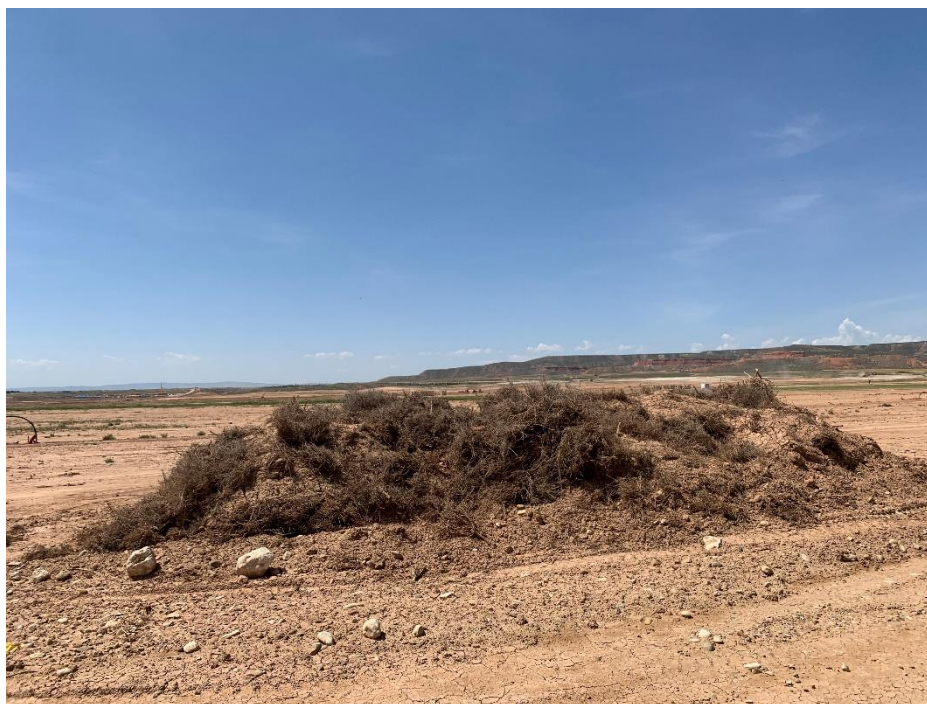
Figura 5 Acopio de tierra vegetal

Se ha comprobado y evaluado que se ha llevado a cabo la separación de tierra vegetal y estériles de forma correcta, acopiándolo en diferentes ubicaciones.