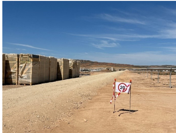
Figura 3 Señalización en obra

La obra dispone de cuba de agua y se realizan riegos con regularidad. Además, la obra cuenta con un límite de velocidad establecido de 20km/h para reducir de esta forma las emisiones de polvo.