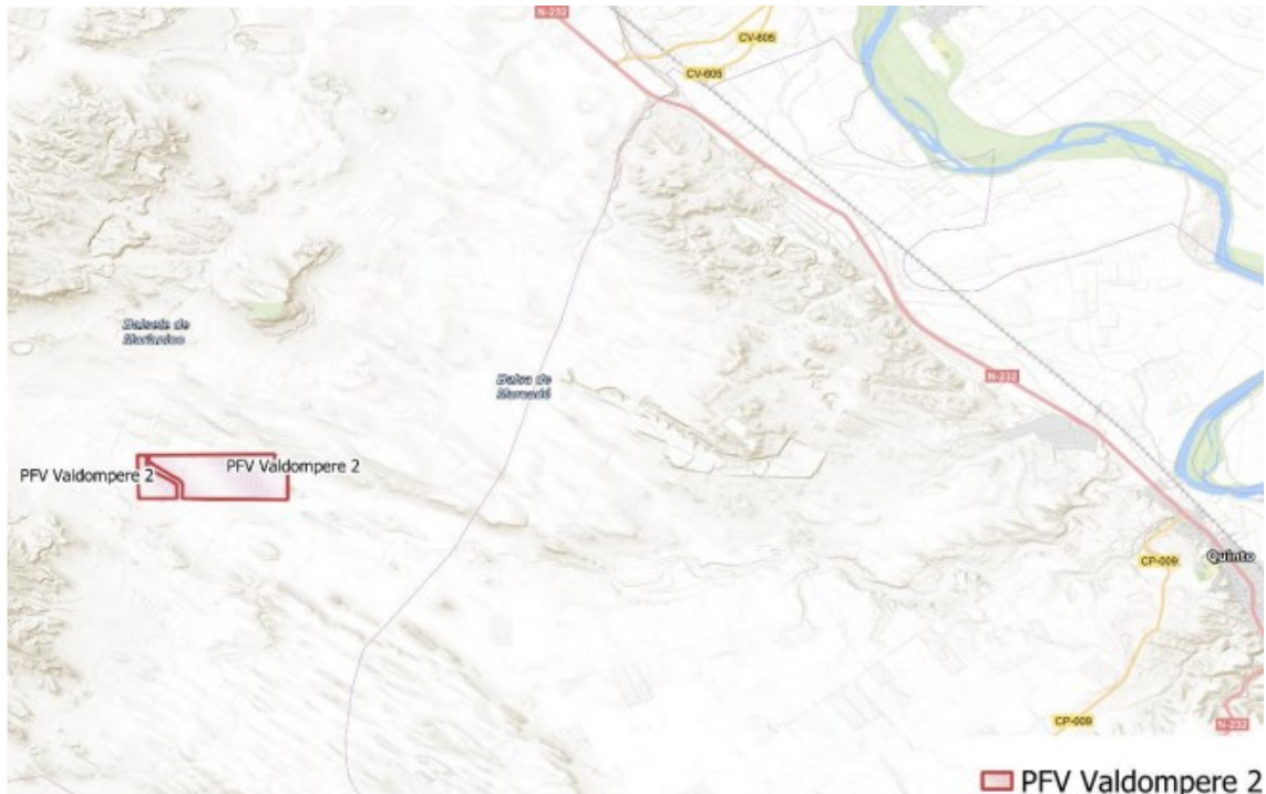
Figura 1 Localización del proyecto