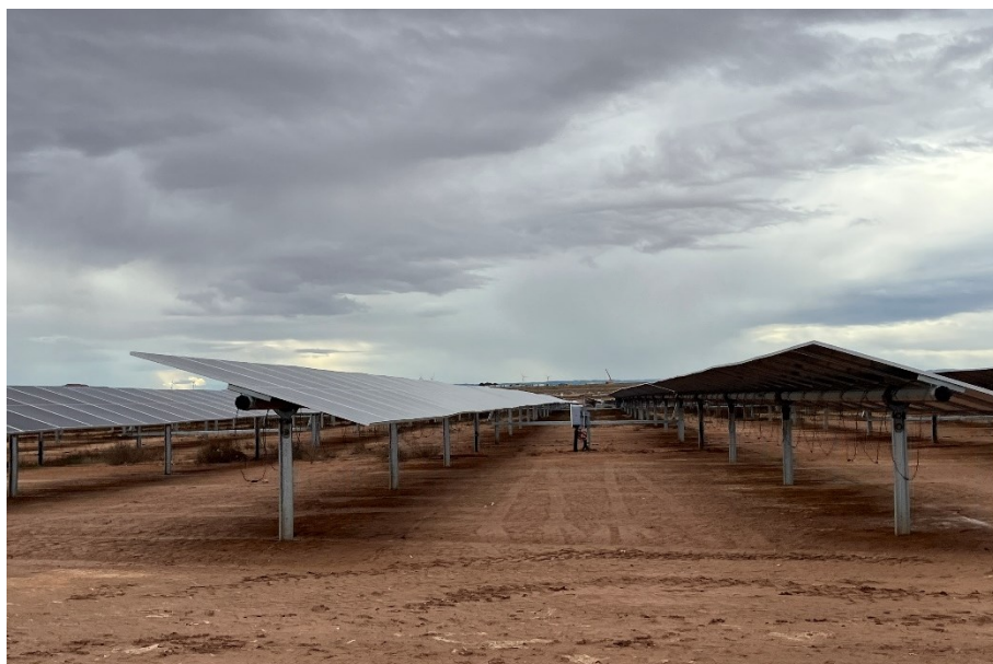
Figura 4 Valdompere 2

El presente anexo se compone de un número representativo de fotografías del total realizado durante el periodo evaluado, escogidas por su relevancia y/o carácter explicativo para la correcta comprensión del presente informe.