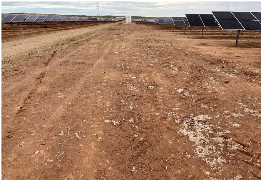
Figura 7 Punto localizado de restos de plásticos (Antigua zona de acopio)