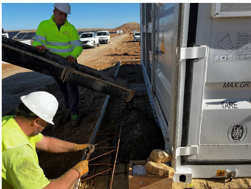
Figura 2 Cimentación de la base del CT

Se ha llevado a cabo la cimentación de la base de los CT.