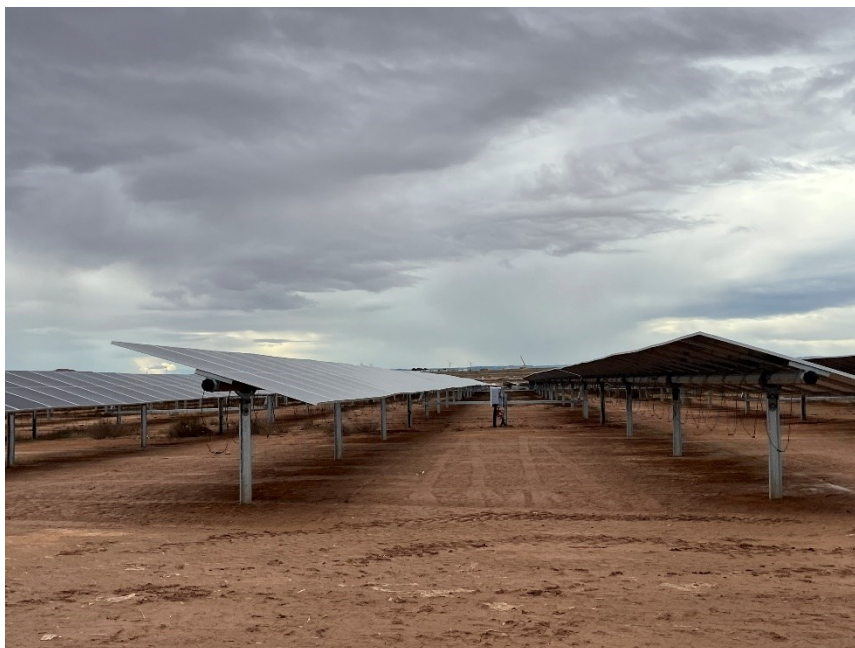
Figura 3 Montaje de los módulos fotovoltaicos