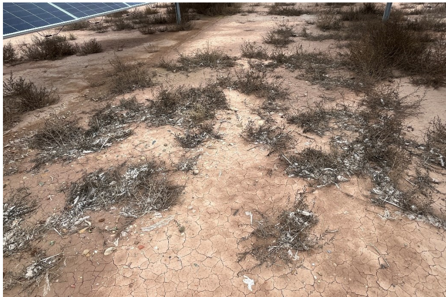
Figura 6 Punto localizado de restos de plásticos (Vegetación)

El presente anexo se compone de un número representativo de fotografías del total realizado durante el periodo evaluado, escogidas por su relevancia y/o carácter explicativo para la correcta comprensión del presente informe.