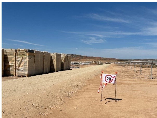
Figura 5 Señalización en obra

La obra dispone de cuba de agua y se realizan riesgos con regularidad. Además, la obra cuenta con un límite de velocidad establecido de 20km/h para reducir de esta forma las emisiones de polvo.