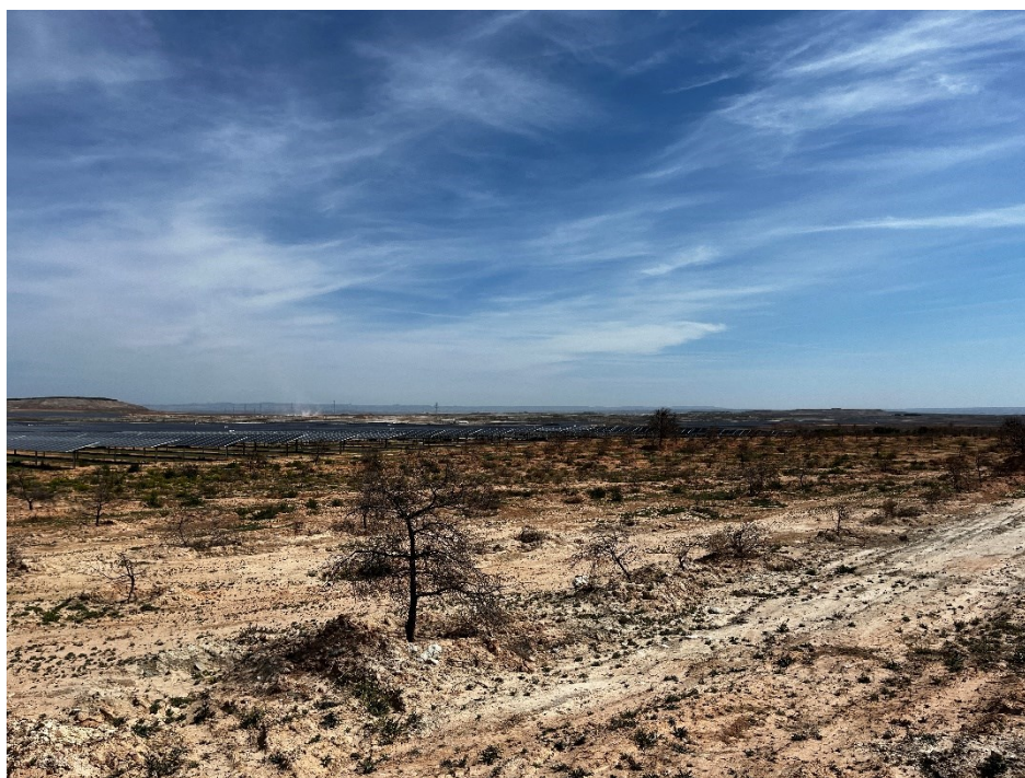
Figura 2 Masa de pinar trasplantada

Se ha continuado con el seguimiento de la evolución de la masa de pinar trasplantada durante los meses de Marzo y Abril, siendo esta muy negativa, con un índice de supervivencia del 0%.