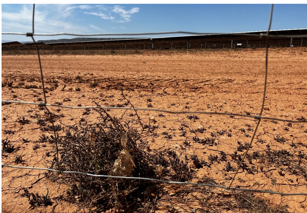
Figura 6 Restos de plásticos