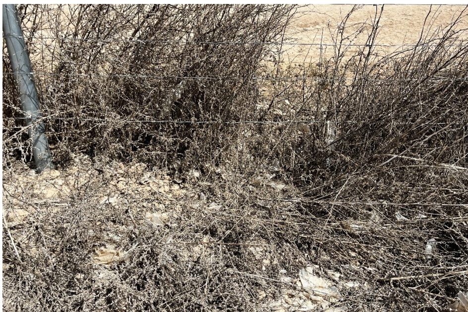
Figura 5 Restos de plásticos

El presente anexo se compone de un número representativo de fotografías del total realizado durante el periodo evaluado, escogidas por su relevancia y/o carácter explicativo para la correcta comprensión del presente informe.