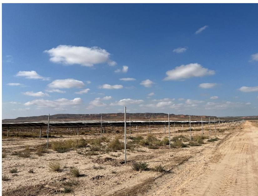
Figura 2 Instalación del vallado perimetral

Se ha preparado para cimentar diferentes puntos del vial interno con mayor probabilidad erosiva, y se ha continuado con la instalación del vallado perimetral.