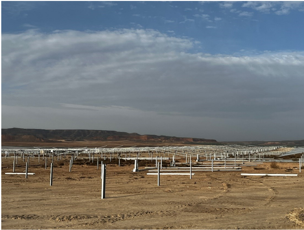
Figura 7 Montaje de los trackers