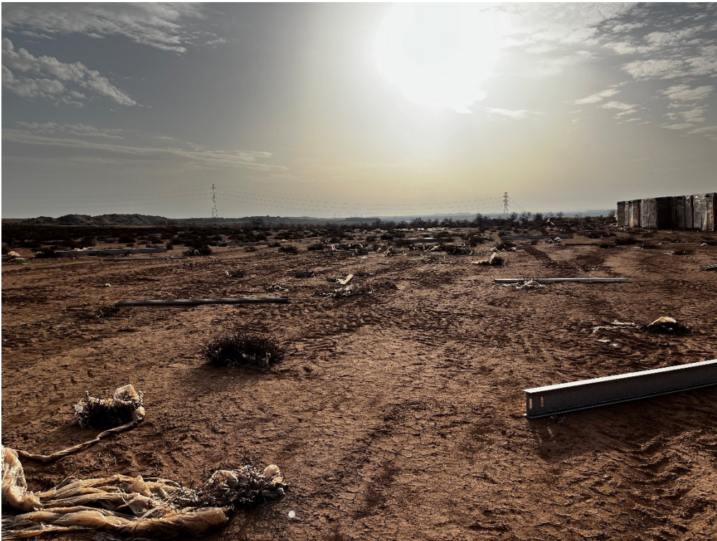
Figura 9 Restos de plástico