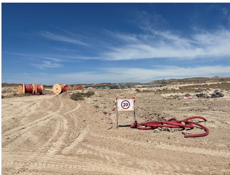
Figura 4 Señalización en obra

La obra dispone de cuba de agua y se realizan riesgos con regularidad. Además, la obra cuenta con un límite de velocidad establecido de 20km/h para reducir de esta forma las emisiones de polvo.