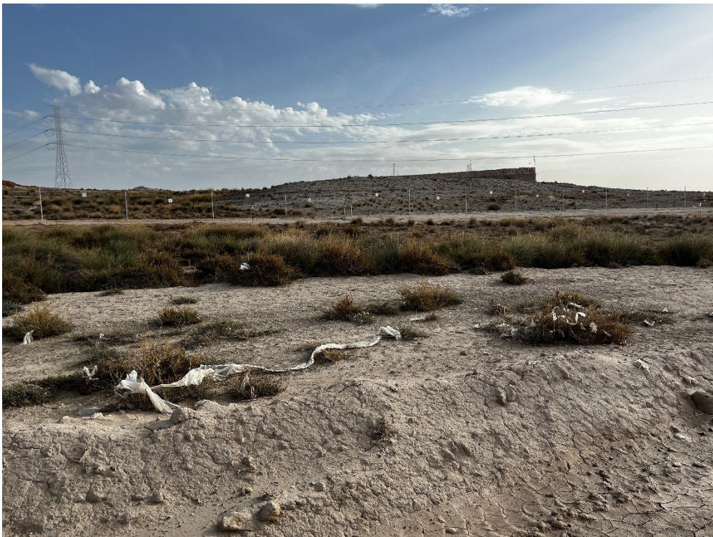
Figura 10 Restos de plásticos