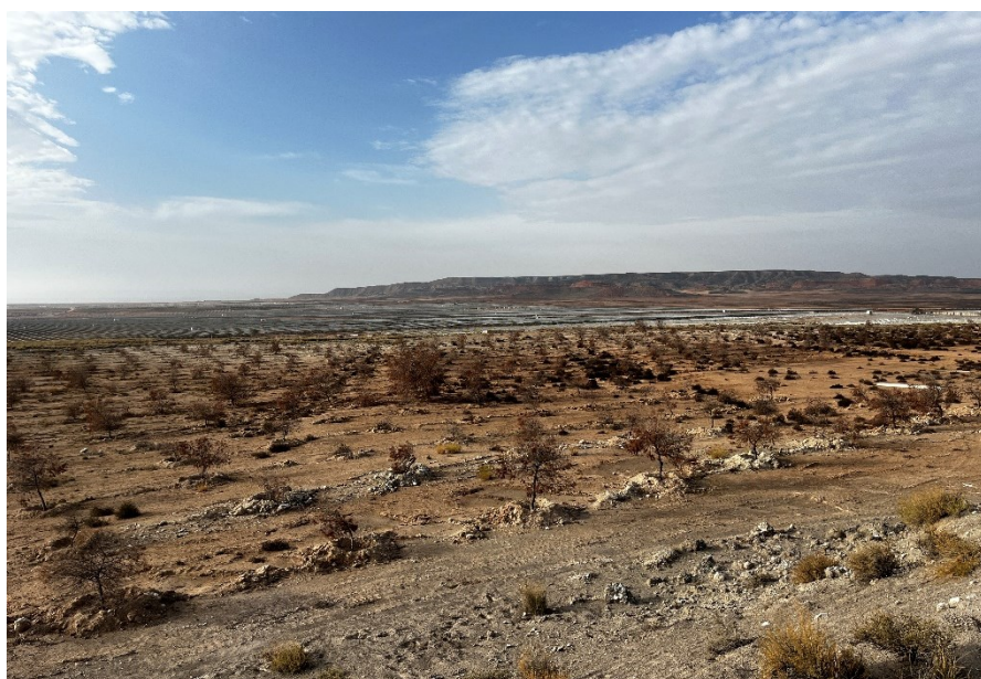
Figura 6 Masa de pinar trasplantada