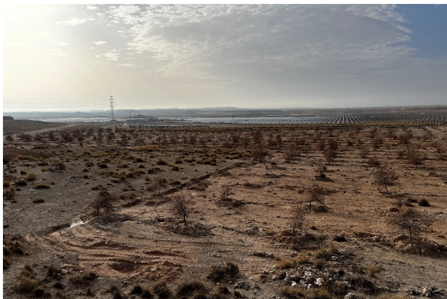
Figura 5 Masa de pinar trasplantada

El presente anexo se compone de un número representativo de fotografías del total realizado durante el periodo evaluado, escogidas por su relevancia y/o carácter explicativo para la correcta comprensión del presente informe.