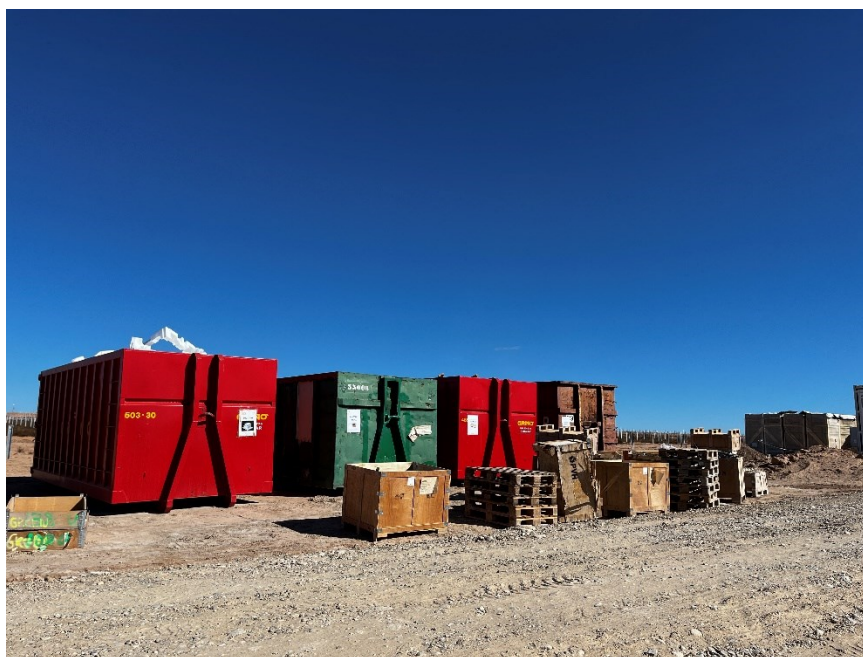
Figura 3 Punto limpio de RNP dispuesto dentro de la planta

El punto limpio de residuos no peligrosos consta de cinco contenedores, uno para restos plásticos (bolsa de basura, botellas, tubos corrugados...), cartón, flejes, madera y plástico blando. También hay una zona para los restos de ferralla.