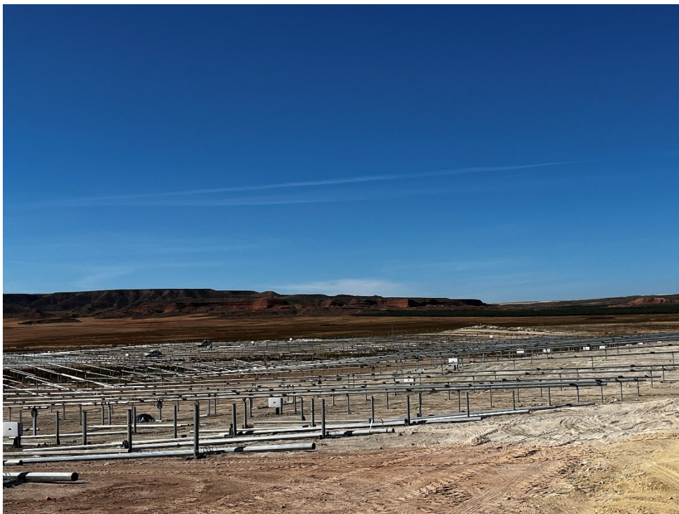
Figura 8 Montaje de los trackers