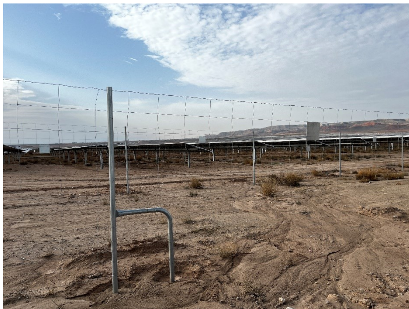
Figura 2 Instalación del vallado perimetral

Se ha preparado para cimentar diferentes puntos del vial interno con mayor probabilidad erosiva, y se ha terminado con la instalación del vallado perimetral.