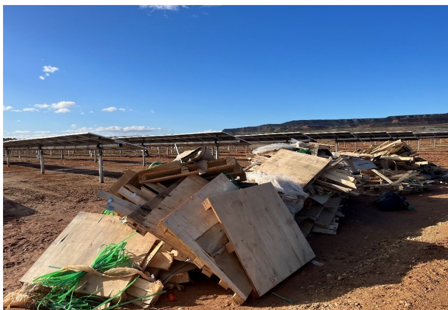
Figura 7 Acopio temporal de RNP