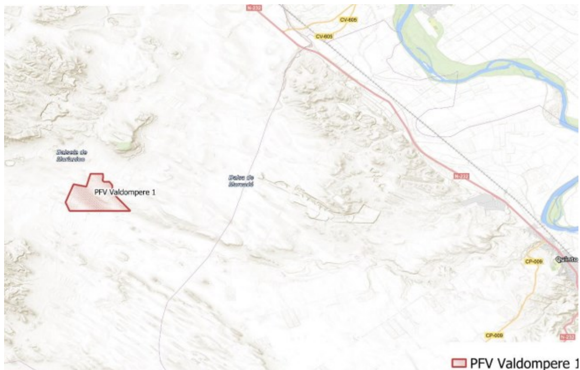
Figura 1 Localización del proyecto

Se localiza a 7 km al sureste de esta localidad sobre parcelas dedicadas al cultivo de cereal de secano en extensivo. El paraje donde se ubica la planta (Figura 1) se denomina "Valdecara" y se encuentra a 350 msnm aproximadamente.