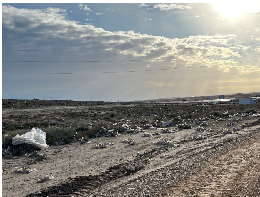
Figura 4 Restos de plásticos

Durante las últimas visitas se han observado abundantes trozos de plástico procedentes de el embalaje de las cajas de los módulos fotovoltaicos.