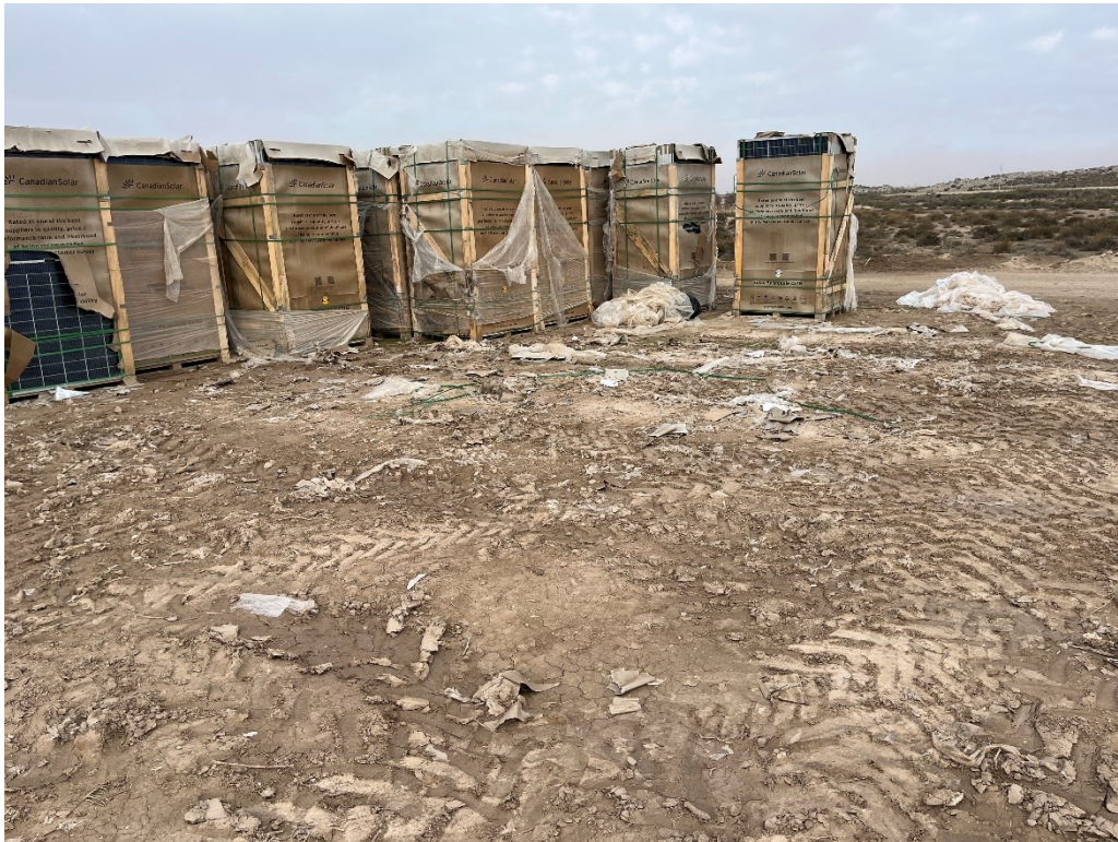
Figura 10 Acopio de los módulos fotovoltaicos