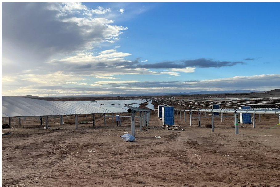
Figura 6 Montaje de los módulos

El presente anexo se compone de un número representativo de fotografías del total realizado durante el periodo evaluado, escogidas por su relevancia y/o carácter explicativo para la correcta comprensión del presente informe.