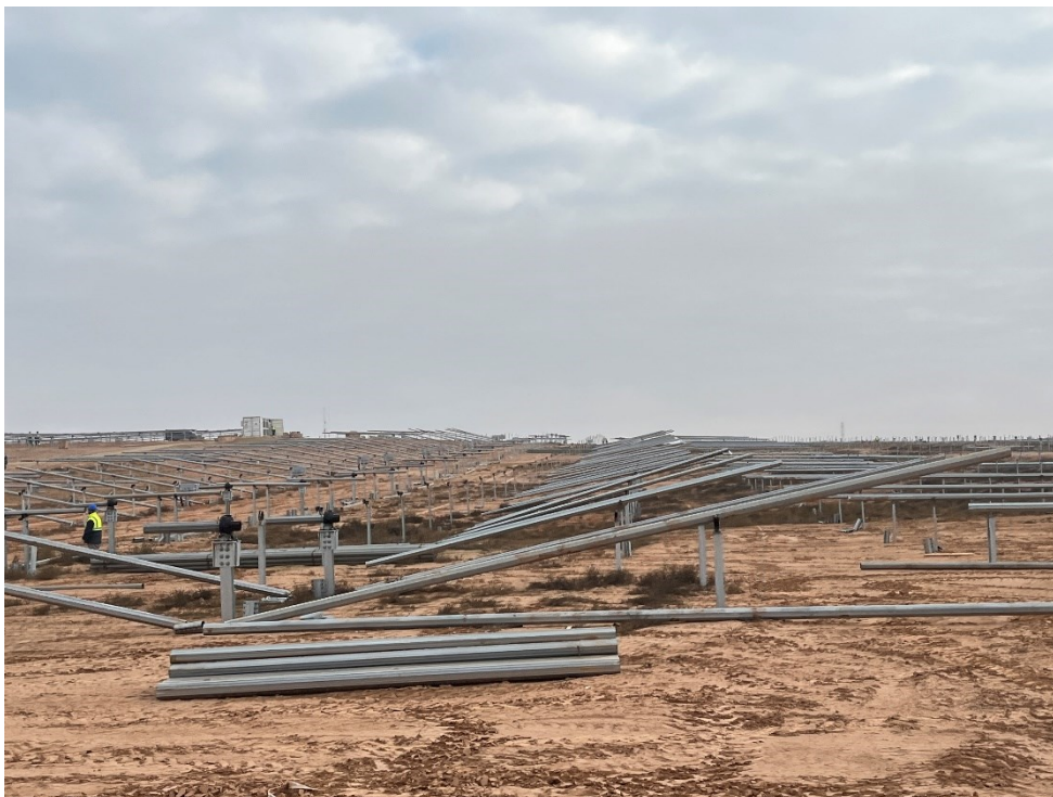
Figura 9 Montaje de los torques