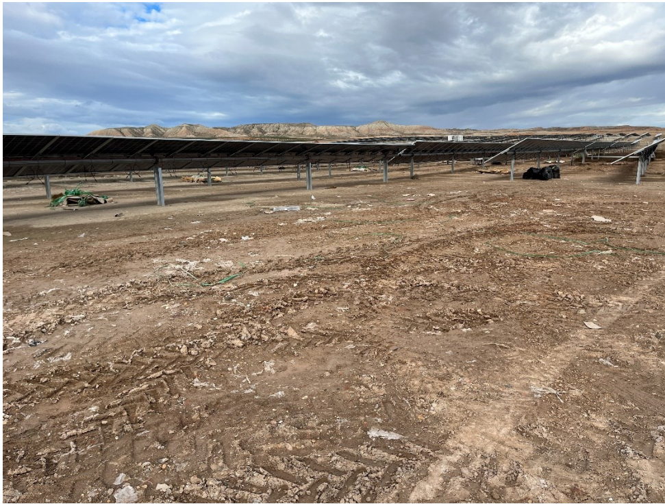
Figura 8 Restos de plásticos