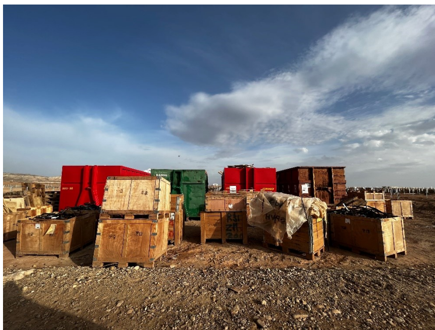
Figura 3 Punto limpio de RNP dispuesto dentro de la planta

El punto limpio de residuos no peligrosos consta de cinco contenedores, uno para restos plásticos (bolsa de basura, botellas, tubos corrugados...), cartón, flejes, madera y plástico blando. También hay una zona para los restos de ferralla.