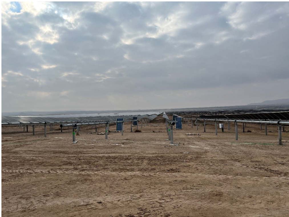
Figura 11 Montaje de los módulos