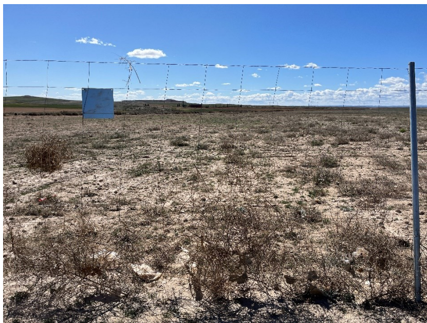
Figura 2 Restos de plásticos

Durante las últimas visitas se observaron abundantes trozos de plástico procedentes del embalaje de los módulos fotovoltaicos.