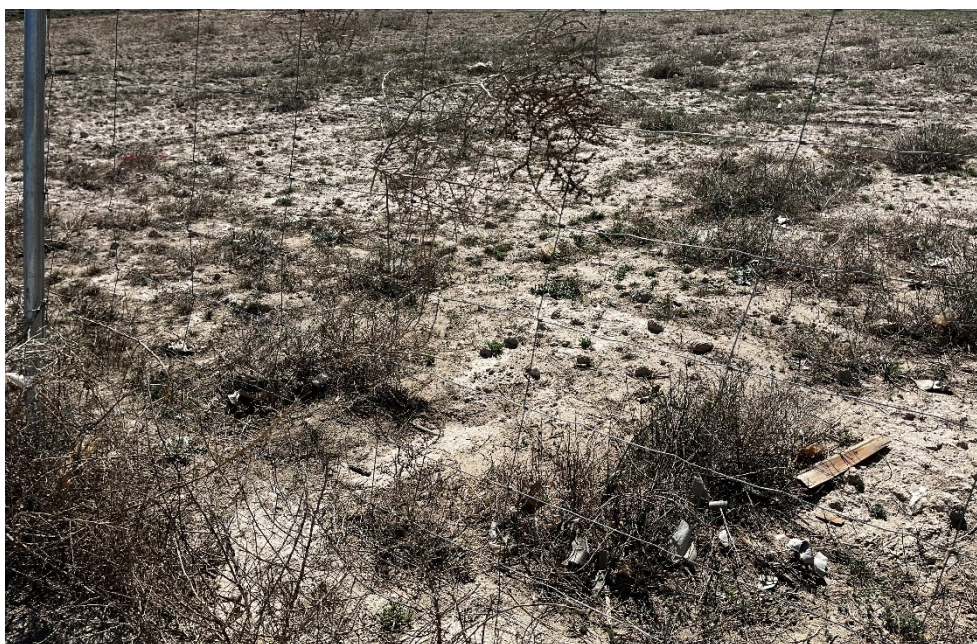
Figura 4 Restos de plásticos