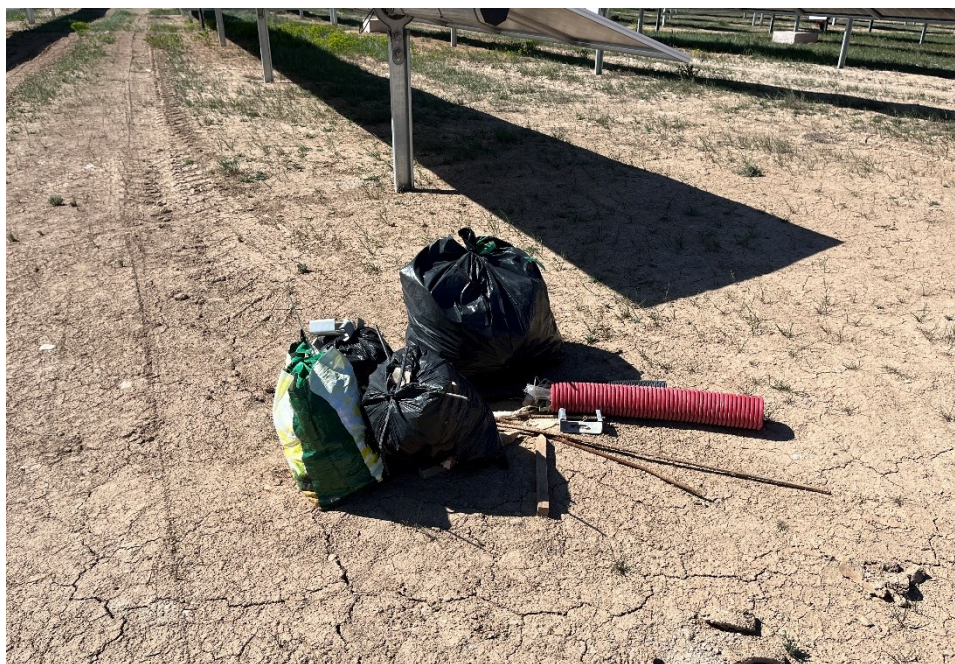
Figura 3 Retirada y limpieza de residuos

El presente anexo se compone de un número representativo de fotografías del total realizado durante el periodo evaluado, escogidas por su relevancia y/o carácter explicativo para la correcta comprensión del presente informe.