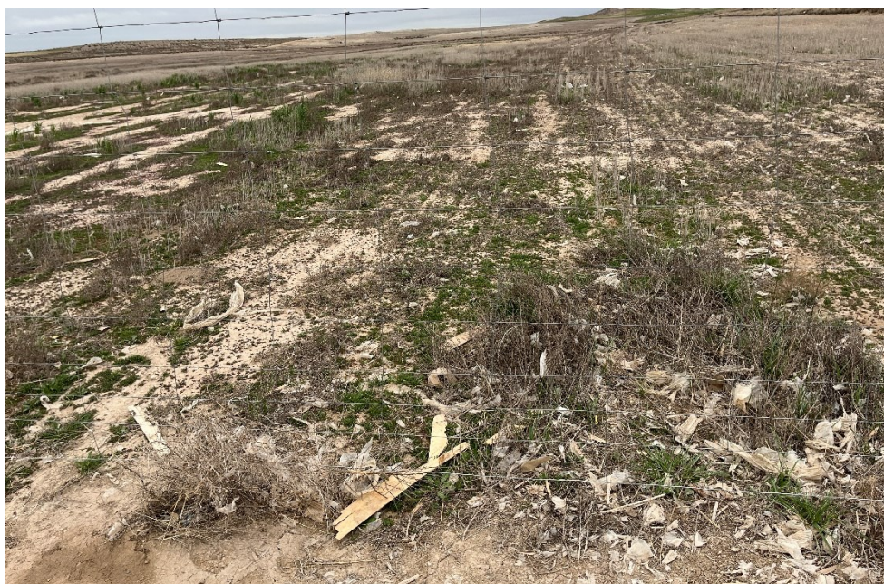
Figura 4 Restos de plásticos