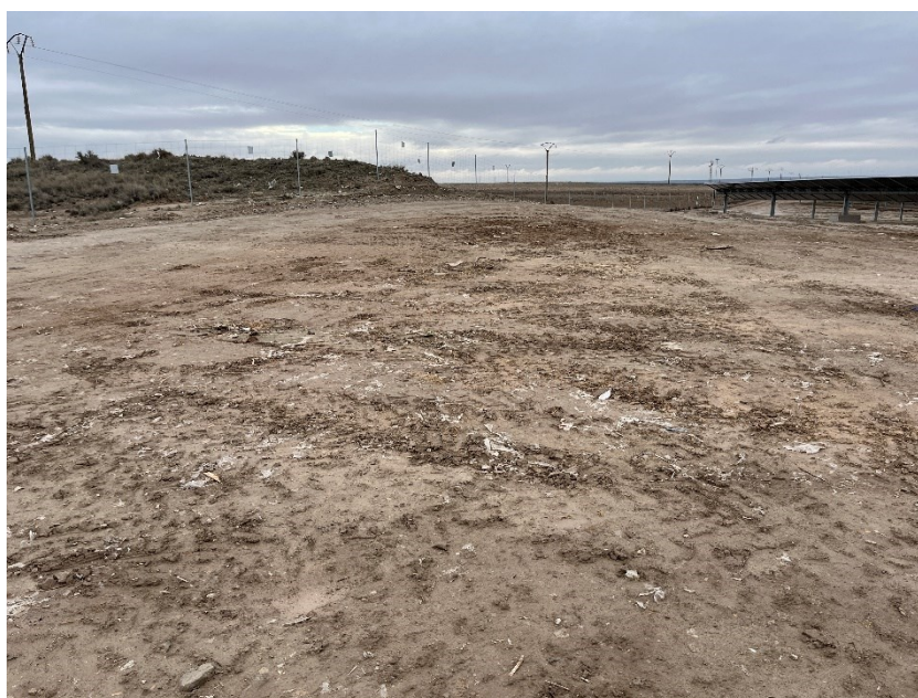
Figura 2 Restos de plásticos

Durante las últimas visitas se observaron abundantes trozos de plástico procedentes del embalaje de los módulos fotovoltaicos.