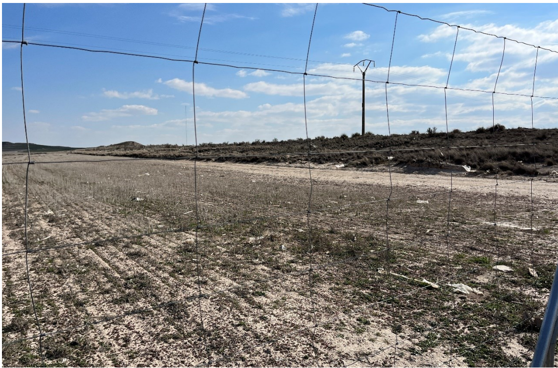
Figura 5 Restos de plásticos