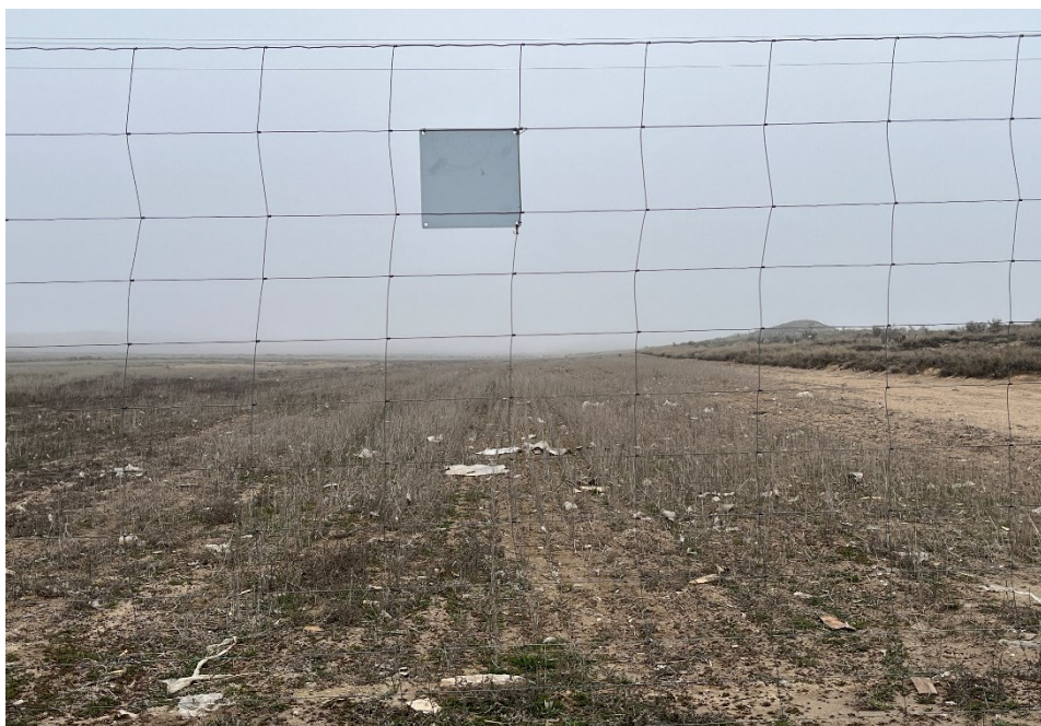
Figura 3 Restos de plásticos

El presente anexo se compone de un número representativo de fotografías del total realizado durante el periodo evaluado, escogidas por su relevancia y/o carácter explicativo para la correcta comprensión del presente informe.