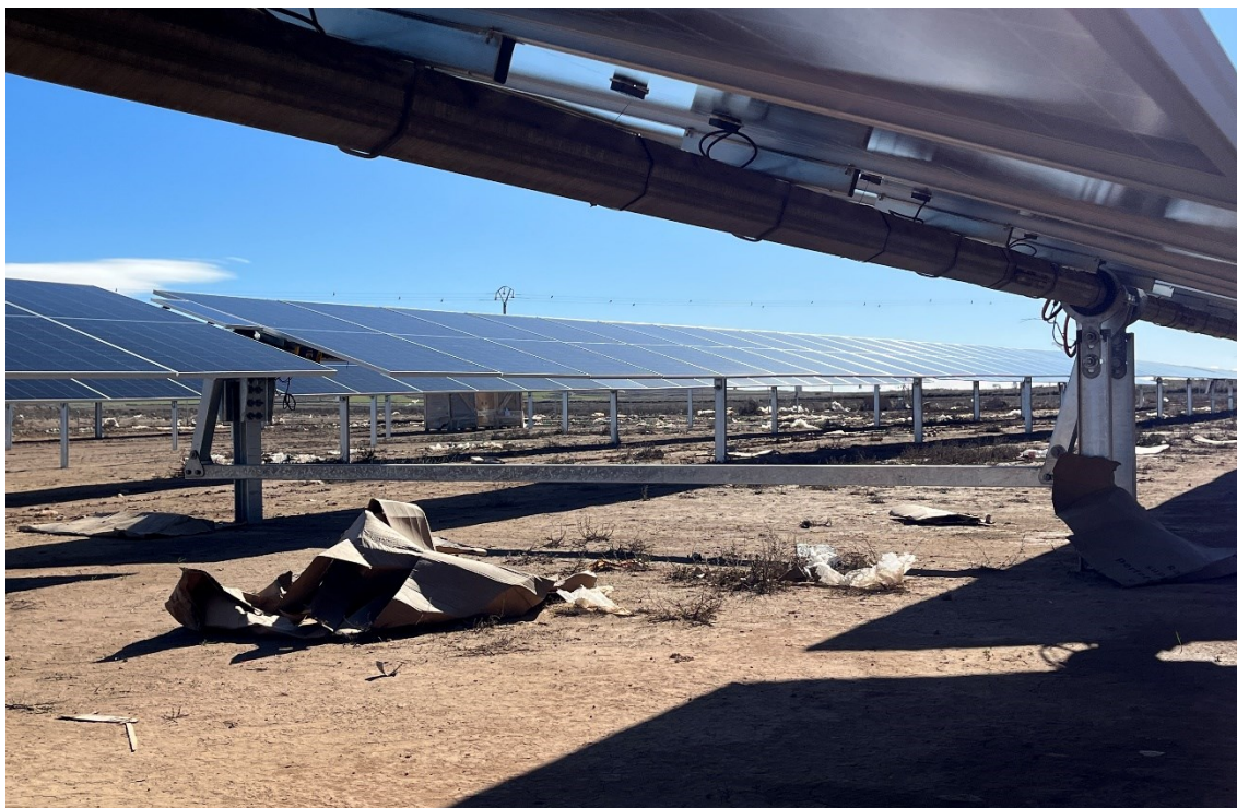
Figura 8 Restos de plásticos