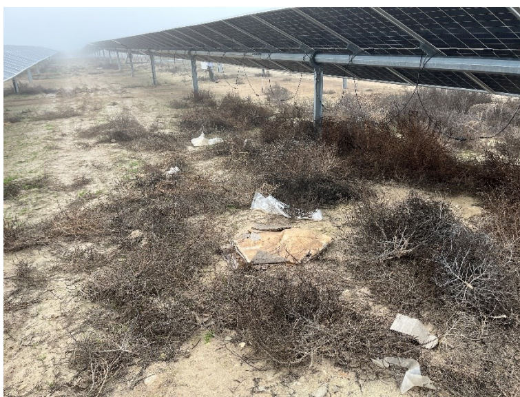
Figura 4 Restos de plásticos

Durante las últimas visitas se observaron abundantes trozos de plástico procedentes del embalaje de los módulos fotovoltaicos.