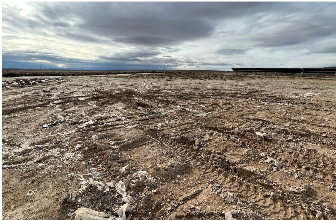
Figura 9 Restos de plásticos