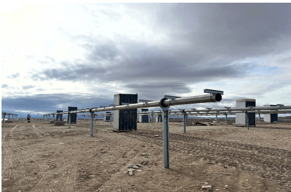
Figura 6 Montaje de los módulos fotovoltaicos