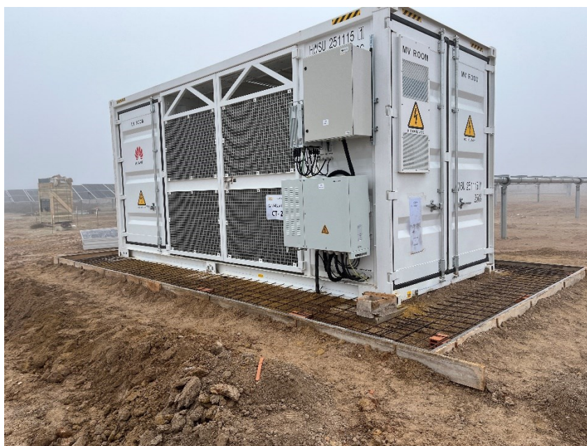
Figura 2 Encofrado de la base de los CT para su cimentación

Se ha continuado cimentando diferentes puntos del vial interno con mayor probabilidad erosiva, la base de los CT y algunas de las hincas.