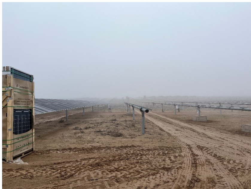
Figura 3 Montaje de los módulos fotovoltaicos