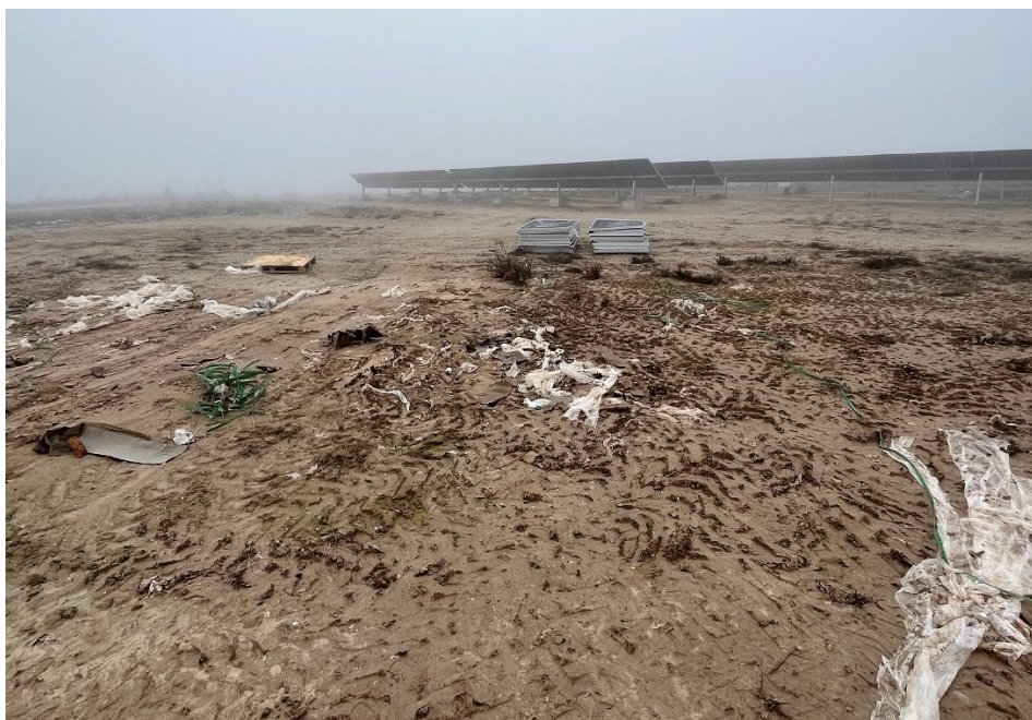
Figura 5 Restos de plásticos

El presente anexo se compone de un número representativo de fotografías del total realizado durante el periodo evaluado, escogidas por su relevancia y/o carácter explicativo para la correcta comprensión del presente informe.