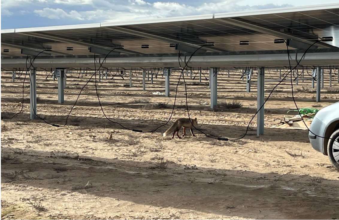
Figura 7 Zorro (Vulpes vulpes)