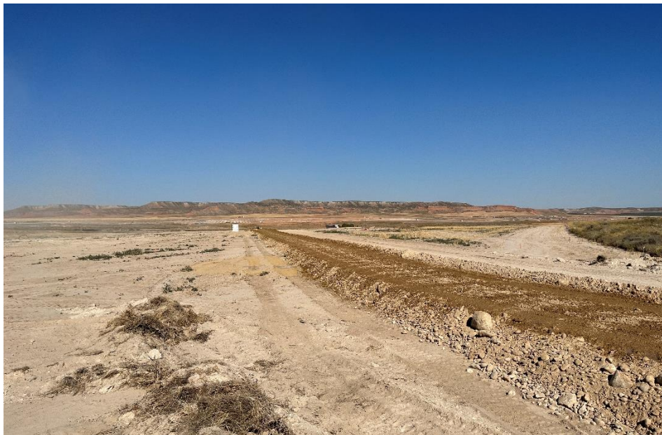
Figura 6 Apertura de viales

El presente anexo se compone de un número representativo de fotografías del total realizado durante el periodo evaluado, escogidas por su relevancia y/o carácter explicativo para la correcta comprensión del presente informe.