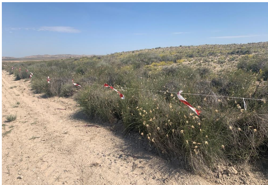
Figura 5 Balizado de la vegetación natural