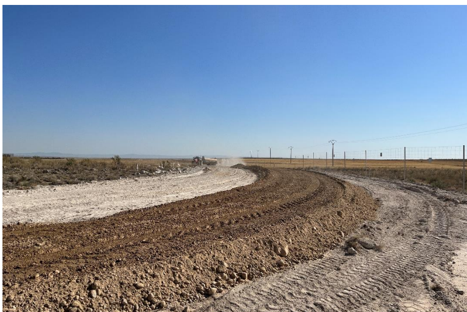
Figura 7 Apertura de viales