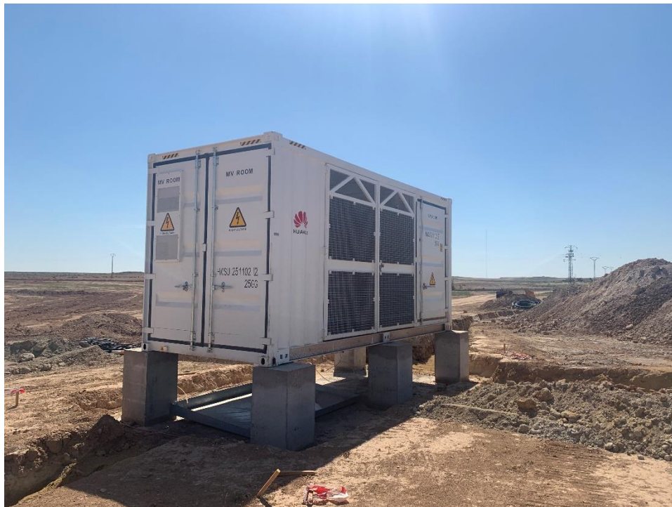
Figura 8 CT