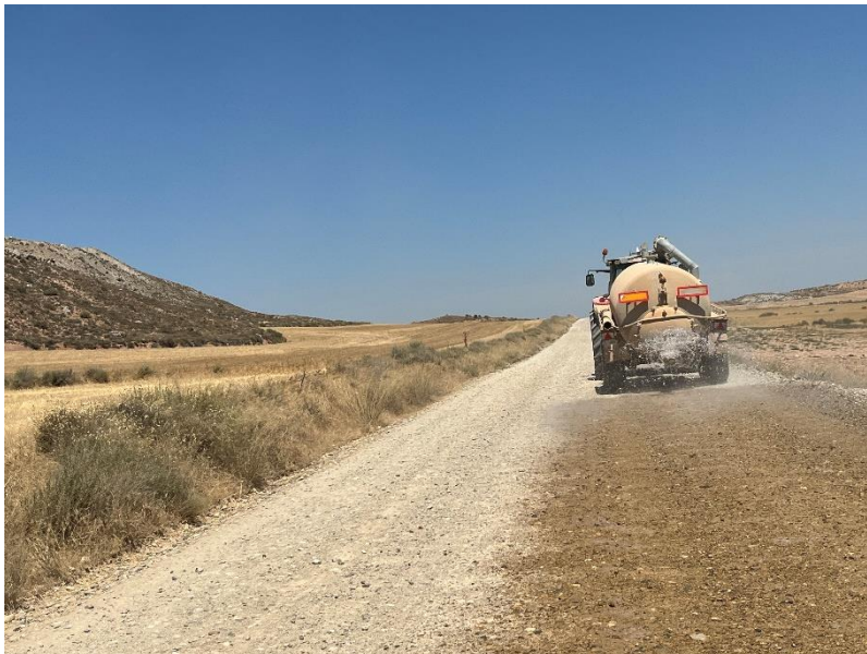
Figura 4 Riego de caminos

La obra dispone de cuba de agua y se realizan riegos con regularidad. Además, la obra cuenta con un límite de velocidad establecido de 20km/h para reducir de esta forma las emisiones de polvo.