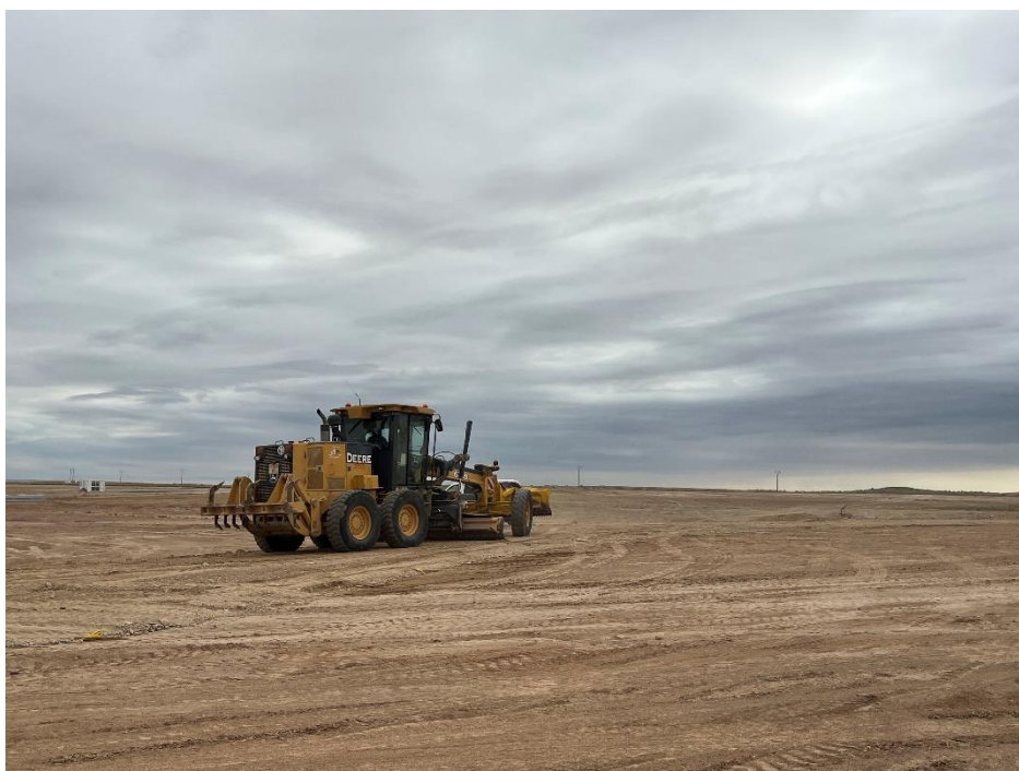
Figura 2 Apertura de viales

A lo largo de este mes se ha finalizado con el movimiento de tierras, la apertura de zanjas de la red de media y baja tensión y con las cimentaciones. También se ha empezado con la apertura de viales (Figura 2).