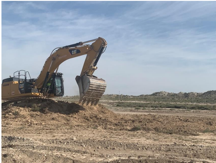
Figura 3 Esparcido de la tierra vegetal

Los acopios de tierra vegetal procedentes de los desbroces, fue segregada a principios de este mes.