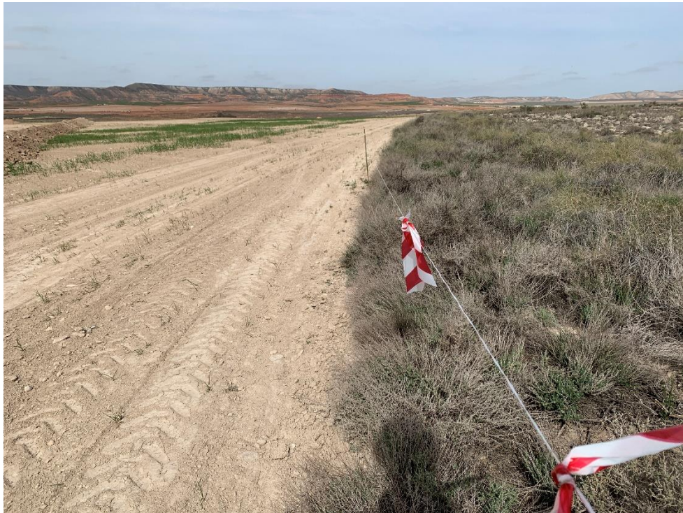
Figura 8 Balizado de la vegetación natural