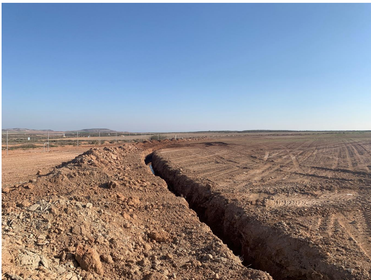
Figura 2 Apertura de zanjas

Esta actividad se ha desarrollado principalmente con los movimientos de tierras y acondicionamiento del terreno, apertura de viales, zanjas de red de media tensión (Figura 2) y desbroces.