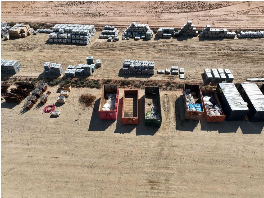
Figura 10 Zona de punto limpio de residuos no peligrosos