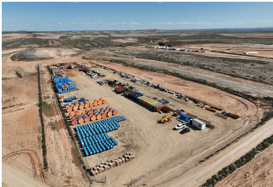
Figura 4 Zona de acopio logístico

En la planta se mantiene un nivel de orden y limpieza óptimo. El acopio logístico de materiales para la fase de construcción se ha realizado de manera correcta en las zonas destinadas para esta labor.