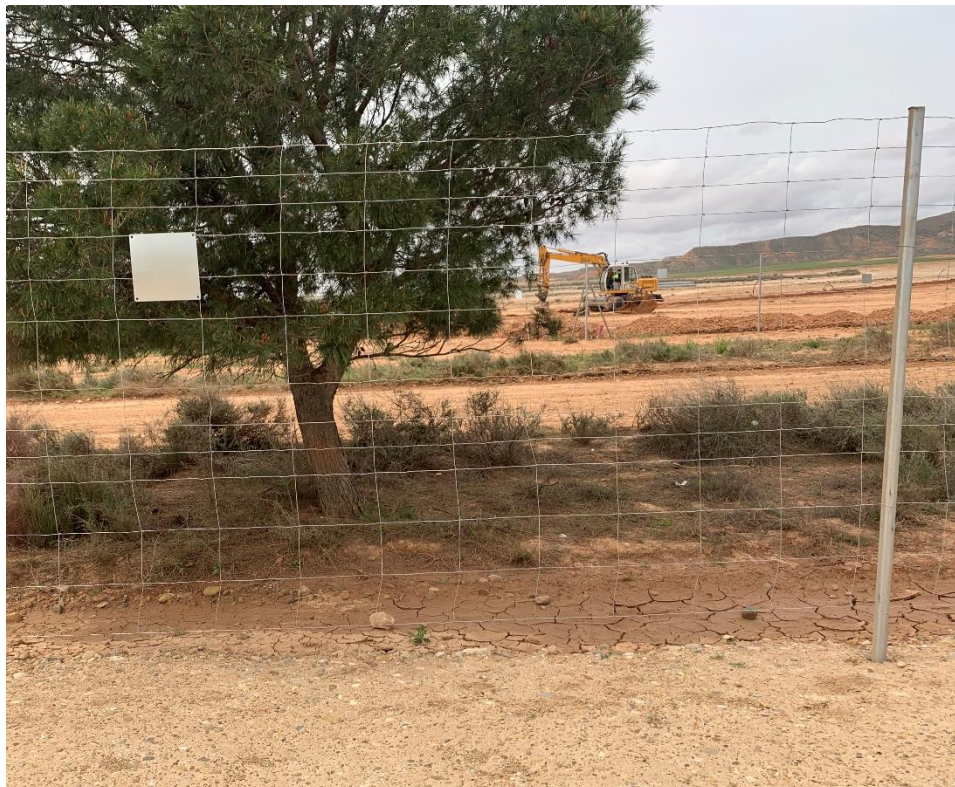
Figura 11 Vallado perimetral de la zona de casetas subsanado