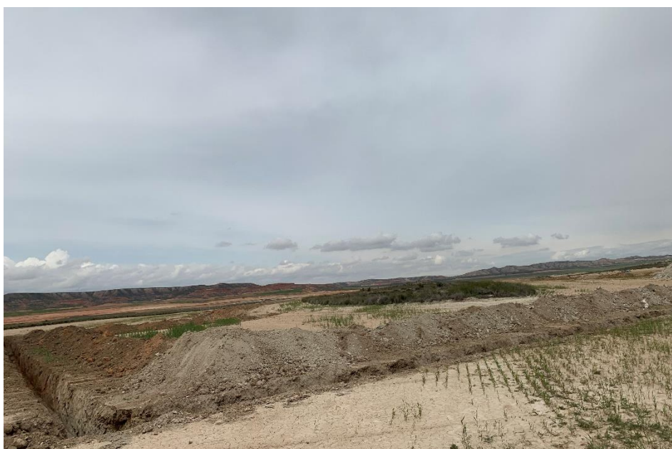
Figura 6 Apertura de zanjas