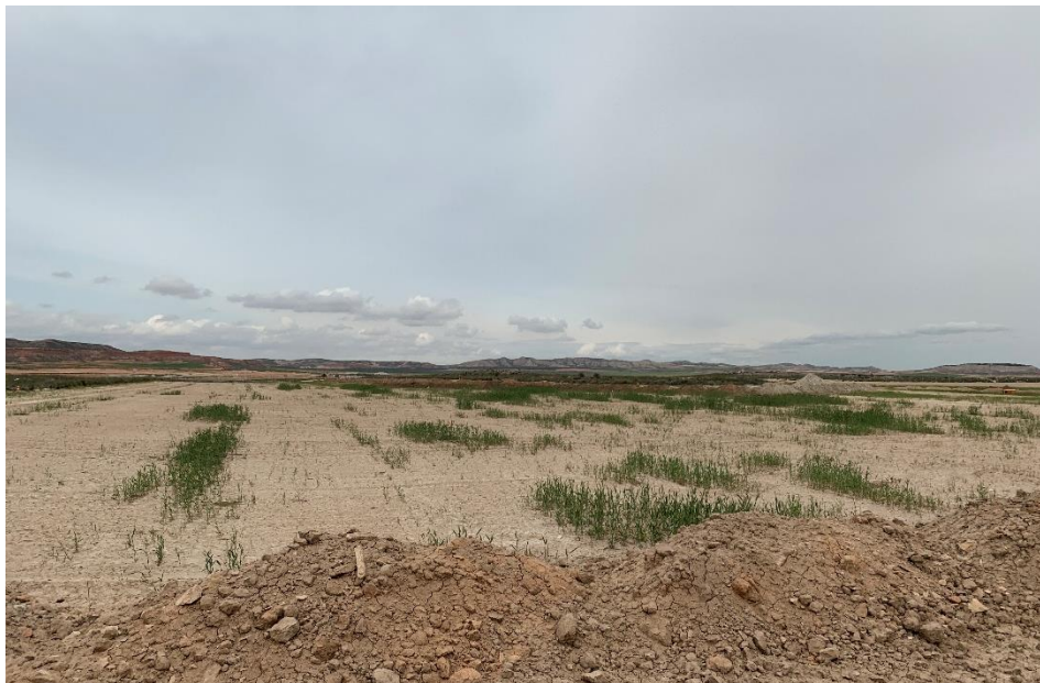
Figura 5 Apertura de zanjas

El presente anexo se compone de un número representativo de fotografías del total realizado durante el periodo evaluado, escogidas por su relevancia y/o carácter explicativo para la correcta comprensión del presente informe.