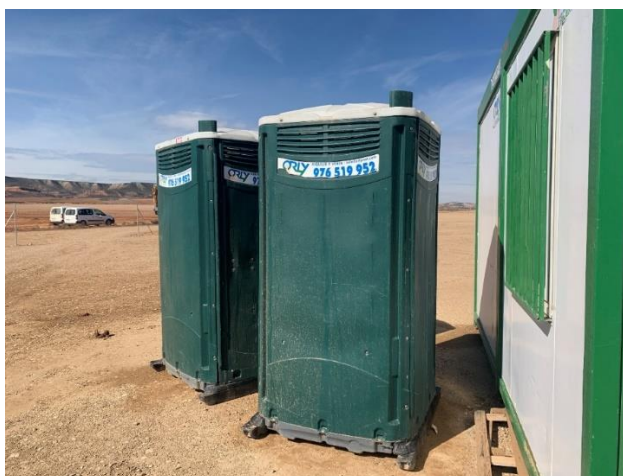
Figura 3 Baños químicos

La ejecución de los trabajos no afecta a cauces ni cursos de agua, tanto temporales como permanentes y la gestión de aguas residuales (baños químicos) se realiza correctamente.