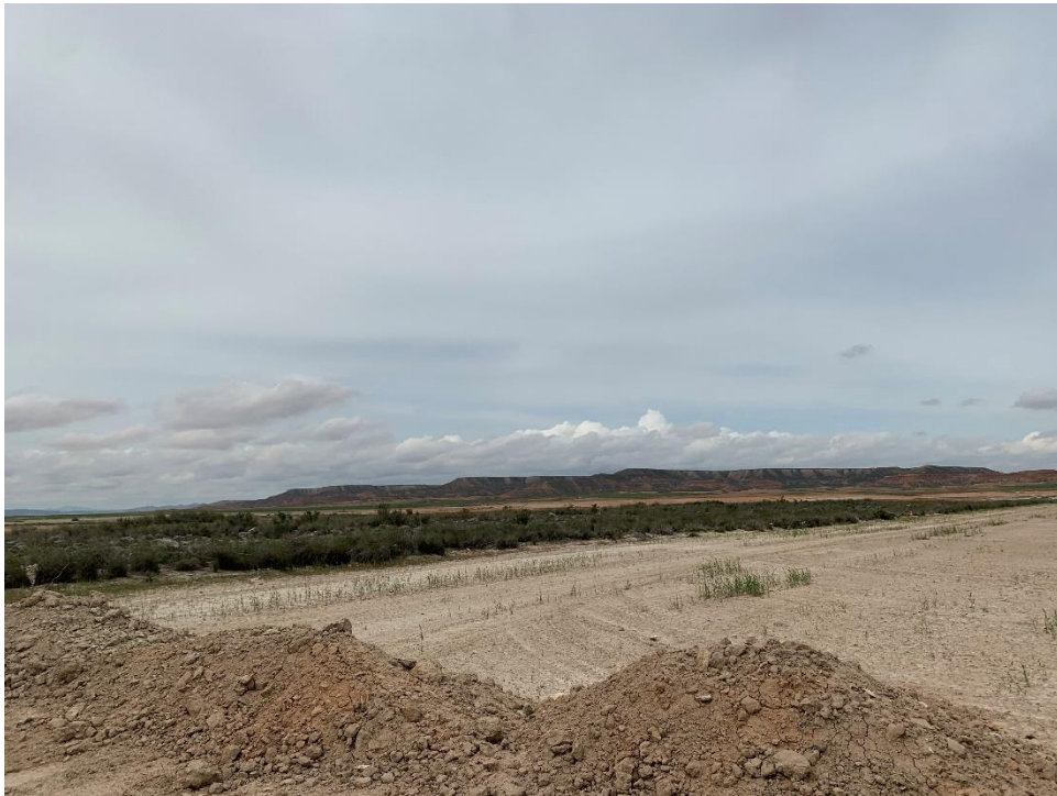
Figura 7 Zona de vegetación natural