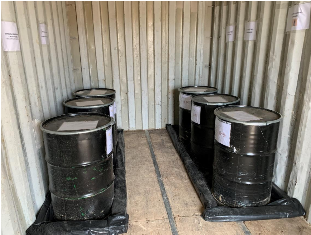
Figura 9 Punto limpio de residuos peligrosos