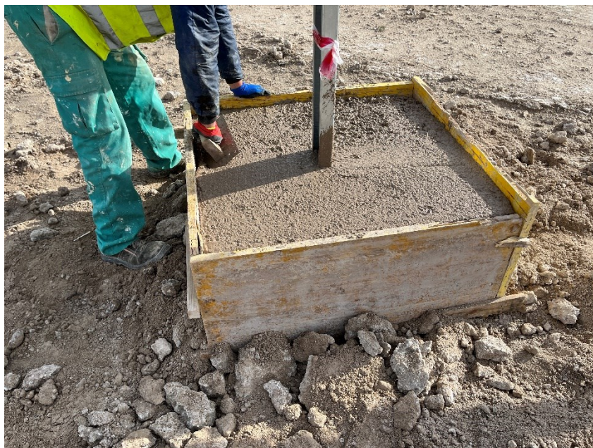
Figura 2 Cimentación del hincado

Se ha continuado cimentando diferentes puntos del vial interno con mayor probabilidad erosiva, la base de los CT y algunas de las hincas.