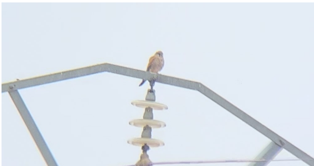
Figura 5 Cernícalo común (Falco tinnunculus)

El presente anexo se compone de un número representativo de fotografías del total realizado durante el periodo evaluado, escogidas por su relevancia y/o carácter explicativo para la correcta comprensión del presente informe.