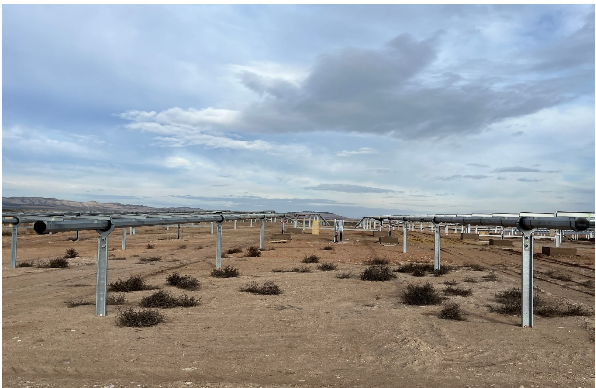
Figura 8 Montaje de los trackers