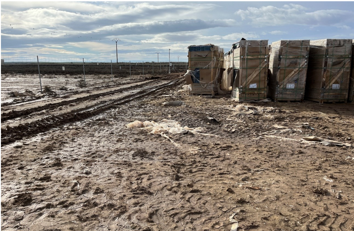
Figura 10 Restos de plásticos