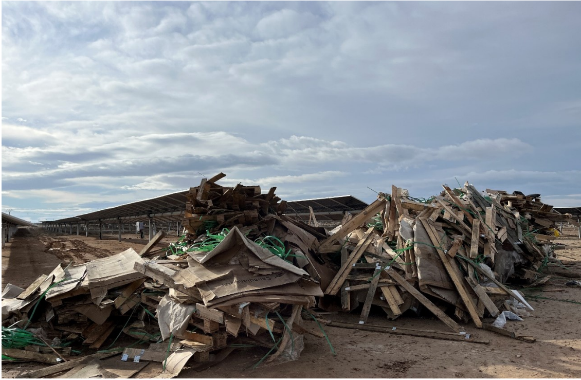
Figura 7 Acopio temporal de RNP