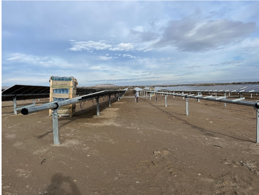
Figura 3 Montaje de los módulos fotovoltaicos