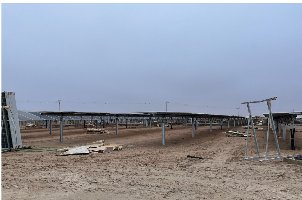
Figura 6 Montaje de los módulos fotovoltaicos