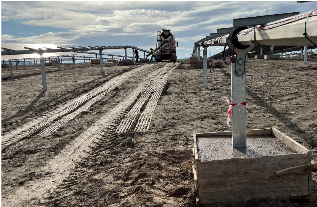
Figura 9 Cimentación de las hincas