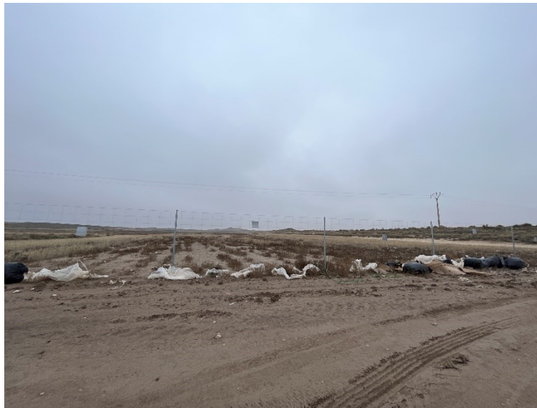
Figura 4 Restos de plásticos

Durante las últimas visitas se observaron abundantes trozos de plástico procedentes del embalaje de los módulos fotovoltaicos.