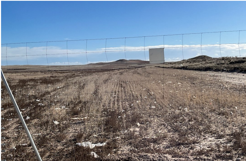
Figura 9 Restos de plástico en el exterior de la planta