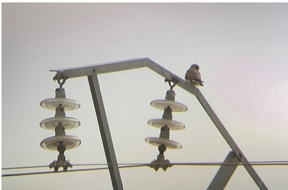
Figura 5 Cernícalo común (Falco tinnunculus)

El presente anexo se compone de un número representativo de fotografías del total realizado durante el periodo evaluado, escogidas por su relevancia y/o carácter explicativo para la correcta comprensión del presente informe.