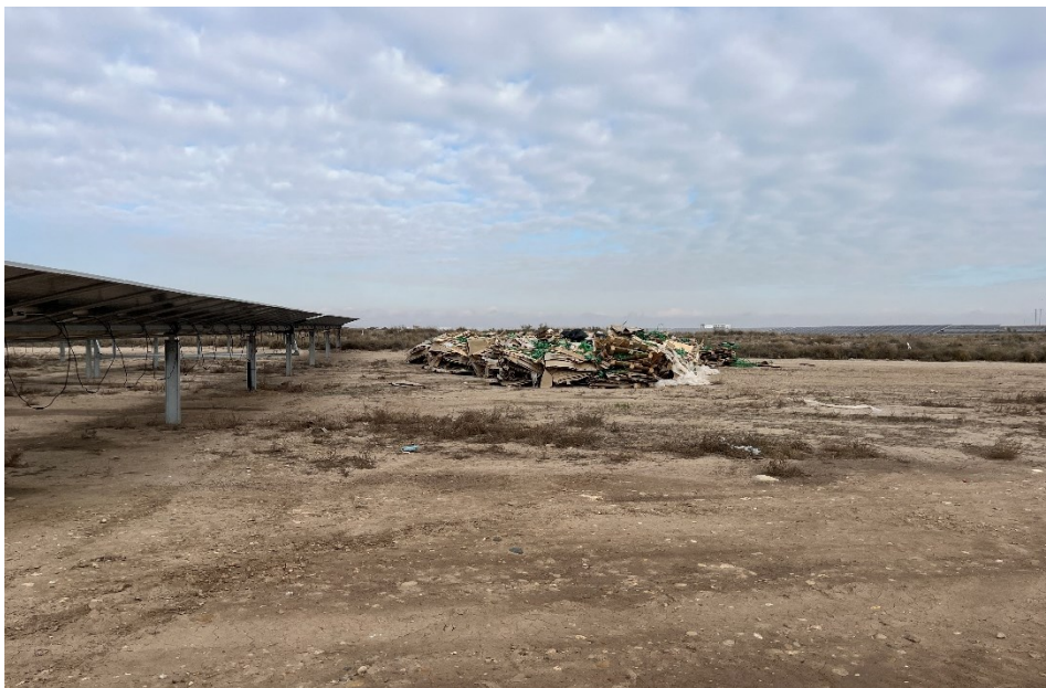
Figura 8 Acopio temporal de residuos no peligrosos