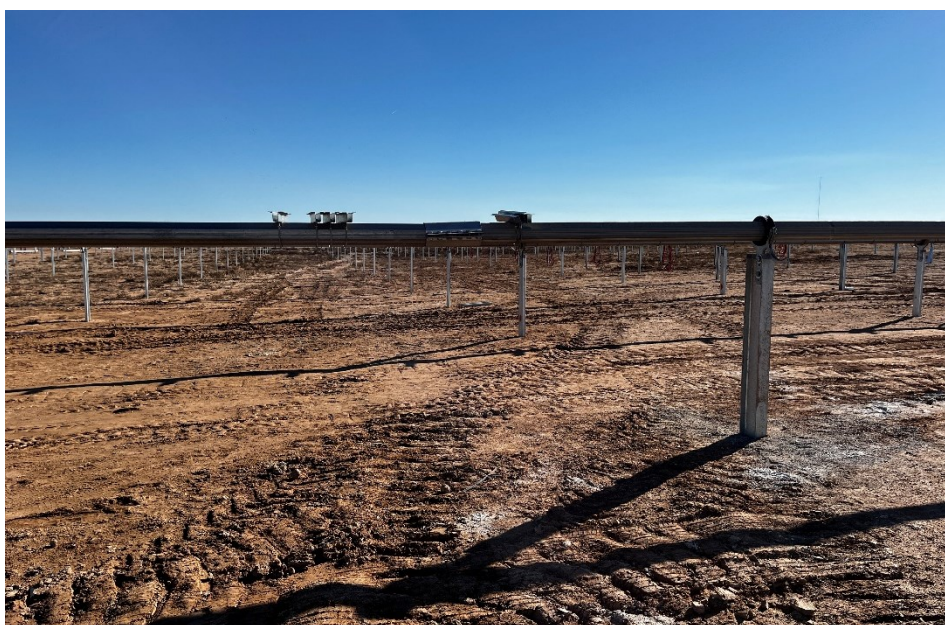
Figura 6 Montaje de torques