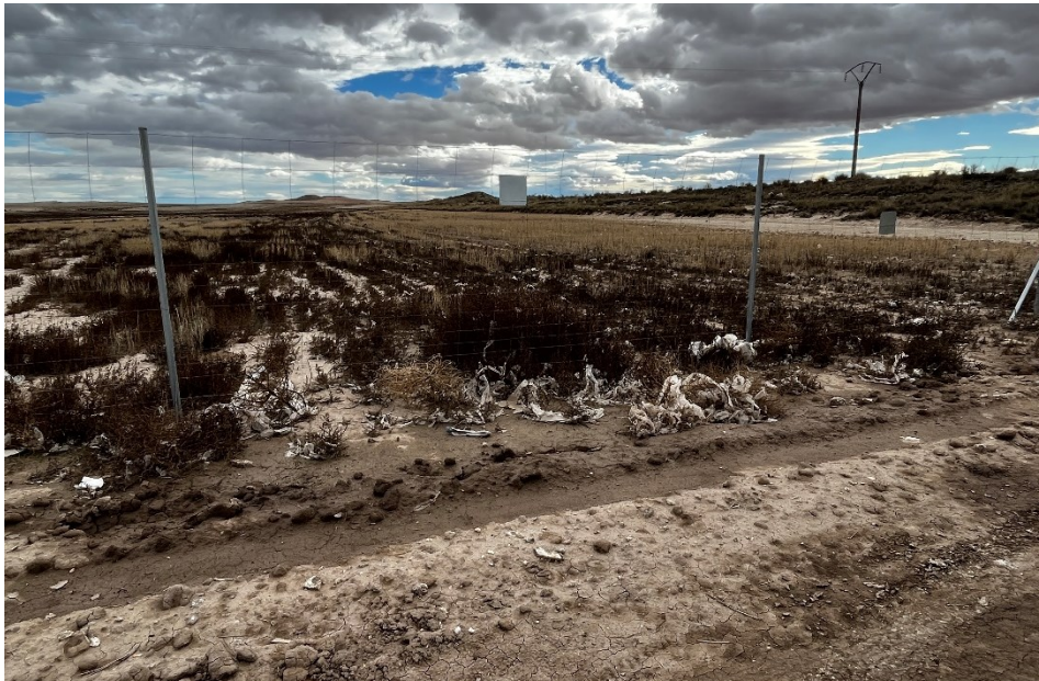
Figura 7 Restos de plásticos