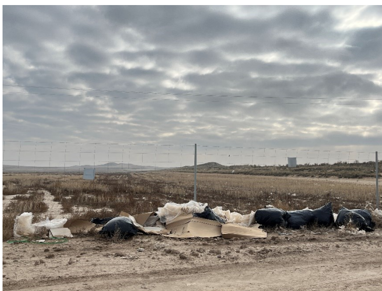
Figura 4 Restos de plásticos

Durante las últimas visitas se observaron abundantes trozos de plástico procedentes del embalaje de los módulos fotovoltaicos.