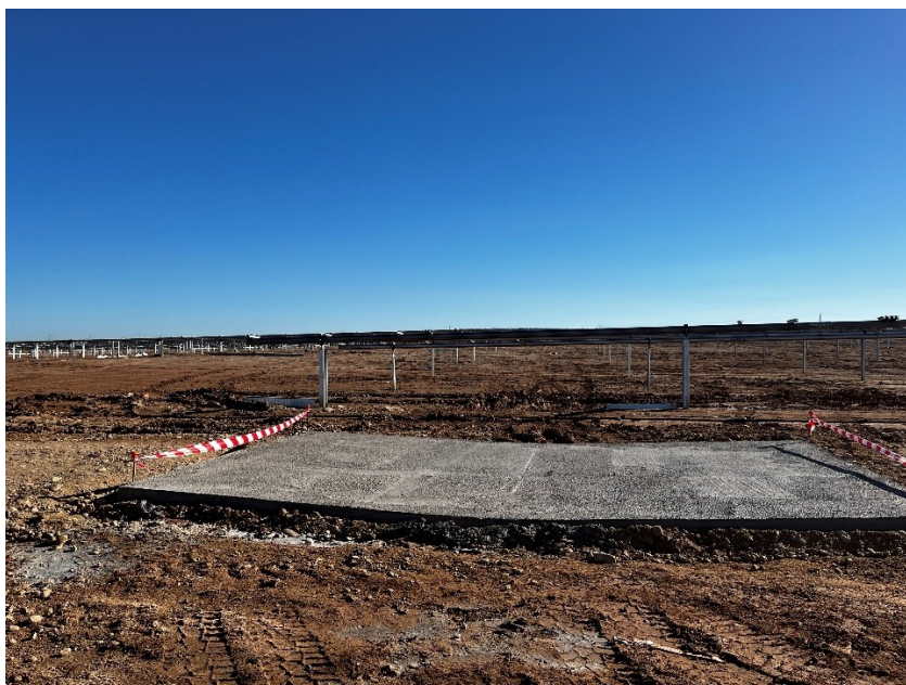
Figura 2 Cimentación del vial interno

Se han cimentado diferentes puntos del vial interno con mayor probabilidad erosiva.