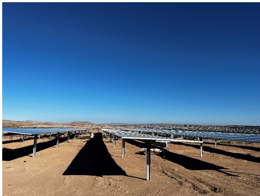
Figura 3 Montaje de los módulos fotovoltaicos