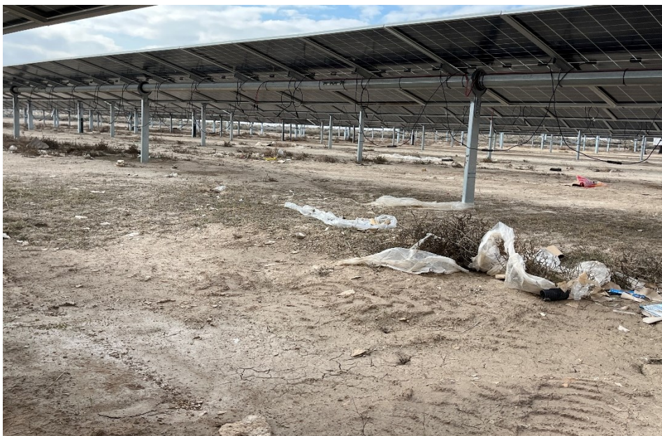
Figura 10 Restos de plásticos