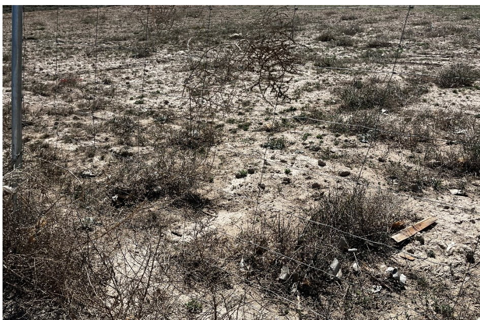
Figura 5 Restos de plásticos en el exterior de la planta