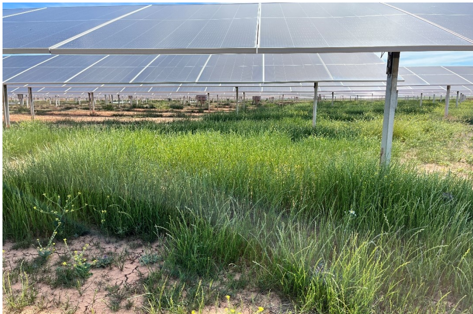
Figura 6 Estado de la vegetación natural