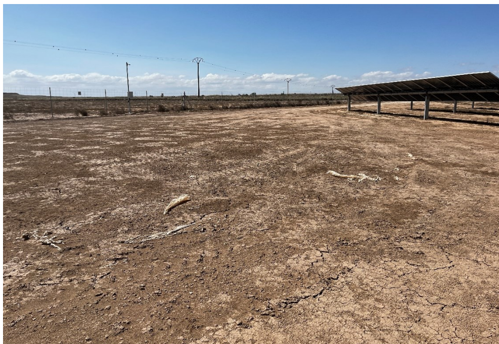
Figura 2 Restos de plásticos

El acopio logístico de materiales para la fase de construcción se ha realizado de manera correcta en las zonas destinadas para esta labor. También se ha dispuesto un punto limpio de RNP dentro de la planta.