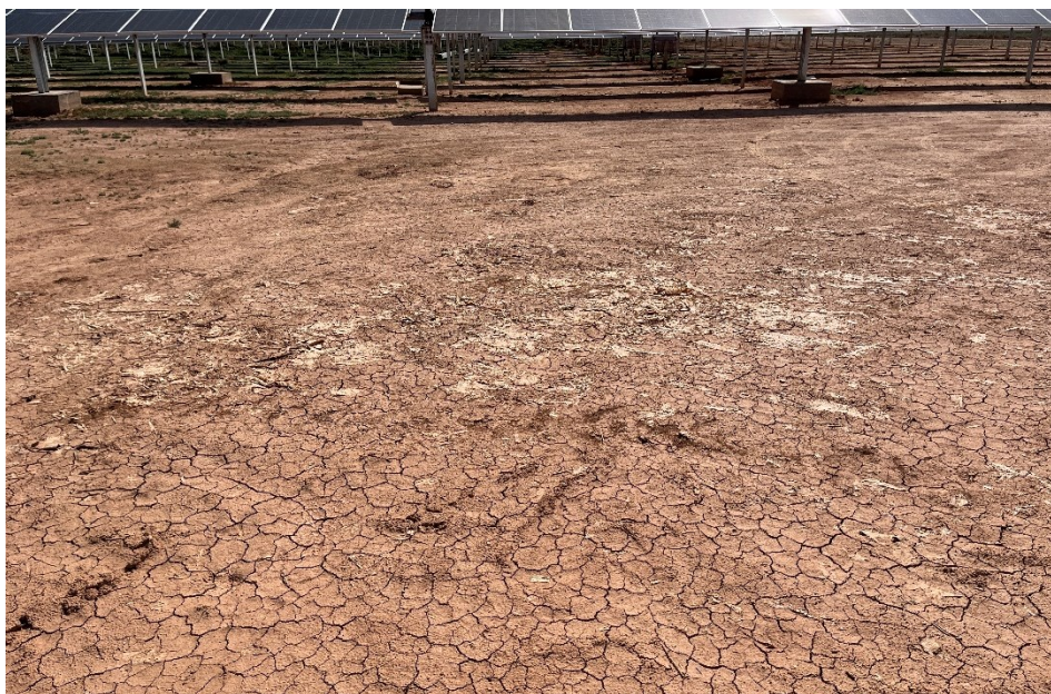
Figura 4 Restos de plásticos en el interior de la planta

El presente anexo se compone de un número representativo de fotografías del total realizado durante el periodo evaluado, escogidas por su relevancia y/o carácter explicativo para la correcta comprensión del presente informe.