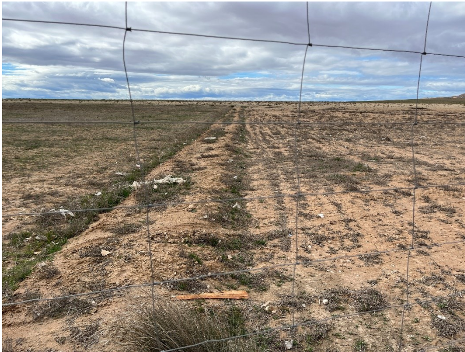
Figura 6 Restos de plásticos en el exterior de la planta