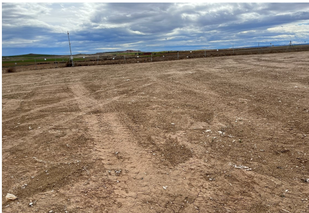
Figura 2 Restos de plásticos

El acopio logístico de materiales para la fase de construcción se ha realizado de manera correcta en las zonas destinadas para esta labor. También se ha dispuesto un punto limpio de RNP dentro de la planta.