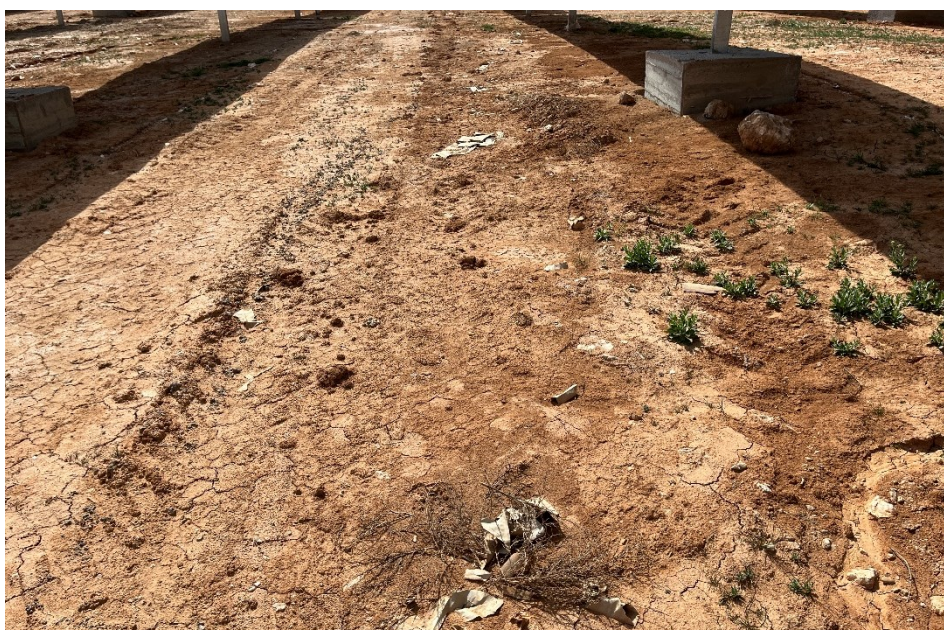
Figura 5 Restos de plásticos en el interior de la planta