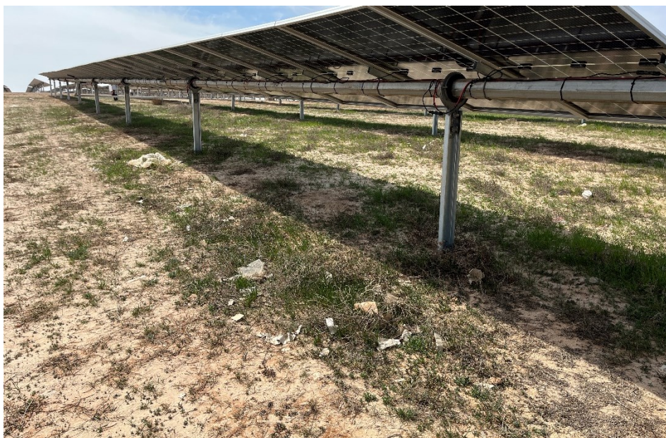
Figura 4 Restos de plásticos en el interior de la planta

El presente anexo se compone de un número representativo de fotografías del total realizado durante el periodo evaluado, escogidas por su relevancia y/o carácter explicativo para la correcta comprensión del presente informe.