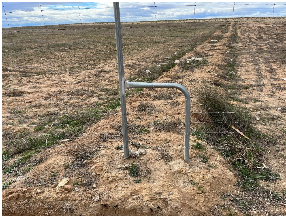
Figura 7 Restos de plásticos en el exterior de la planta