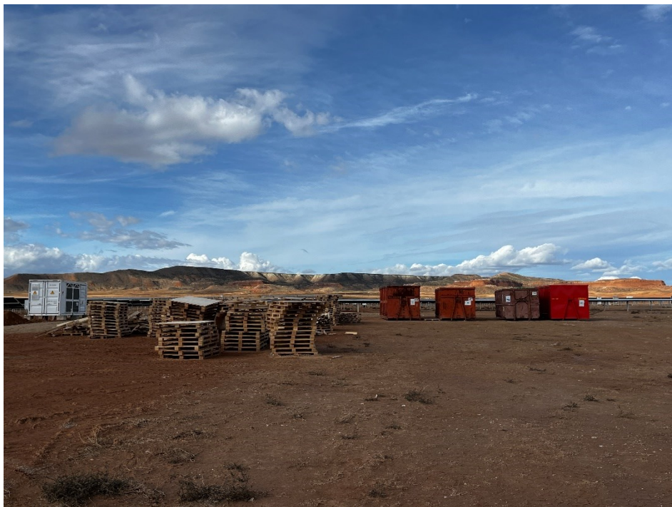
Figura 9 Punto limpio de residuos no peligrosos