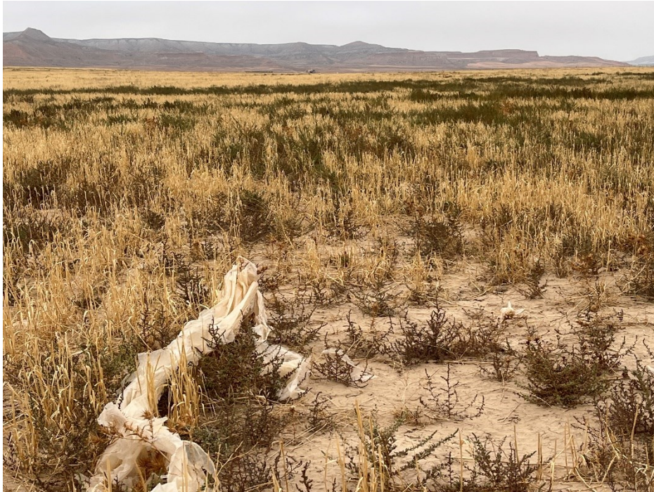
Figura 8 Restos de plásticos fuera de la planta