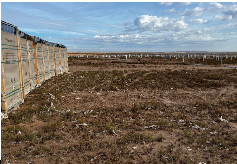
Figura 4 Restos de plásticos

El acopio logístico de materiales para la fase de construcción se ha realizado de manera correcta en las zonas destinadas para esta labor. También se ha dispuesto un punto limpio de RNP dentro de la planta.