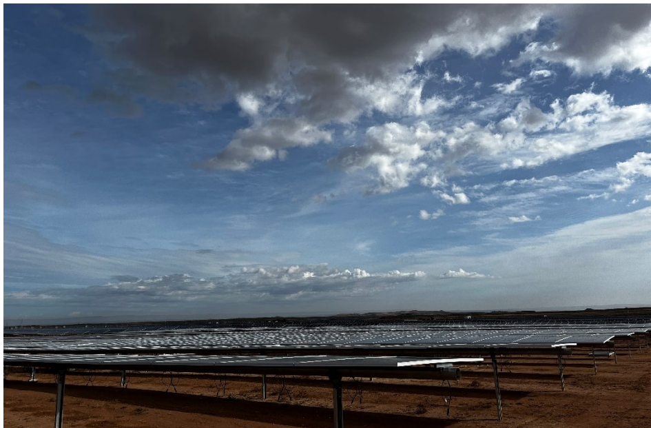
Figura 6 Montaje de los módulos

El presente anexo se compone de un número representativo de fotografías del total realizado durante el periodo evaluado, escogidas por su relevancia y/o carácter explicativo para la correcta comprensión del presente informe.