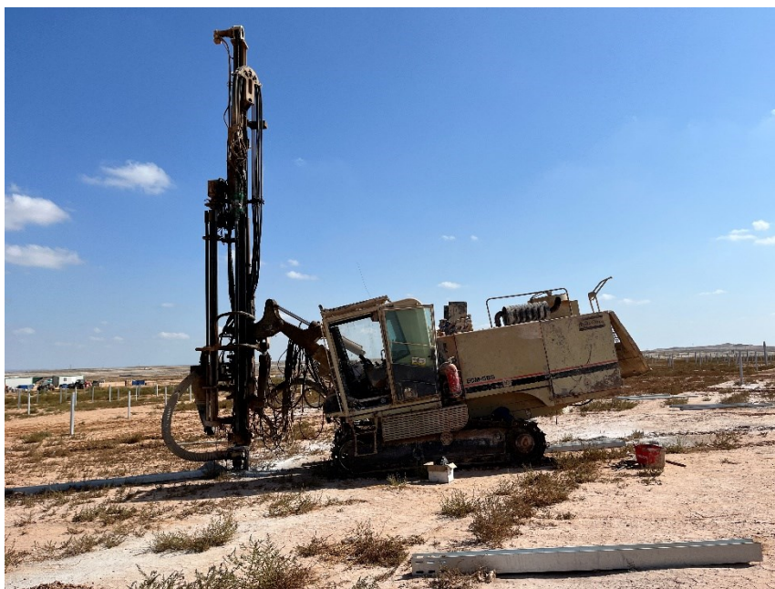
Figura 2 Montaje de los trackers

Durante este mes, han finalizado con el hincado (Figura 2) y han continuado con el montaje de los trackers y de los módulos fotovoltaicos.