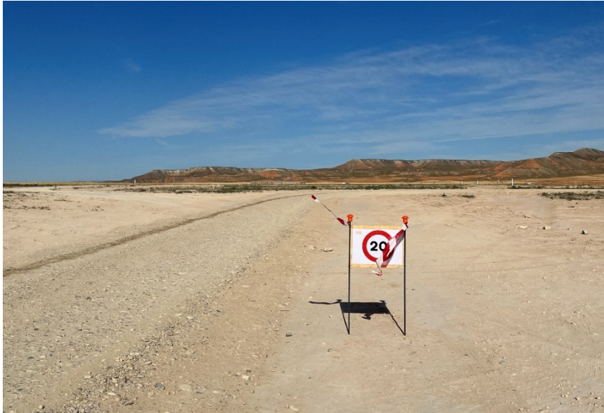
Figura 5 Señalización en obra