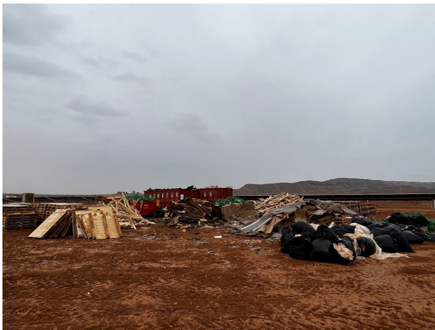
Figura 3 Acopio temporal de RNP

Así como, el punto limpio de residuos peligrosos consta de seis bidones dispuestos dentro de un contenedor marítimo impermeabilizado. En cada uno se diferencian gases en recipientes a presión, plásticos contaminados, metales contaminados, material absorbente contaminado (bolsas de basura, trapos...), tierras contaminadas (tierras con sepiolita) y aceites de motor hidráulico.