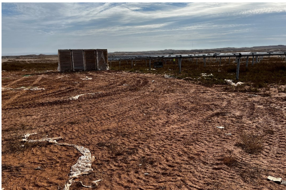
Figura 7 Restos de plásticos