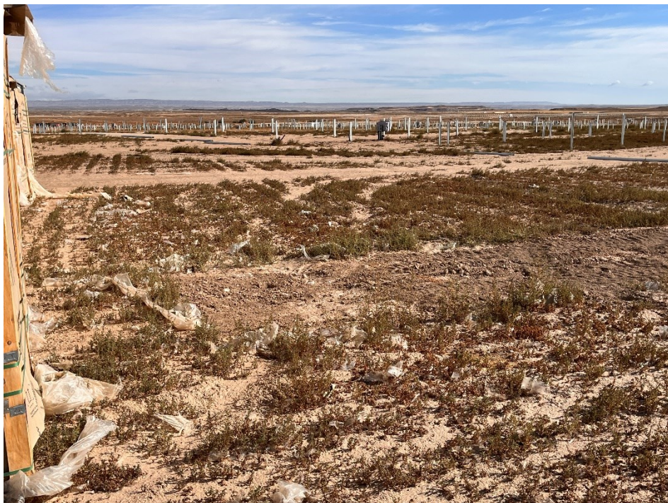
Figura 8 Restos de plásticos