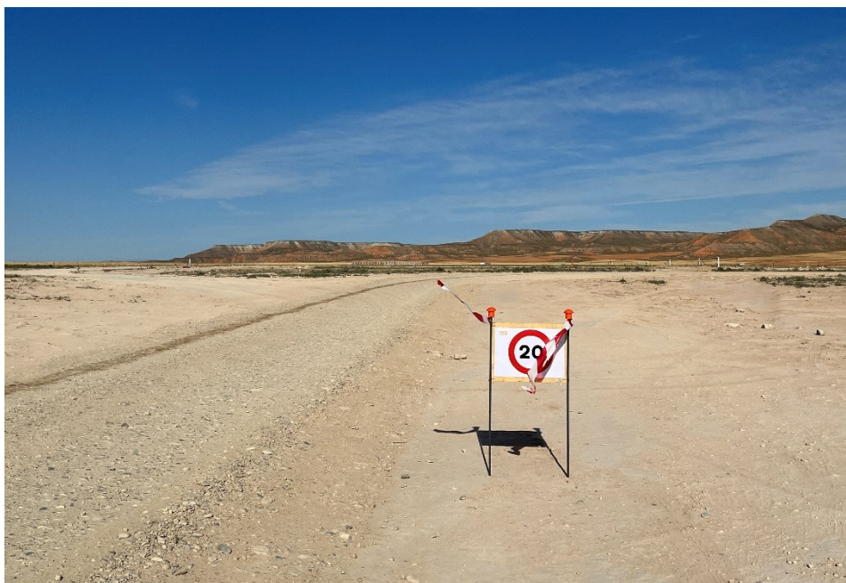
Figura 4 Señalización en obra

La obra dispone de cuba de agua y se realizan riegos con regularidad. Además, la obra cuenta con un límite de velocidad establecido de 20km/h para reducir de esta forma las emisiones de polvo.