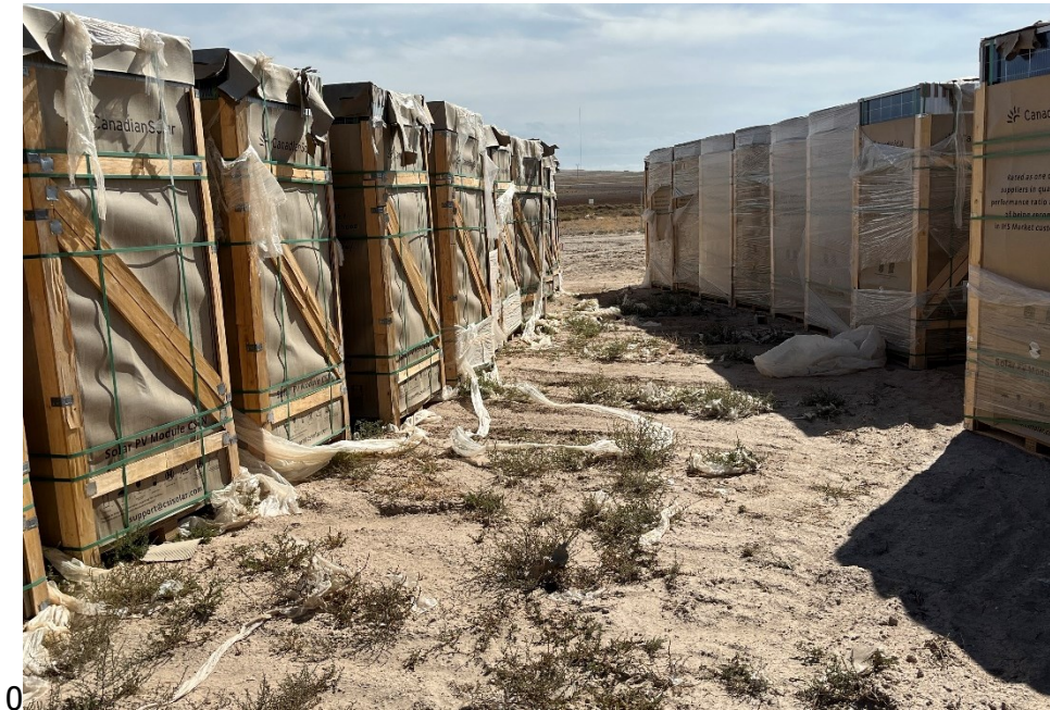
Figura 3 Zona de acopio de materia de construcción