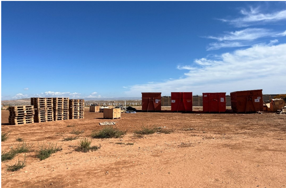
Figura 5 Punto limpio de RNP dispuesto dentro de la planta

El presente anexo se compone de un número representativo de fotografías del total realizado durante el periodo evaluado, escogidas por su relevancia y/o carácter explicativo para la correcta comprensión del presente informe.