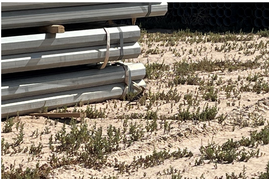
Figura 6 Abubilla (Upupa epops)