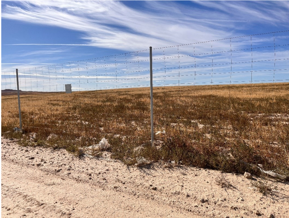
Figura 7 Restos de plásticos