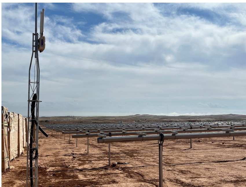
Figura 2 Montaje de los trackers

Durante este mes, han finalizado las labores de hincado y continúan con el montaje de los trackers (Figura 3).