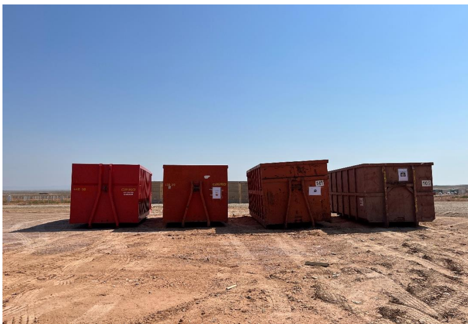
Figura 4 Zona de acopio de materia de construcción

En la planta se mantiene un nivel de orden y limpieza óptimo. El acopio logístico de materiales para la fase de construcción se ha realizado de manera correcta en las zonas destinadas para esta labor. También se ha dispuesto un punto limpio de RNP dentro de la planta (Figura 4).