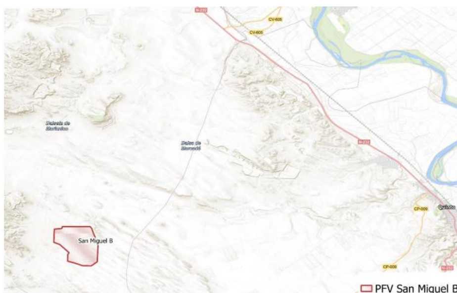
Figura 1 Localización del proyecto

El parque fotovoltaico se encuentra en las cercanías de la N-232, junto a la delimitación del término municipal de Quinto, el cual se encuentra a 8,77 km al Este del emplazamiento del proyecto. La distancia entre el parque fotovoltaico y el propio municipio de Fuentes de Ebro es de aproximadamente 9 km y está ubicado al Norte del vallado perimetral del parque. En la siguiente imagen (Figura 1) se puede ver la localización del parque fotovoltaico San Miguel B: