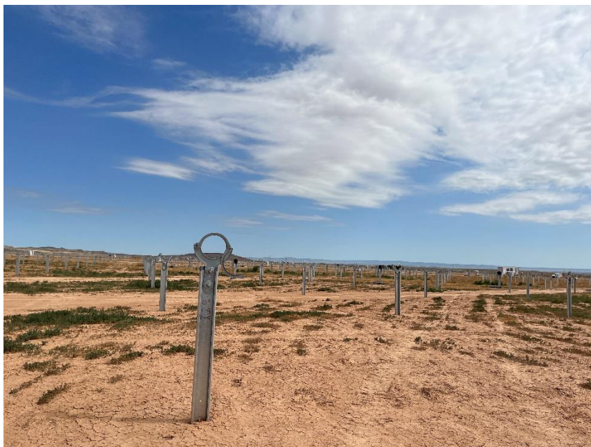
Figura 3 Montaje de los trackers