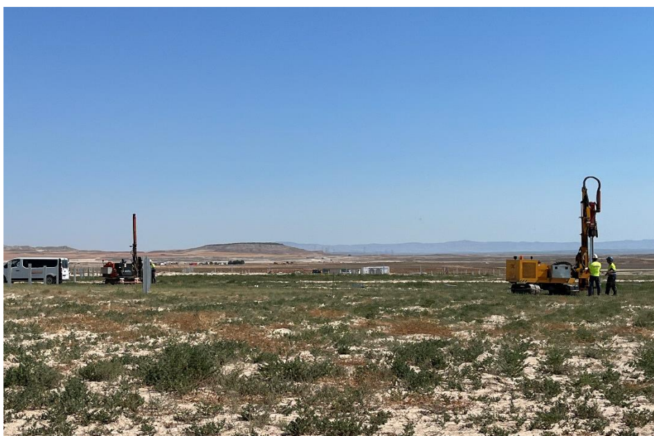
Figura 7 Labores de hincado