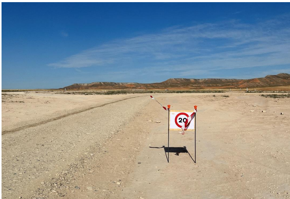
Figura 5 Señalización en obra