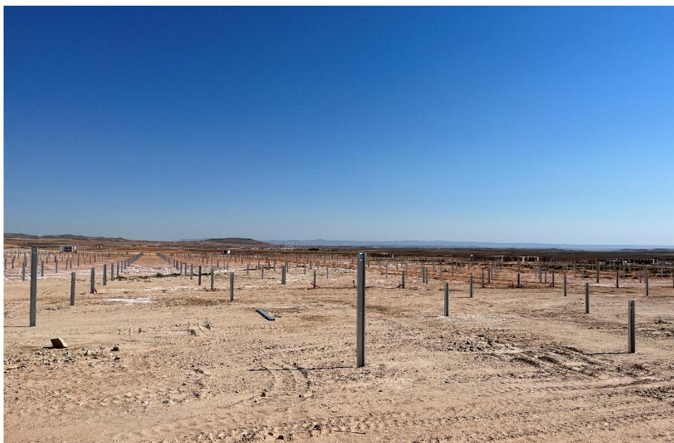
Figura 6 Hincado

El presente anexo se compone de un número representativo de fotografías del total realizado durante el periodo evaluado, escogidas por su relevancia y/o carácter explicativo para la correcta comprensión del presente informe.