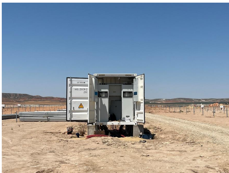
Figura 2 Conexión de los centros de transformación

Durante este mes, se ha continuado tendiendo el cable de media y baja tensión, y con la conexión de los centros de transformación y de los inversores.