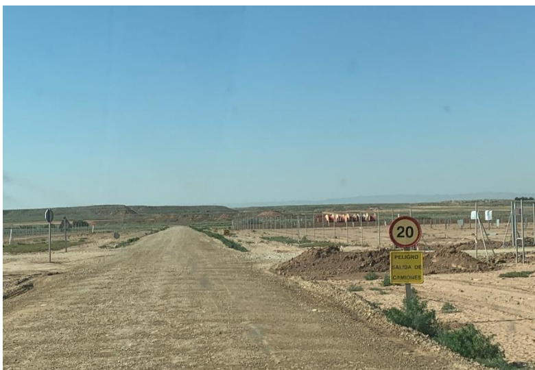
Figura 6 Señalización en obra

La obra dispone de cuba de agua y se realizan riegos con regularidad. Además, la obra cuenta con un límite de velocidad establecido de 20km/h para reducir de esta forma las emisiones de polvo.