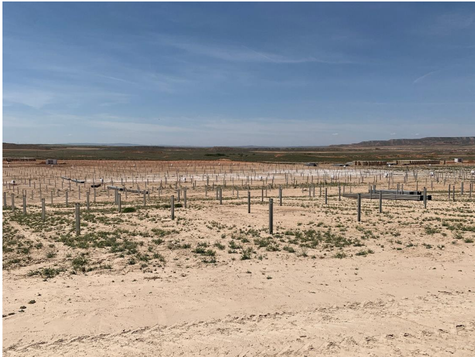
Figura 10 Hincado