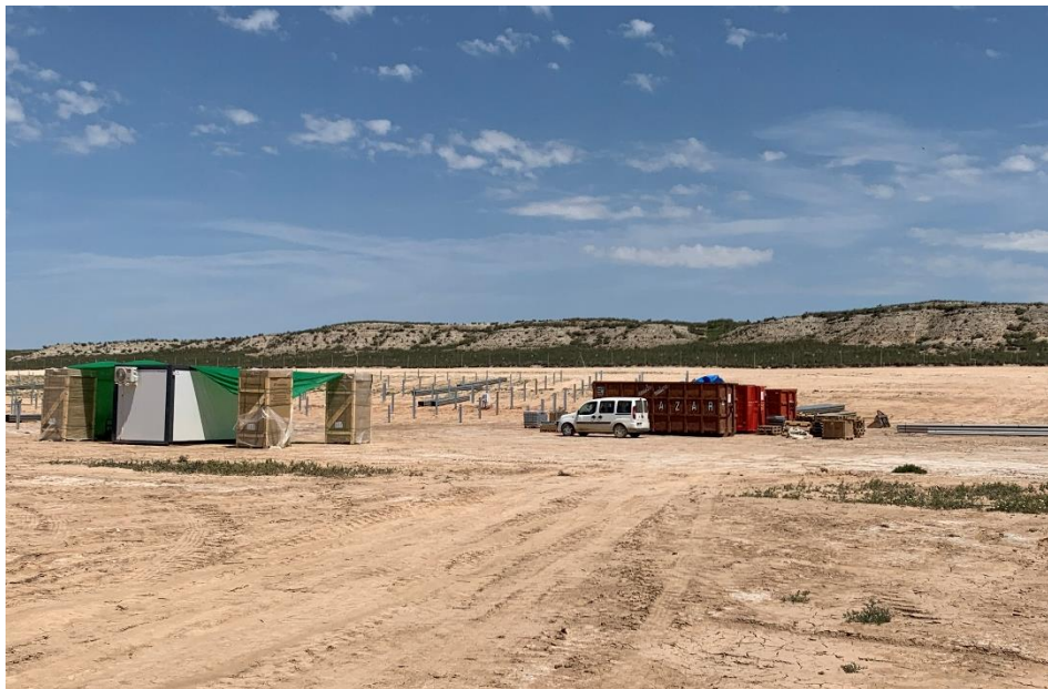
Figura 7 Punto de sombra y contenedores de RNP

El presente anexo se compone de un número representativo de fotografías del total realizado durante el periodo evaluado, escogidas por su relevancia y/o carácter explicativo para la correcta comprensión del presente informe.