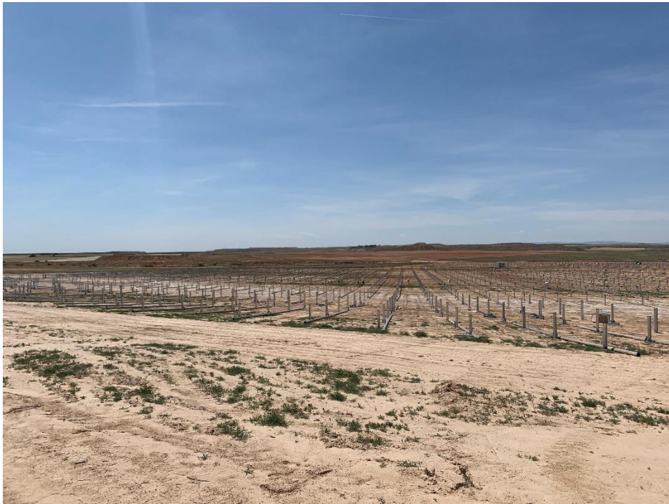
Figura 9 Hincado