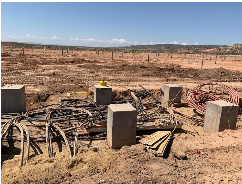
Figura 2 Cableado de la RMT

Durante este mes, se ha continuado con el tendido de cable de media y de baja tensión (Figura 2).