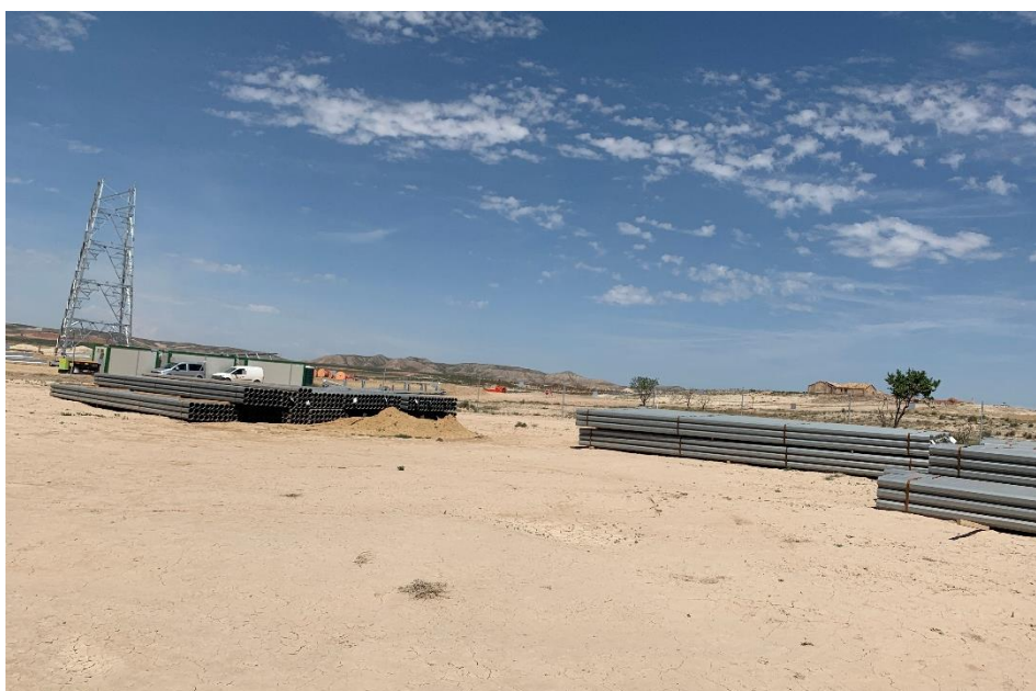
Figura 8 Zona de acopio