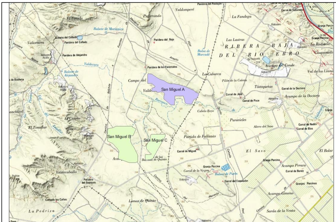
Figura 1 Localización de la PFV San Miguel A