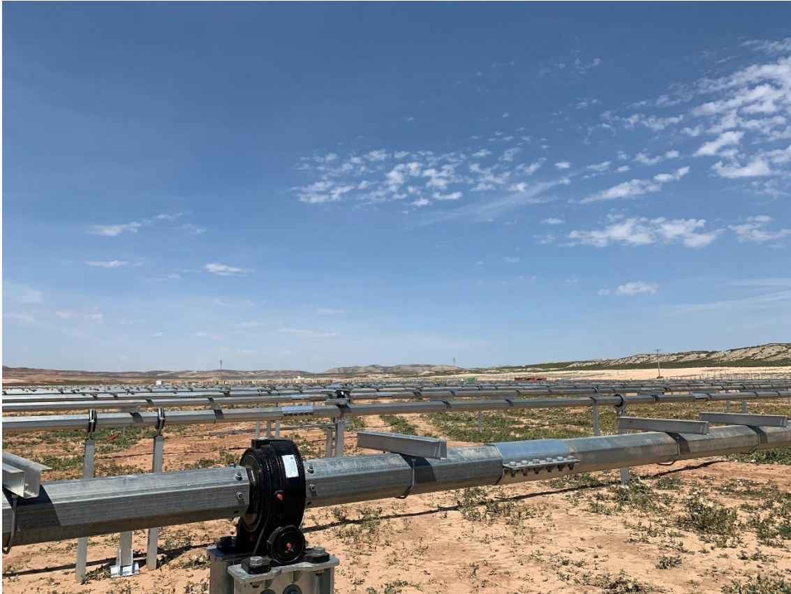
Figura 3 Montaje de los trackers