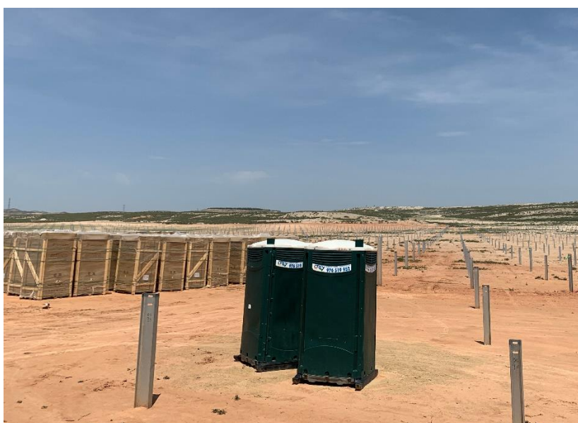
Figura 4 Baños químicos

La ejecución de los trabajos no afecta a cauces ni cursos de agua, tanto temporales como permanentes y la gestión de aguas residuales (baños químicos) se realiza correctamente.