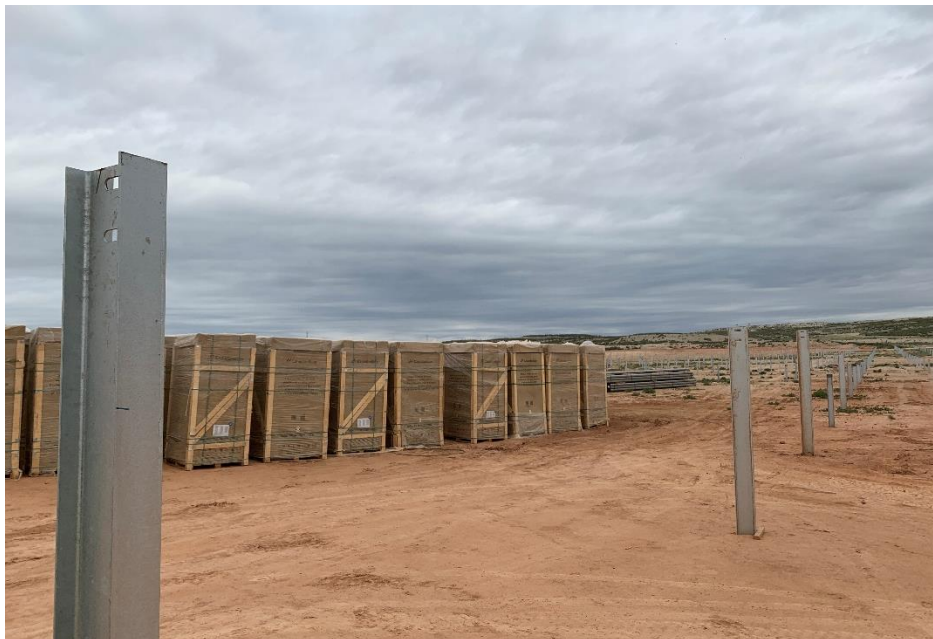
Figura 5 Zona de acopio