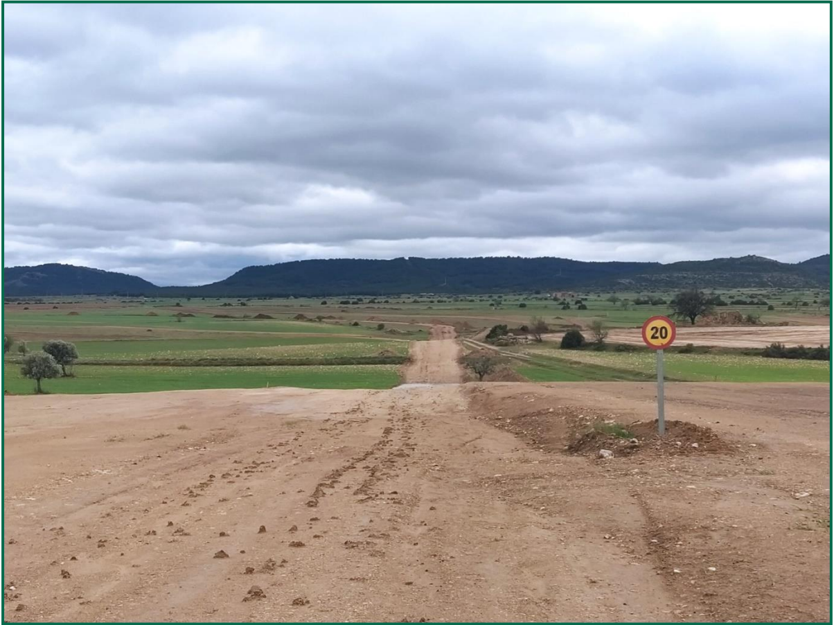
Fotografía 3. Señal de limitación de velocidad.

Durante las visitas a obra se observa cierta emisión de polvo durante los trabajos en este mes en el que el terreno se encuentra ya seco debido a las altas temperaturas y la escasez de lluvias, se realizan riegos diarios por la zona de obras para minimizar estas emisiones.