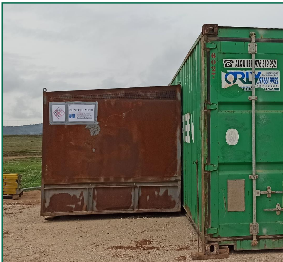
Fotografía 7. Contenedor residuos peligrosos.

Se está esperando la llegada de contenedores específicos de gran tamaño para la separación de cada tipo de residuo. Por el momento, en el exterior de las oficinas hay cubos para la separación de papel, envases y asimilable a urbana.