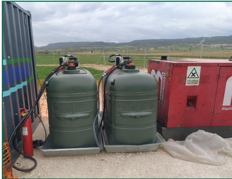
Fotografía 9. Bandejas para evitar derrames accidentales sobre el terreno.

Se ha habilitado una zona para el lavado de canaletas de hormigoneras en planta, que cuenta con un plástico para evitar infiltraciones y está señalizado y balizado. Una vez instalado todos postes de vallado ha quedado fuera de uso y va a ser retirada.