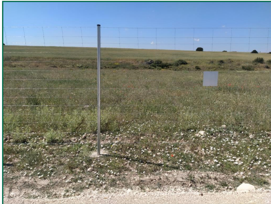
Fotografía 2. Vallado perimetral