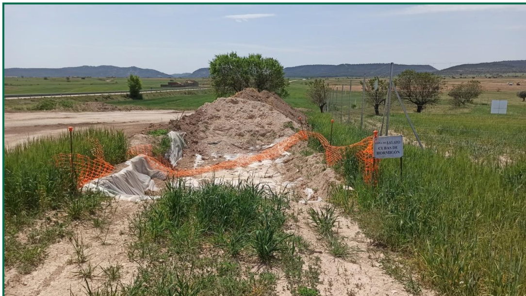
Fotografía 10. Zona para lavado de hormigoneras.

Se ha habilitado una zona para el lavado de canaletas de hormigoneras en planta, que cuenta con un plástico para evitar infiltraciones y está señalizado y balizado. Una vez instalado todos postes de vallado ha quedado fuera de uso y va a ser retirada.