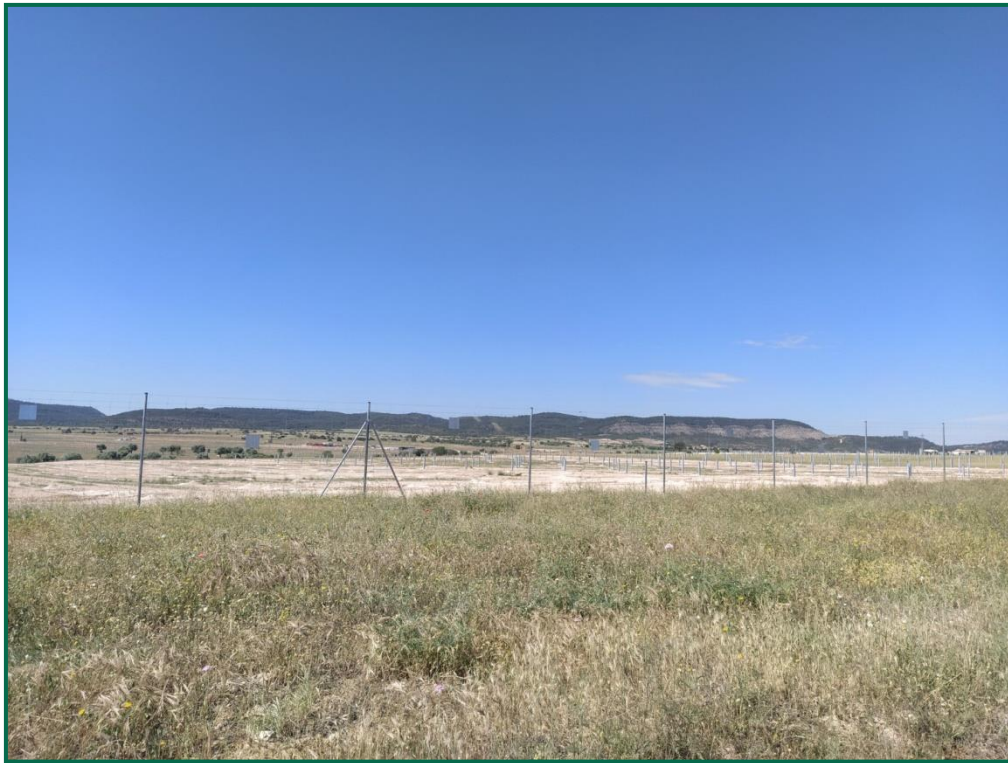
Fotografía 6. Vallado perimetral.

Se han comenzado a colocar majanos de piedra en la zona sur de la planta utilizando la piedra extraída en el movimiento de tierras, ya están instalados la mayoría de los previstos en el perímetro, los interiores se completarán en fases posteriores.