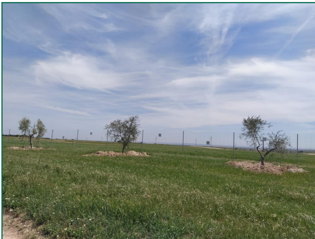
Fotografía 5. Olivos trasplantados.

de este y en la zona junto a la carretera, se han evitado zonas de vía pecuaria y aquellas zonas de menor cota propensas a inundaciones por ser menos aptas para este tipo de árbol.