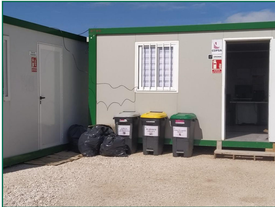
Fotografía 8. Contenedores en el exterior de las oficinas.

La empresa encargada de realizar los trabajos COPSА EMPRESA CONSTRUCTORA, S.A., con NIF A09028184 se encuentra dada de alta en el Registro de Pequeños Productores de Residuos Peligrosos de la Comunidad Autónoma de Aragón con número de inscripción AR/PP – 14412 .