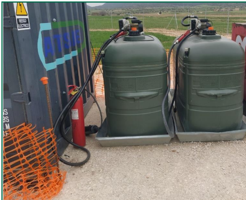
Fotografía 13. Extintor junto a contenedores de combustible.

Se dispone de extintores tanto en la zona de casetas como en la zona de obras.