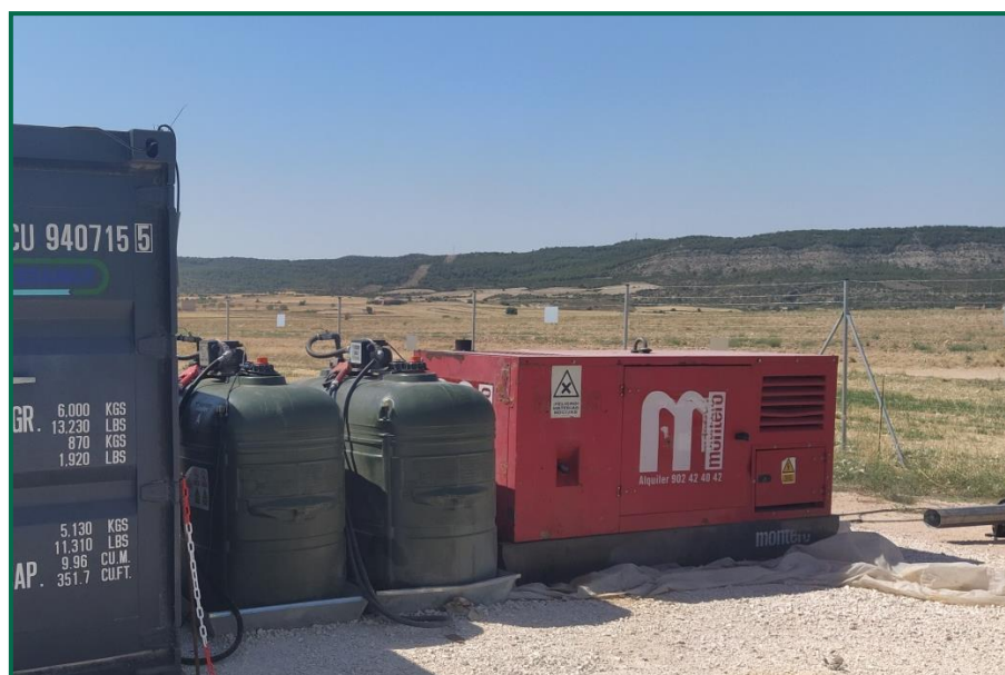
Fotografía 12. Bandejas para evitar derrames accidentales sobre el terreno.

En las visitas a obra realizadas se comprueba la utilización de bandejas de plástico debajo de los grupos electrógenos y envases de combustible para evitar derrames por pérdidas accidentales sobre el terreno.