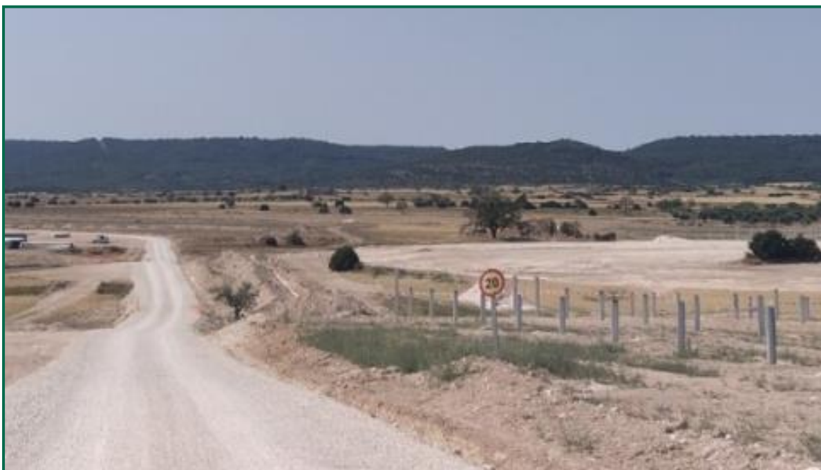
Fotografía 3. Señal de limitación de velocidad.

Durante las visitas a obra se observa cierta emisión de polvo durante los trabajos en este més, pero esta no es muy acusada debido a que se han ido produciendo tormentas, que han humedecido el terreno y a que ya e han concluidolos movimientos de tierra.