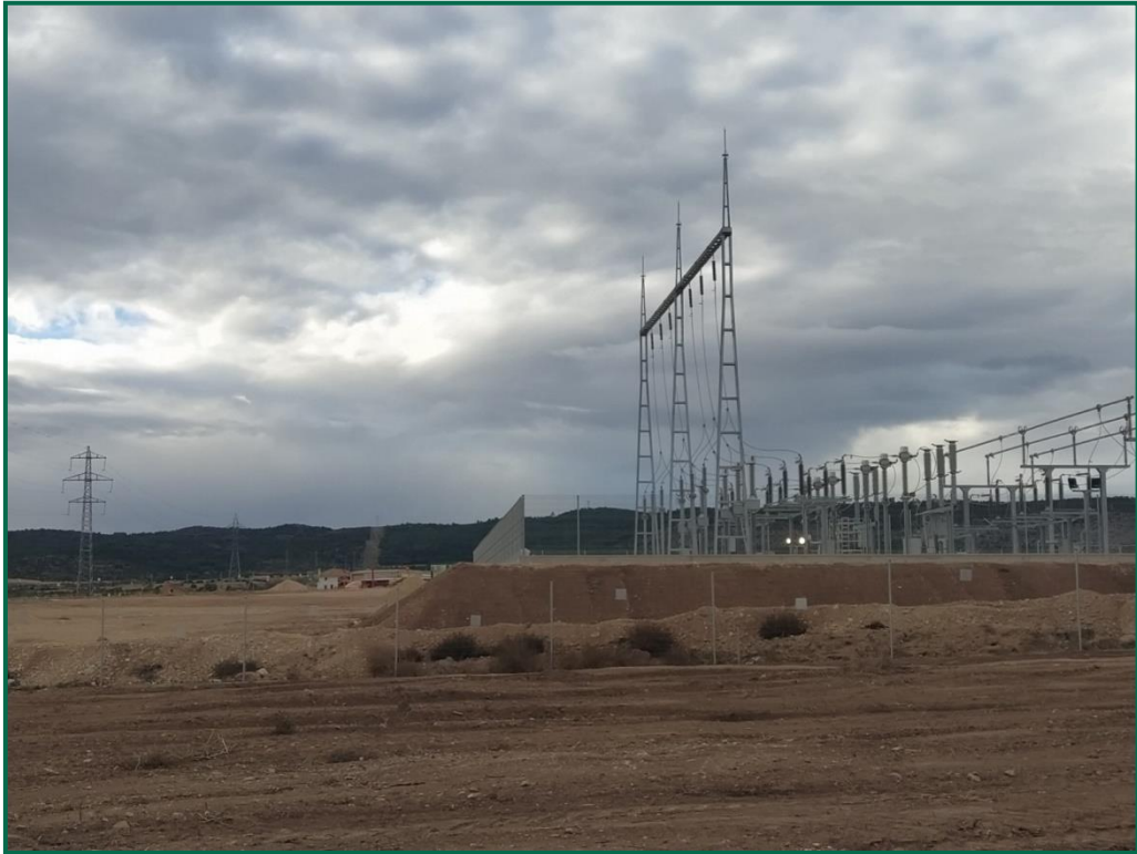
Fotografía 4. Tierra vegetal sobre talud.