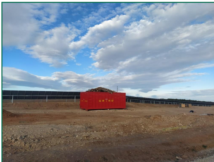
Fotografía 10. Contenedores residuos inertes

Se han instalado dos contenedores de gran tamaño para plásticos, y para cartón, durante este mes se han realizado múltiples recogidas, tanto de estos contenedores, como de camiones que han realizado retiradas directamente de forma continua. En el exterior de las oficinas hay cubos para la separación de papel, envases y asimilable a urbana.