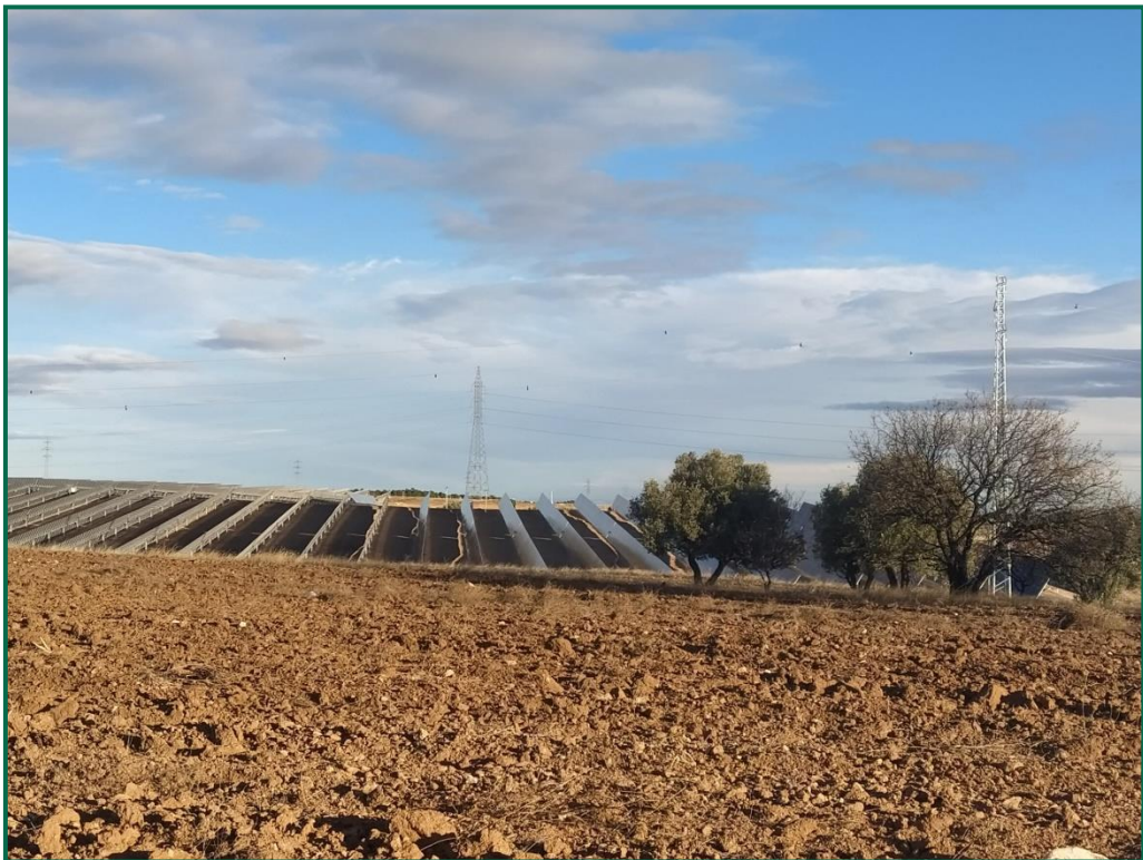
Fotografía 5. Zonas descompactadas.