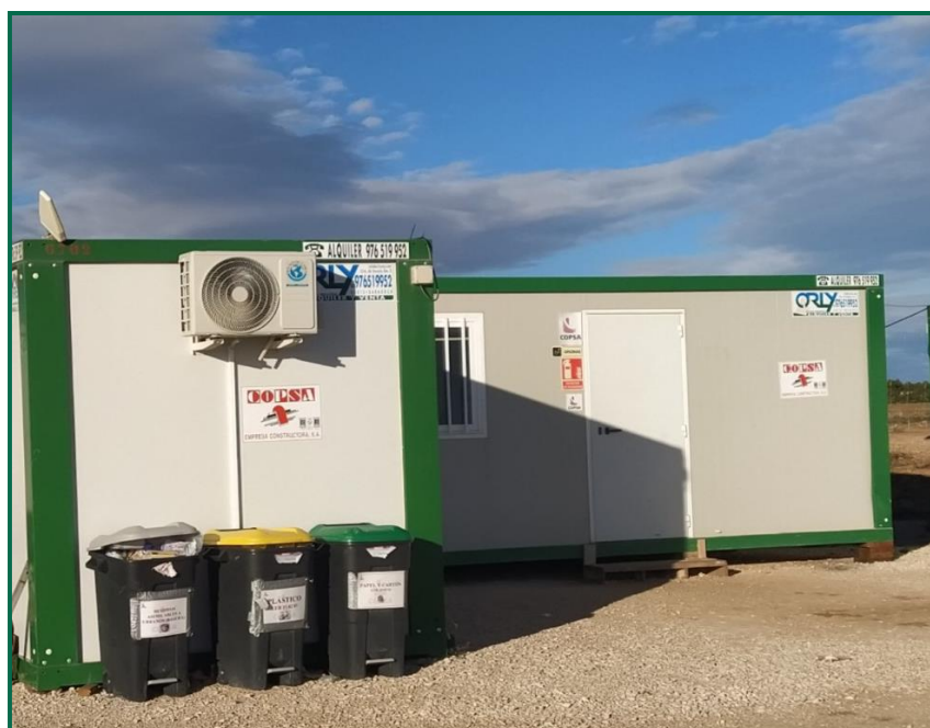
Fotografía 11. Cubos en el exterior de las oficinas.

Se han instalado dos contenedores de gran tamaño para plásticos, y para cartón, durante este mes se han realizado múltiples recogidas, tanto de estos contenedores, como de camiones que han realizado retiradas directamente de forma continua. En el exterior de las oficinas hay cubos para la separación de papel, envases y asimilable a urbana.