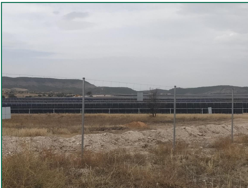
Fotografía 7. Vallado perimetral con placas anticolidión.

Se han comenzado a colocar majanos de piedra en la zona sur de la planta utilizando la piedra extraída en el movimiento de tierras, ya están instalados la mayoría de los previstos en el perímetro, los interiores se completarán en fases posteriores.