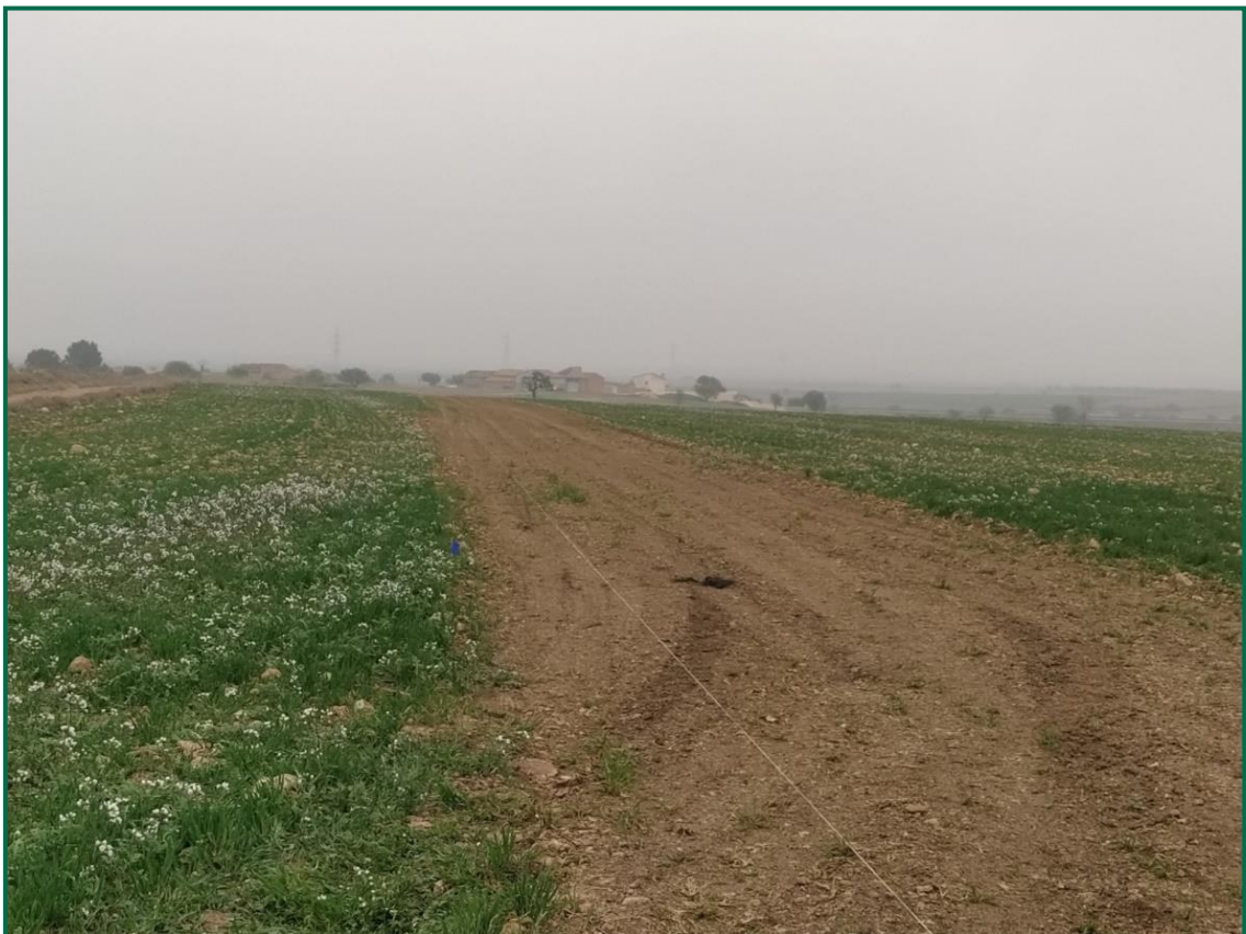
Fotografía 1. Jalonamiento previo.

No se realiza el balizamiento de todo el perímetro de la obra ya que se generaría una gran cantidad de residuos de malla de obra o cinta que tiende a romperse y dispersarse por toda la zona. Sí se realiza un jalonamiento del perímetro mediante banderines. La Dirección Ambiental realiza un control visual continuado para comprobar que no se sobrepasan los límites de la zona de ocupación. Actualmente se ha instalado el vallado perimetral