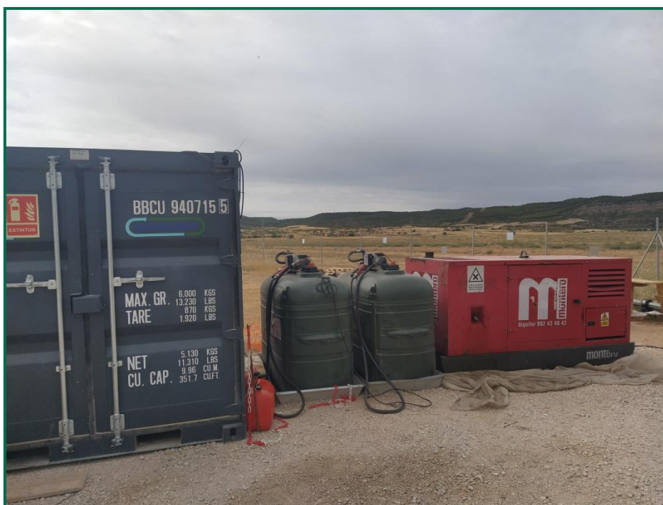
Fotografía 11. Bandejas para evitar derrames accidentales sobre el terreno.

En las visitas a obra realizadas se comprueba la utilización de bandejas de plástico debajo de los grupos electrógenos y envases de combustible para evitar derrames por pérdidas accidentales sobre el terreno.