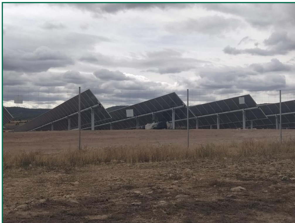
Fotografía 6. Vallado perimetral con placas anticolisión.

Se han comenzado a colocar majanos de piedra en la zona sur de la planta utilizando la piedra extraída en el movimiento de tierras, ya están instalados la mayoría de los previstos en el perímetro, los interiores se completarán en fases posteriores.