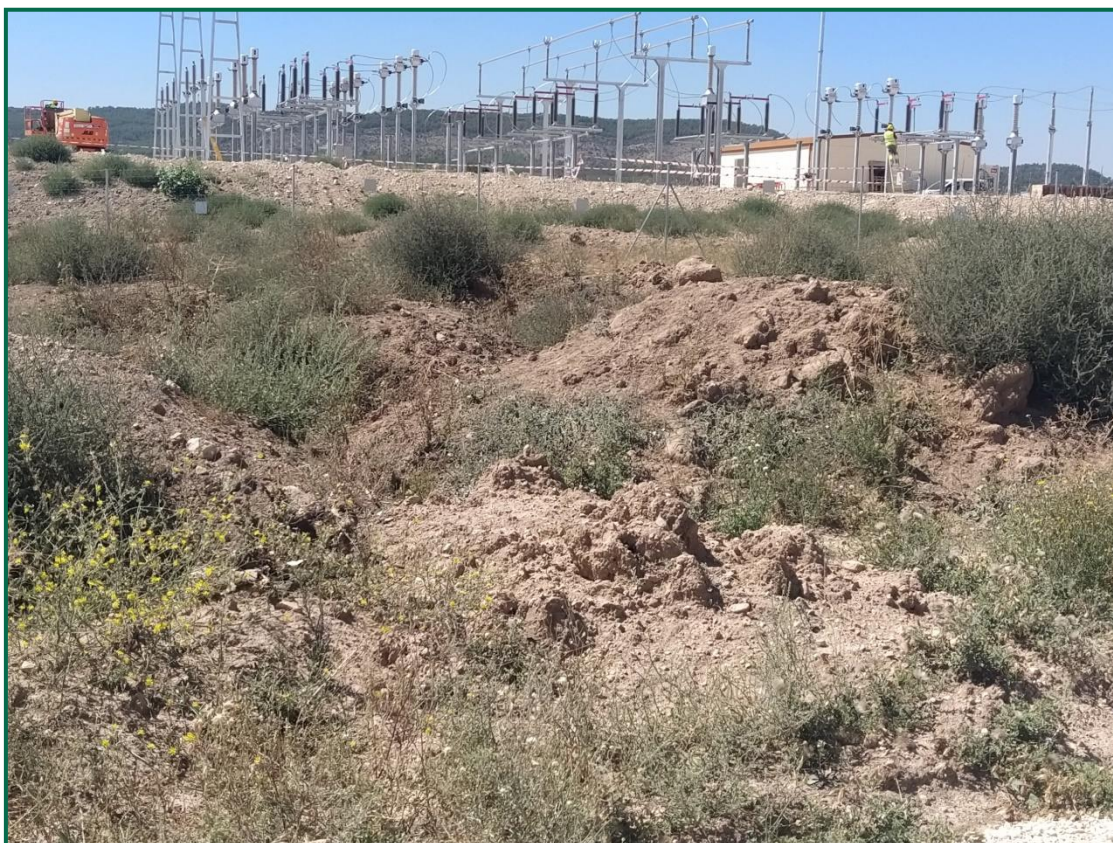
Fotografía 4. Caballones de tierra vegetal.