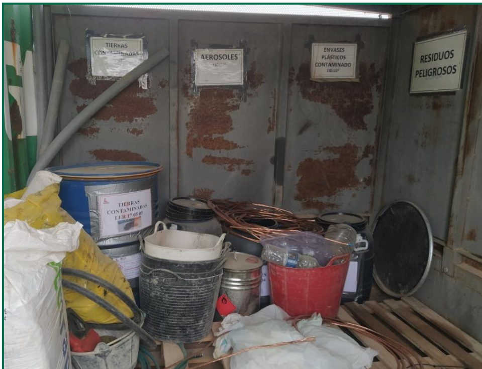
Fotografía 8. Contenedor residuos peligrosos.