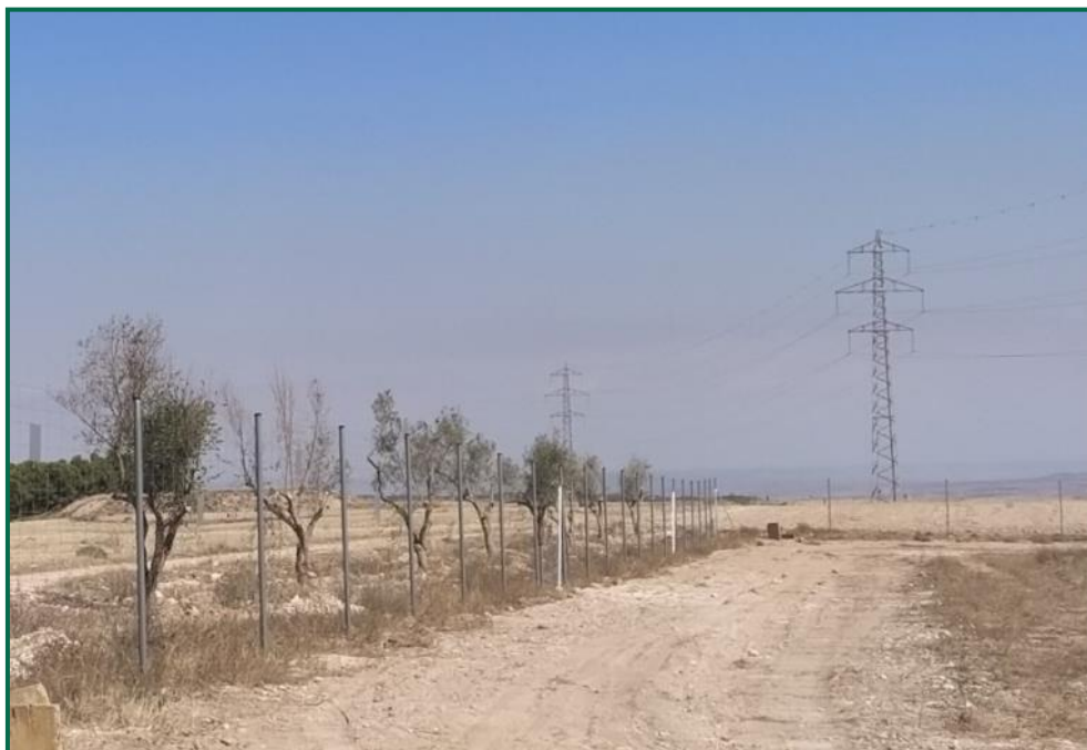
Fotografía 5. Olivos trasplantados.

cm aproximadamente, por considerarlos más aptos para el trasplante. Finalmente se han trasplantado 219 ejemplares repartidos por el vallado, con mayor concentración en la mitad norte de este y en la zona junto a la carretera, se han evitado zonas de vía pecuaria y aquellas zonas de menor cota propensas a inundaciones por ser menos aptas para este tipo de árbol.