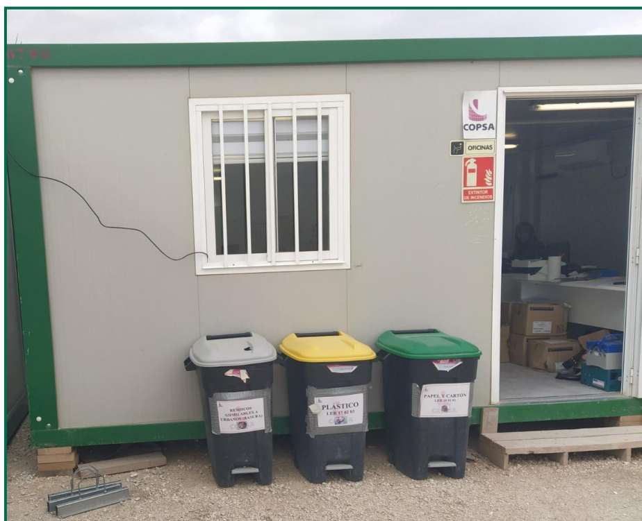
Fotografía 10. Cubos en el exterior de las oficinas.

Se han instalado dos contenedores de gran tamaño para plásticos, y otro para cartón. En el exterior de las oficinas hay cubos para la separación de papel, envases y asimilable a urbana.