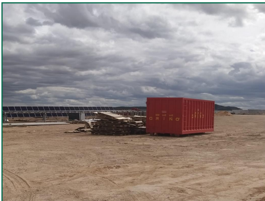
Fotografía 9. Contenedores residuos inertes

Se han instalado dos contenedores de gran tamaño para plásticos, y otro para cartón. En el exterior de las oficinas hay cubos para la separación de papel, envases y asimilable a urbana.