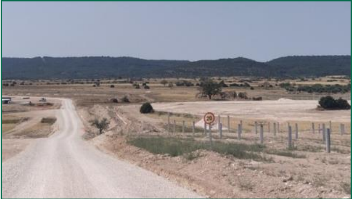
Fotografía 3. Señal de limitación de velocidad.

Durante las visitas a obra se observa cierta emisión de polvo durante los trabajos en este més, pero esta no es muy acusada debido a que se han ido produciendo tormentas, que han humedecido el terreno y a que ya e han concluidolos movimientos de tierra.