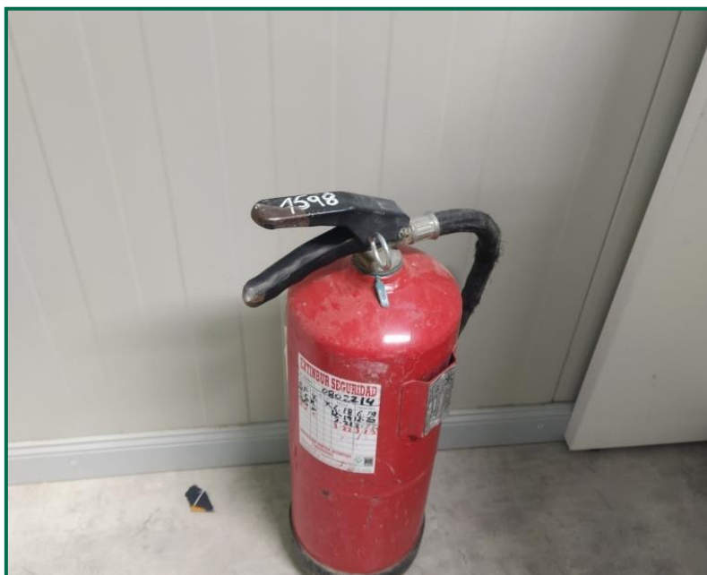
Fotografía 13. Extintor en el interior de las oficinas.