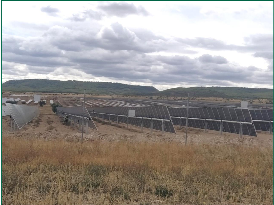
Fotografía 2. Vallado perimetral