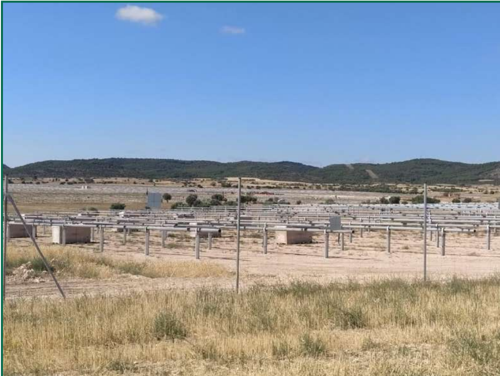
Fotografía 6. Vallado perimetral.

Se han comenzado a colocar majanos de piedra en la zona sur de la planta utilizando la piedra extraída en el movimiento de tierras, ya están instalados la mayoría de los previstos en el perímetro, los interiores se completarán en fases posteriores.