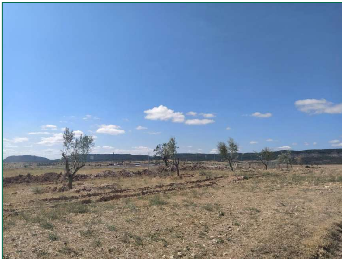
Fotografía 5. Olivos trasplantados.

cm aproximadamente, por considerarlos más aptos para el trasplante. Finalmente se han trasplantado 219 ejemplares repartidos por el vallado, con mayor concentración en la mitad norte de este y en la zona junto a la carretera, se han evitado zonas de vía pecuaria y aquellas zonas de menor cota propensas a inundaciones por ser menos aptas para este tipo de árbol.