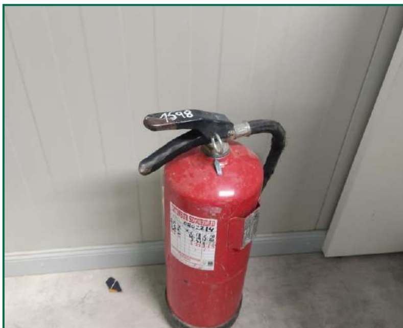
Fotografía 13. Extintor en el interior de las oficinas.