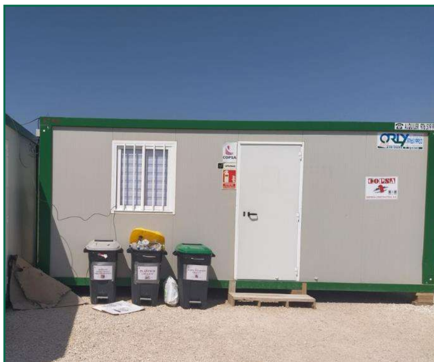
Fotografía 10. Contenedores en el exterior de las oficinas.

Se han instalado dos contenedores de gran tamaño para plásticos, y otro para cartón. En el exterior de las oficinas hay cubos para la separación de papel, envases y asimilable a urbana.