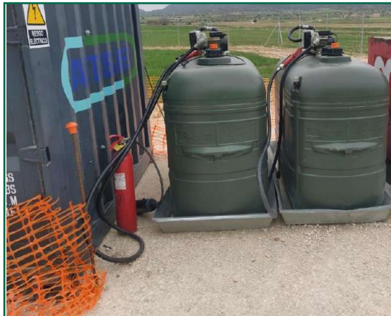
Fotografía 12. Extintor junto a contenedores de combustible.

Se dispone de extintores tanto en la zona de casetas como en la zona de obras.