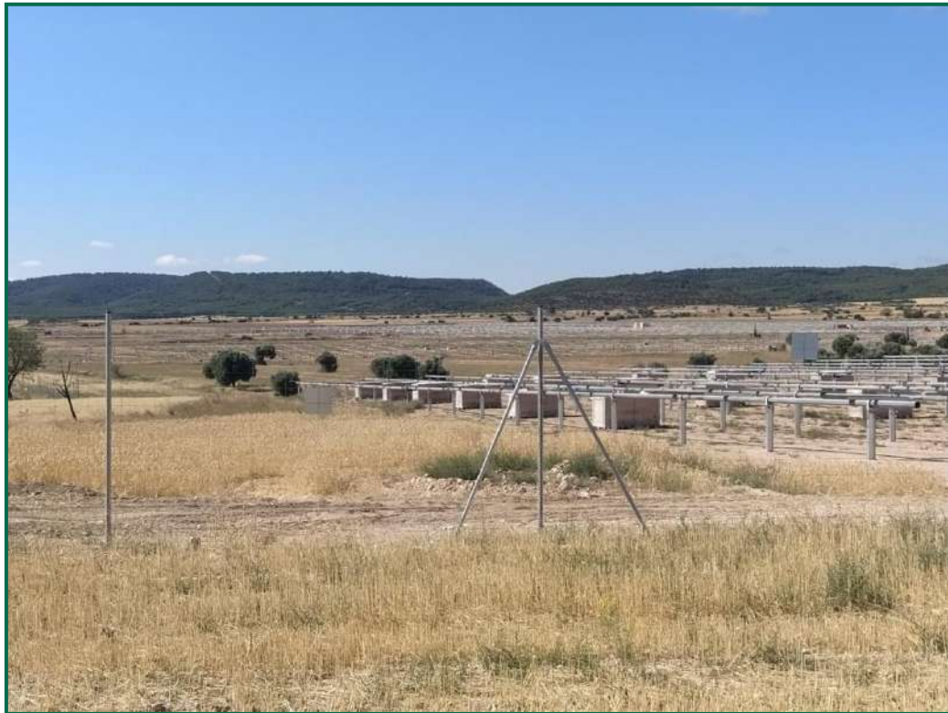
Fotografía 2. Vallado perimetral