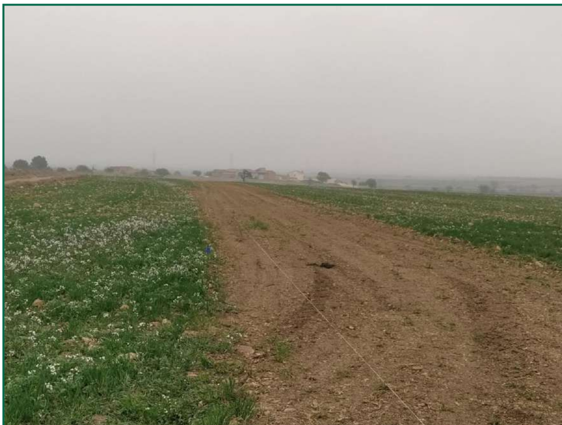
Fotografía 1. Jalonamiento previo.

No se realiza el balizamiento de todo el perímetro de la obra ya que se generaría una gran cantidad de residuos de malla de obra o cinta que tiende a romperse y dispersarse por toda la zona. Sí se realiza un jalonamiento del perímetro mediante banderines. La Dirección Ambiental realiza un control visual continuado para comprobar que no se sobrepasan los límites de la zona de ocupación. Actualmente se ha instalado el vallado perimetral