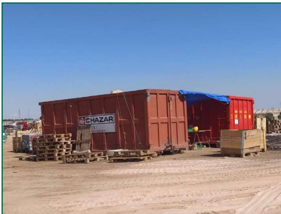
Fotografía 9. Contenedores residuos inertes

Se han instalado dos contenedores de gran tamaño para plásticos, y otro para cartón. En el exterior de las oficinas hay cubos para la separación de papel, envases y asimilable a urbana.