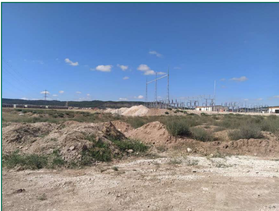
Fotografía 4. Caballones de tierra vegetal.