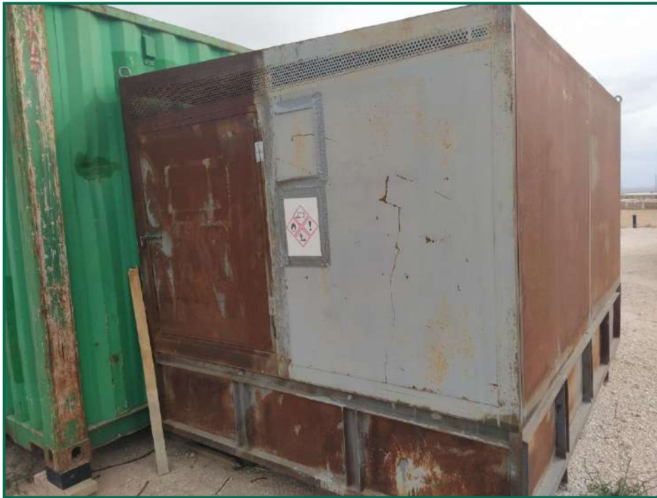
Fotografía 7. Contenedor residuos peligrosos.