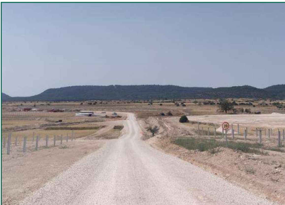
Fotografía 3. Señal de limitación de velocidad.

Durante las visitas a obra se observa cierta emisión de polvo durante los trabajos en este mes, pero esta no es muy acusada debido a que se han ido produciendo tormentas, que han humedecido el terreno.