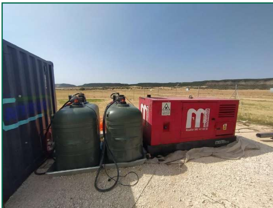
Fotografía 11. Bandejas para evitar derrames accidentales sobre el terreno.

En las visitas a obra realizadas se comprueba la utilización de bandejas de plástico debajo de los grupos electrógenos y envases de combustible para evitar derrames por pérdidas accidentales sobre el terreno.