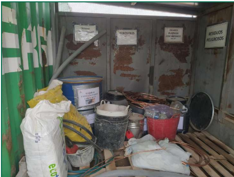
Fotografía 8. Contenedor residuos peligrosos.