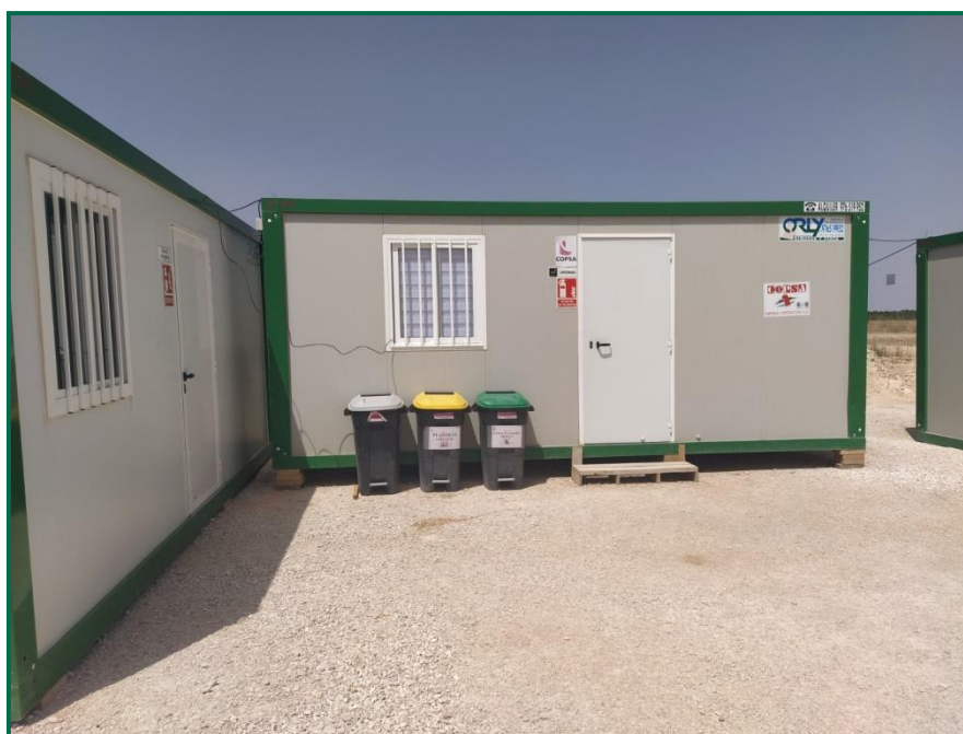
Fotografía 9. Contenedores en el exterior de las oficinas.

La madera utilizada en el transporte de las hincas, únicos elementos de la estructura instalados hasta el momento, se reutiliza para el almacenamiento de estas, y la sobrante se acopia.