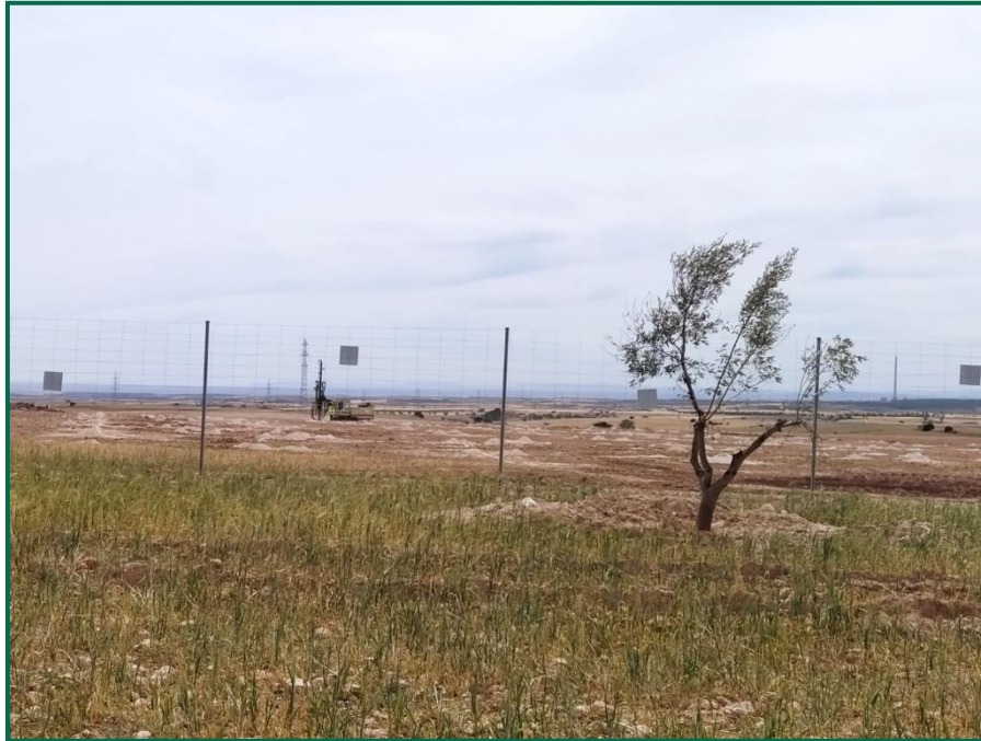
Fotografía 2. Vallado perimetral