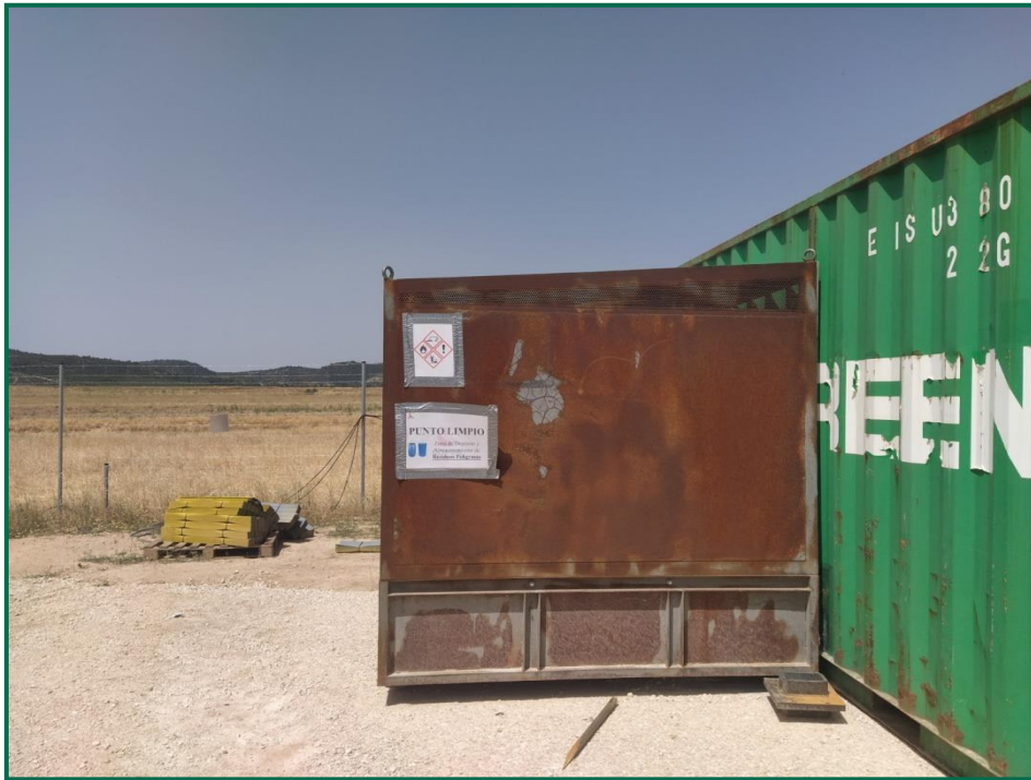
Fotografía 7. Contenedor residuos peligrosos.