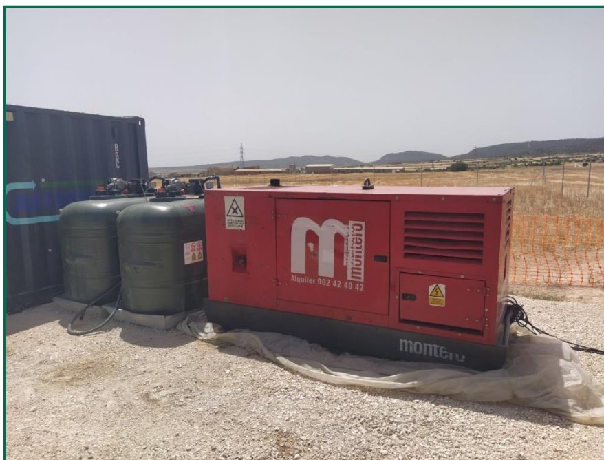
Fotografía 10. Bandejas para evitar derrames accidentales sobre el terreno.