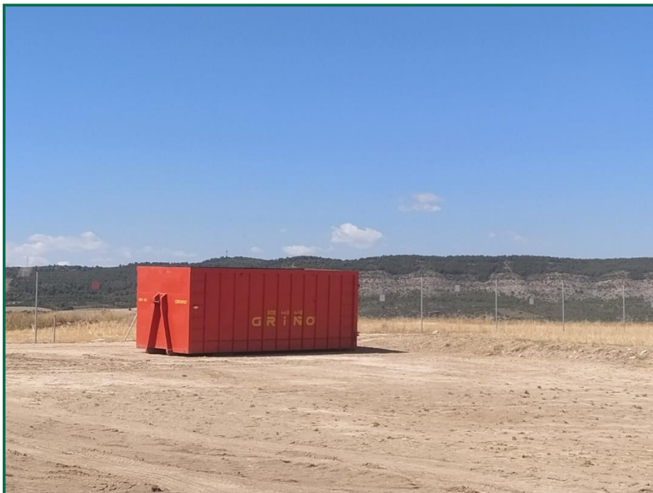
Fotografía 8. Contenedor residuos peligrosos.