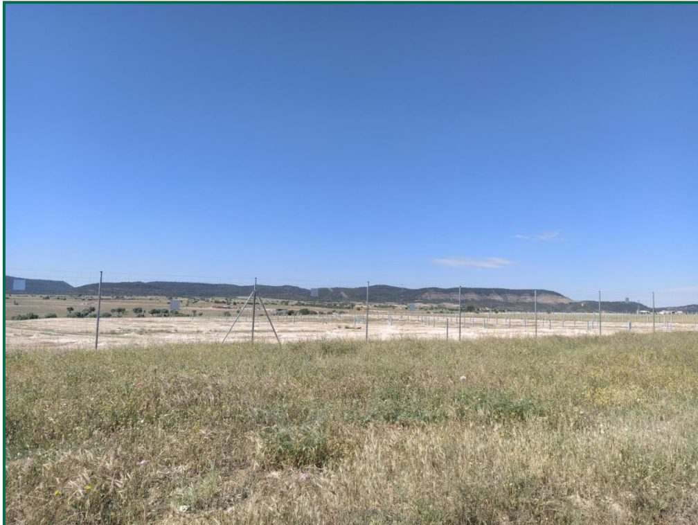
Fotografía 6. Vallado perimetral.

Se han comenzado a colocar majanos de piedra en la zona sur de la planta utilizando la piedra extraída en el movimiento de tierras, ya están instalados la mayoría de los previstos en el perímetro, los interiores se completarán en fases posteriores.