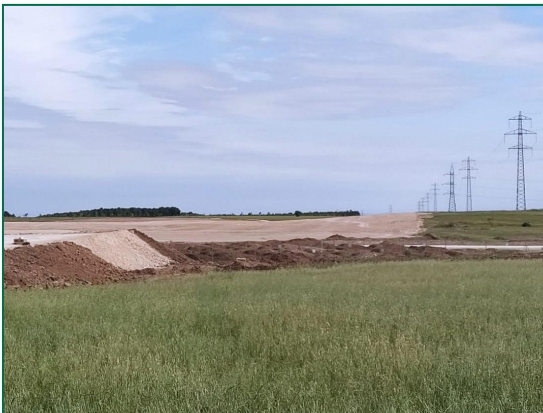
Fotografía 4. Caballones de tierra vegetal.