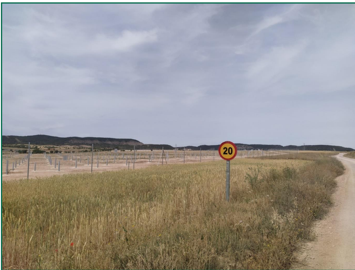
Fotografía 3. Señal de limitación de velocidad.

Durante las visitas a obra se observa cierta emisión de polvo durante los trabajos en este mes en el que el terreno se encuentra ya seco debido a las altas temperaturas y la escasez de lluvias, se realizan riegos diarios por la zona de obras para minimizar estas emisiones.