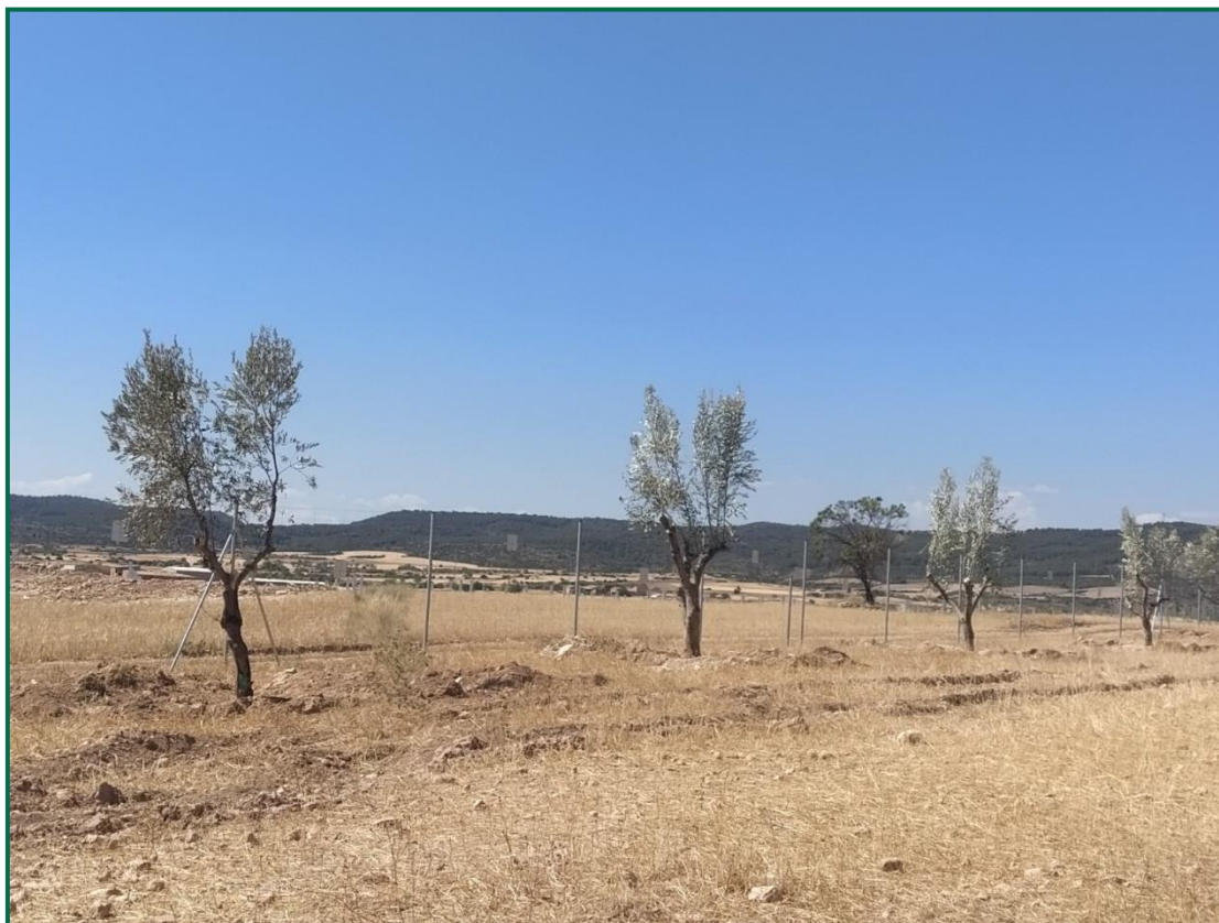
Fotografía 5. Olivos trasplantados.

cm aproximadamente, por considerarlos más aptos para el trasplante. Finalmente se han trasplantado 219 ejemplares repartidos por el vallado, con mayor concentración en la mitad norte de este y en la zona junto a la carretera, se han evitado zonas de vía pecuaria y aquellas zonas de menor cota propensas a inundaciones por ser menos aptas para este tipo de árbol.