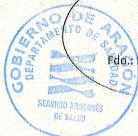
Fdo.: Eva Domingo Gimeno