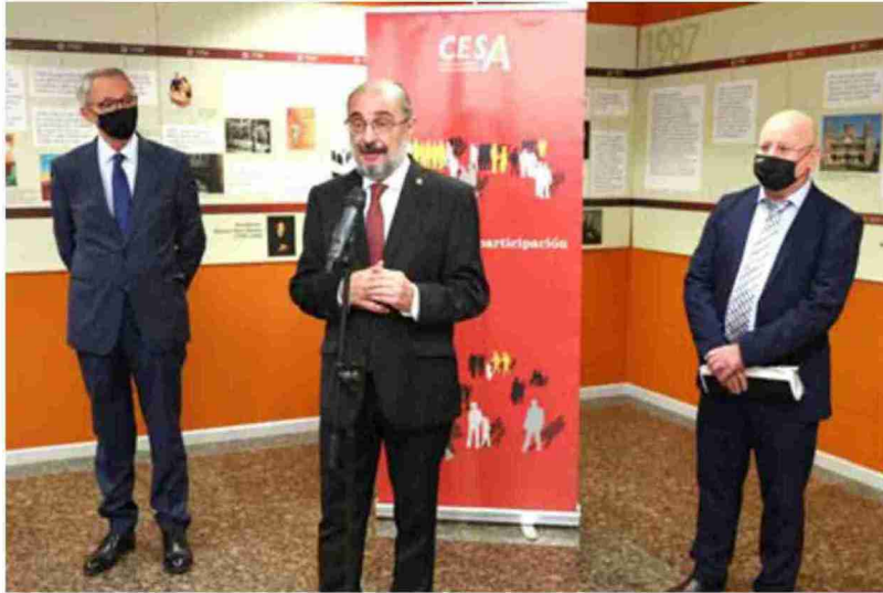
El diálogo social es fundamental para las buenas perspectivas económicas de Aragón