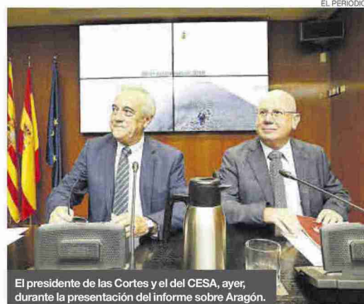
El presidente de las Cortes y el del CESA, ayer, durante la presentación del informe sobre Aragón.

tante potencial de crecimiento en términos de logística» ya se conocía en los años 50 del siglo pasado. «En los próximos años, en esta comunidad veremos inversiones importantes porque su característica logística en el ámbito español es muy potente», aseveró.