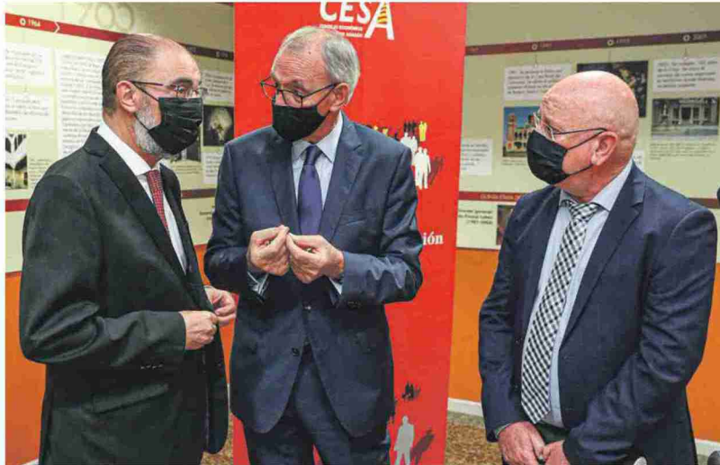
El presidente Lambán clausuró la conferencia en la que se abordó la importancia del diálogo social para la política económica. G.A