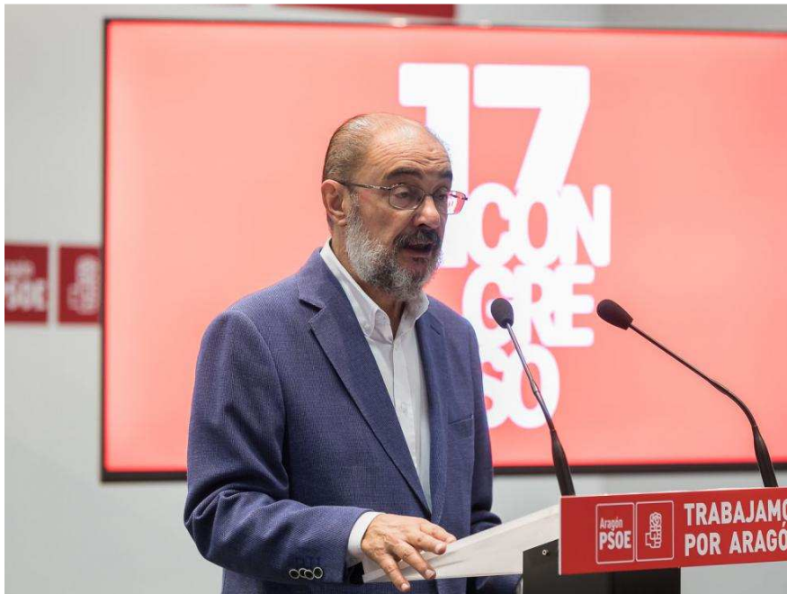
Javier Lambán en