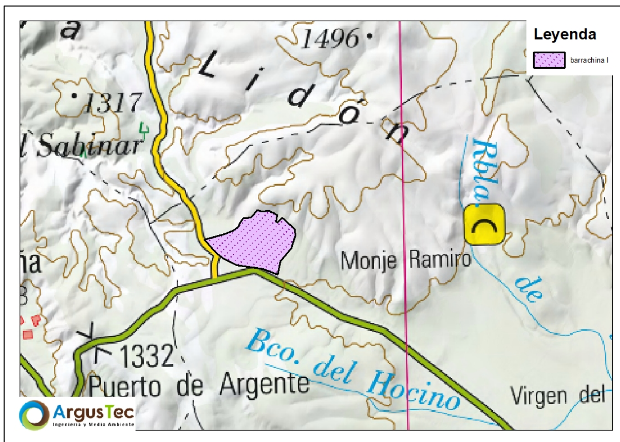
Figura 1. Mapa de localización de la planta fotovoltaica (polígono).

En la siguiente imagen se muestra la localización de las infraestructuras proyectadas.