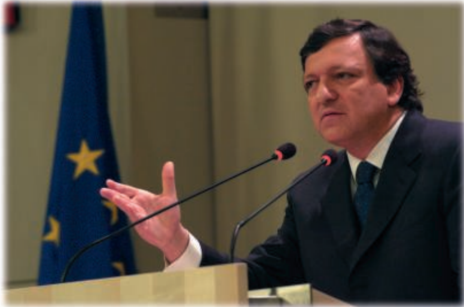
José Manuel Barroso fue elegido Presidente de la Comisión Europea en 2004.

bunal de Justicia de las Comunidades Europeas, que puede imponer sanciones. Las sentencias del Tribunal son de obligado cumplimiento para los Estados miembros y las instituciones de la UE.