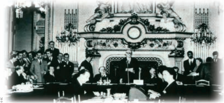
Las ideas que desembocaron en la Unión Europea fueron presentadas por primera vez el 9 de mayo de 1950 por el Ministro de Asuntos Exteriores de Francia, Robert Schuman. Por eso, el 9 de mayo de cada año se celebra el «Día de Europa».

Los Tratados son la base de todo lo que hace la Unión Europea. Los Tratados se han modificado con motivo de cada adhesión de nuevos Estados miembros y, además, también se han ido modificando para reformar las instituciones de la UE y darles nuevas áreas de responsabilidad. Las revisiones y modificaciones de los Tratados se realizan mediante una conferencia especial de los Gobiernos nacionales de la UE («Conferencia Intergubernamental» o CIG), que ha tenido lugar tres veces en los últimos veinte años: