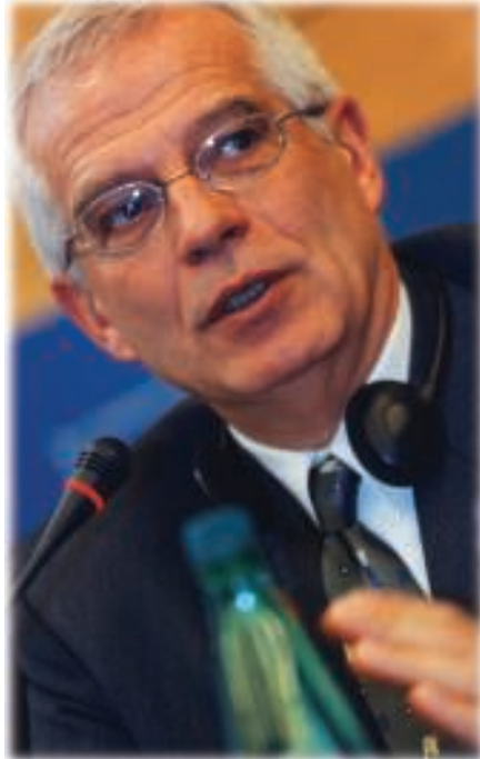
Josep Borrell Fontelles fue elegido Presidente del Parlamento Europeo en 2004.