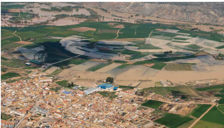
Imagen aérea de Torres de Berrellén durante la avenida 2018

El municipio de Torres de Berrellén se ubica en la margen derecha del río Ebro. El núcleo urbano está ubicado a una cota considerablemente superior que el resto de la zona noreste. En cuanto a Sobradiel, la zona urbana linda con una terraza más baja que tiende a acumular las aguas desbordadas. En este caso la localidad está protegida de desbordamientos provenientes desde aguas arriba por un camino con una acequia adosada que se encuentra elevada por encima del terreno.