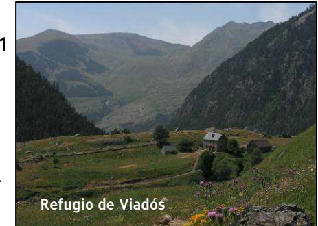
Refugio de Viadós

El inicio del recorrido coincide con el GR 11 hasta que llegamos al refugio de Viadós, a partir de aquí tomamos el camino que hacia el norte parte en dirección al pico Bachimala. A unos 20 min encontramos un desvío a mano izquierda por el cual continuaremos. En descenso transitamos hacia el noroeste hasta encontrarnos con los llanos de Tabernés donde se sitúa este refugio no guardado.