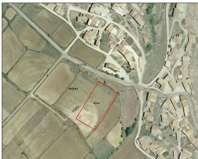
Mapa de planeamiento y ortofotografía de la zona propuesta como suelo urbanizable delimitado (SUZ-01).

La configuración actual del núcleo urbano de Cañada de Benatanduz muestra el control ejercido por el relieve del entorno en su desarrollo. La presencia de fuertes desniveles al este y norte de la localidad hacen que los futuros posibles desarrollos se tengan que localizar en la parte suroeste de la misma