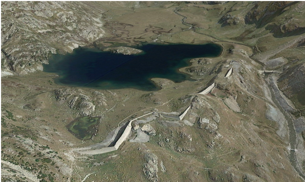
Ortoimagen y Modelo Digital de Elevación de la presa del ibón de Campoplano.