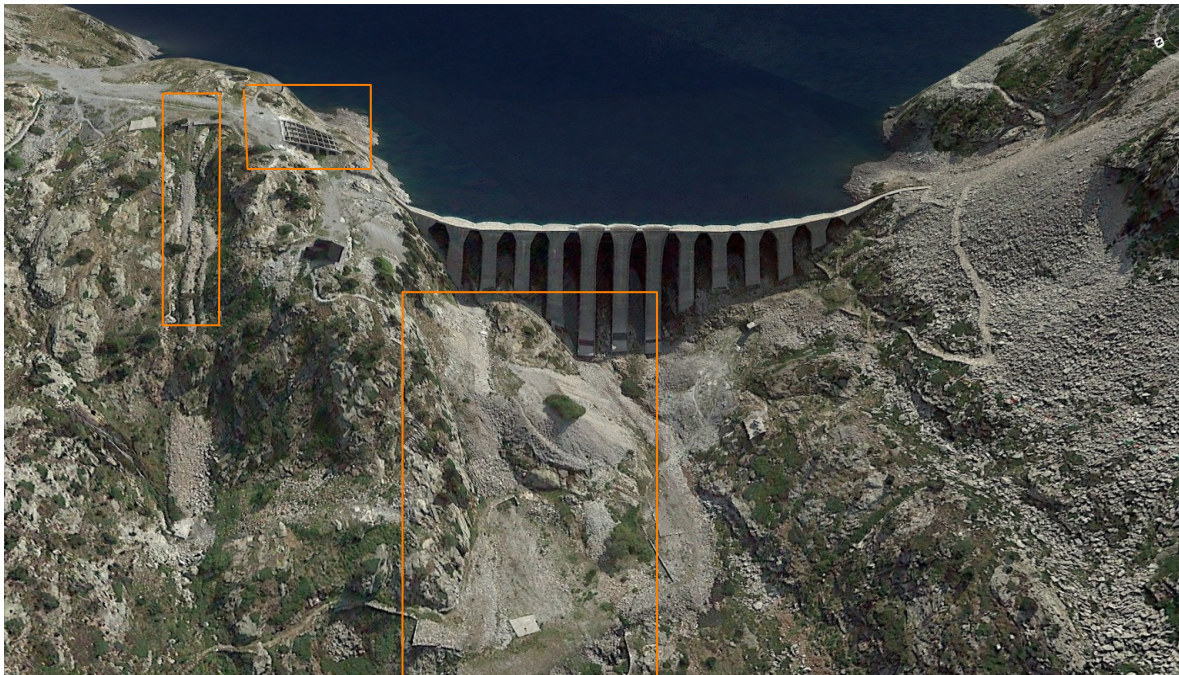
Ortoimagen de la presa de Respomuso y delimitación de zonas donde todavía quedan restos de las antiguas instalaciones y obras de la presa, tras el proceso, ya llevado a cabo, de restauración ambiental.