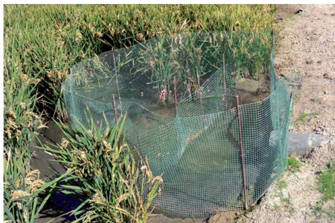
Foto 8. Mallas para evitar la entrada de caracol manzana a parcelas de arroz.