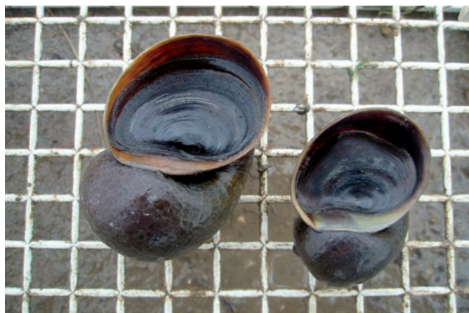
Foto 4. Ejemplares de caracol manzana en los que se aprecia las dimensiones de la abertura y el opérculo.