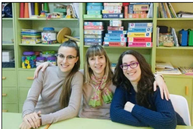
Los servicios de Terapia Ocupacional y Animación Sociocultural

Y sin más preámbulos comenzamos a leer nuestra revista... ¡¡que la disfrutéis!!